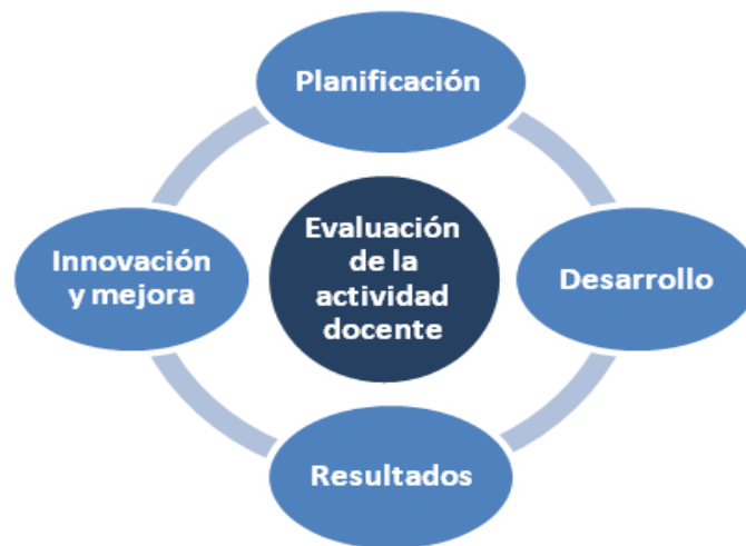
Figura 1. Dimensiones objeto de evaluación de la actividad docente

Para abordar la evaluación de la actividad docente en todos los ámbitos de actuación del profesorado universitario, teniendo en cuenta las fases que se suceden en un ciclo de mejora continua, se han establecido cuatro dimensiones básicas de análisis: planificación de la docencia, desarrollo de la docencia, resultados, e innovación y mejora (figura 1). Cada una de estas dimensiones se articula a su vez en las subdimensiones y variables que se indican en la Tabla 1.