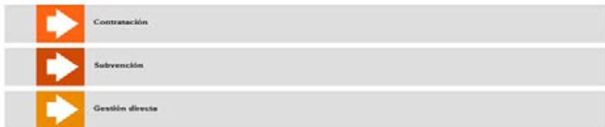
Cuadro 1: Detalle de los procedimientos fundamentales para la ejecución de los fondos europeos en la Universidad de Sevilla.

- Entre los procesos fundamentales que se aplicarán para la ejecución de los fondos europeos, en este caso, del MRR, como a otros de índole similar, cabe indicar los que detallamos a continuación: