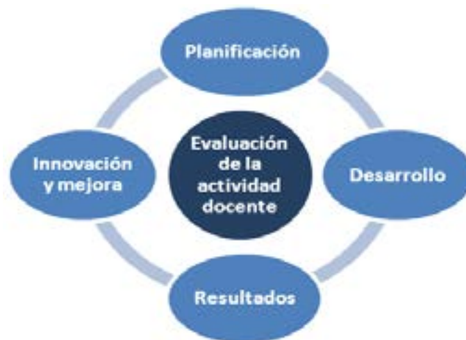
Figura 1. Dimensiones objeto de evaluación de la actividad docente

Para abordar la evaluación de la actividad docente en todos los ámbitos de actuación del profesorado universitario, teniendo en cuenta las fases que se suceden en un ciclo de mejora continua, se han establecido cuatro dimensiones básicas de análisis: planificación de la docencia, desarrollo de la docencia, resultados, e innovación y mejora (figura 1). Cada una de estas dimensiones se articula a su vez en las subdimensiones y variables que se indican en la Tabla 1.