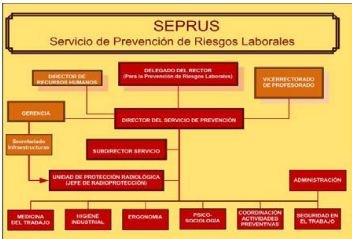
Figura 2. Representación gráfica estructura Servicio de Prevención.

En la actualidad, el Servicio de Prevención propio de la Universidad de Sevilla, está estructurado de la siguiente manera, dando cobertura a las 4 disciplinas preventivas establecidas por la legislación: