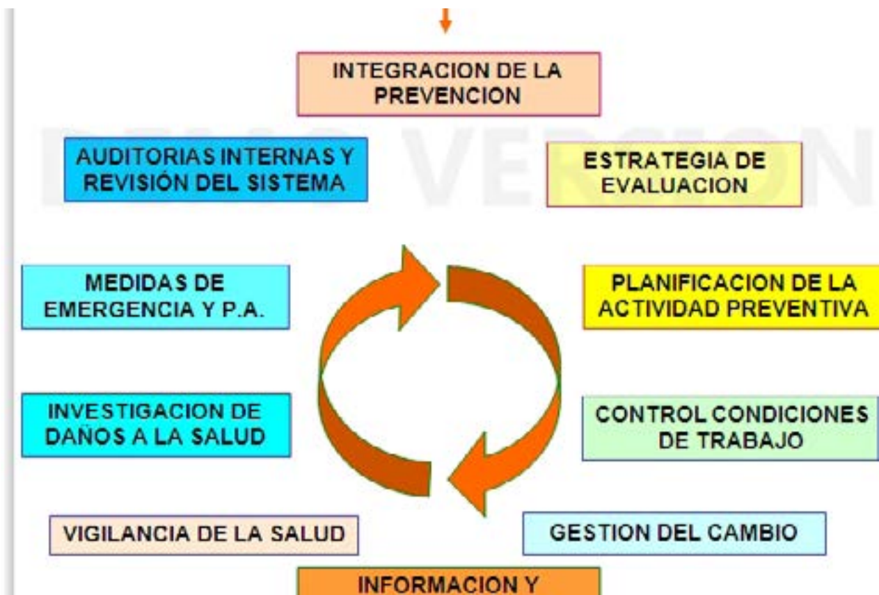
Figura 1. Proceso de retroalimentación del sistema de Prevención.

Finalmente, una vez implantado, la actuación del Sistema de prevención sigue un proceso cíclico, de retroalimentación (ver figura 1).