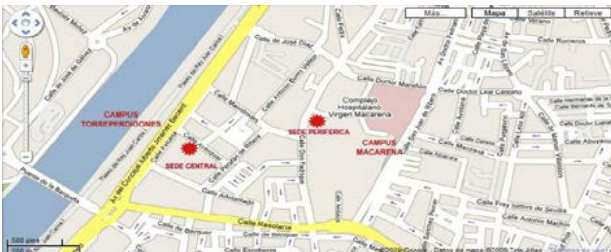
Figura 3. Sedes del SEPRUS

En cuanto a las instalaciones del Servicio de Prevención, se ubican en dos sedes, tal y como podemos ver en el mapa de la Figura 3.