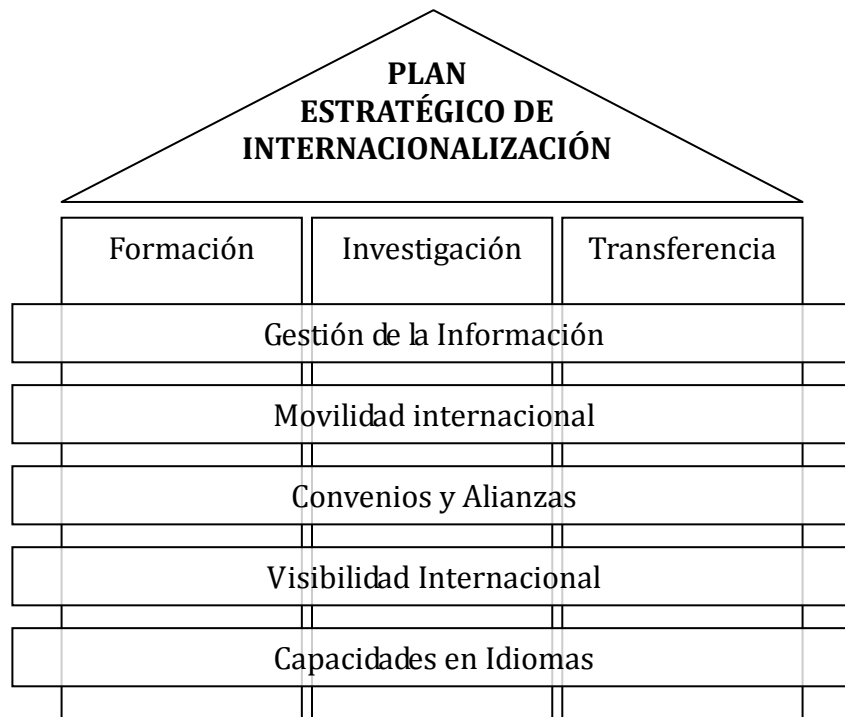
Figura 3: Plan estratégico de Internacionalización de la Universidad de Sevilla

Para la gestión y puesta en marcha del presente plan, la Universidad de Sevilla cuenta con el Vicerrectorado de Internacionalización, que desarrollará el carácter estratégico de las líneas de actuación propuestas, y con el Centro Internacional que, en su papel de centro de recursos transversales y de apoyo para toda la universidad, será el encargado de llevar a cabo las acciones tácticas contempladas en el presente documento.