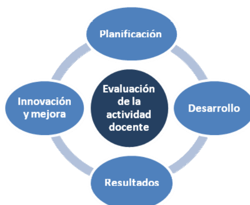
Figura 1. Dimensiones objeto de evaluación de la actividad docente

Para abordar la evaluación de la actividad docente en todos los ámbitos de actuación del profesorado universitario, teniendo en cuenta las fases que se suceden en un ciclo de mejora continua, se han establecido cuatro dimensiones básicas de análisis: planificación de la docencia, desarrollo de la docencia, resultados, e innovación y mejora (figura 1). Cada una de estas dimensiones se articula a su vez en las subdimensiones y variables que se indican en la Tabla 1.