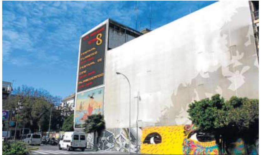
La lona usada como soporte publicitario.

Estos jóvenes plantean también la posibilidad, si fuera posible que el Ayuntamiento acometiera una primera fase de obras para habilitar mínimamente el espacio, de que éste pudiera ser visitado o, al me-