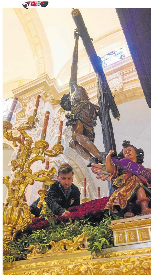
El gasto de flores oscila entre 600 y 2.000 euros.

del mundo cofrade han surgido nuevas empresas como Tour Cofrade , centrada en las rutas turísticas por los principales templos y talleres artesanales de la ciudad. También se ha explorado en estos años la parcela administrativa de las hermandades. En eso se han convertido en todo un referente los responsables de Ghercof , un programa de gestión interna que permite llevar a cabo las tareas propias de gobierno de una hermandad, todo a través del uso de la nube y la comunicación directa con los usuarios. En la parcela del marketing también han existido claros avances en estos años. Como ejemplo, la iniciativa de la marca Nazareno Dame un Caramelo , que trabaja en la personalización de sus clásicos envoltorios con el escudo de cada hermandad.