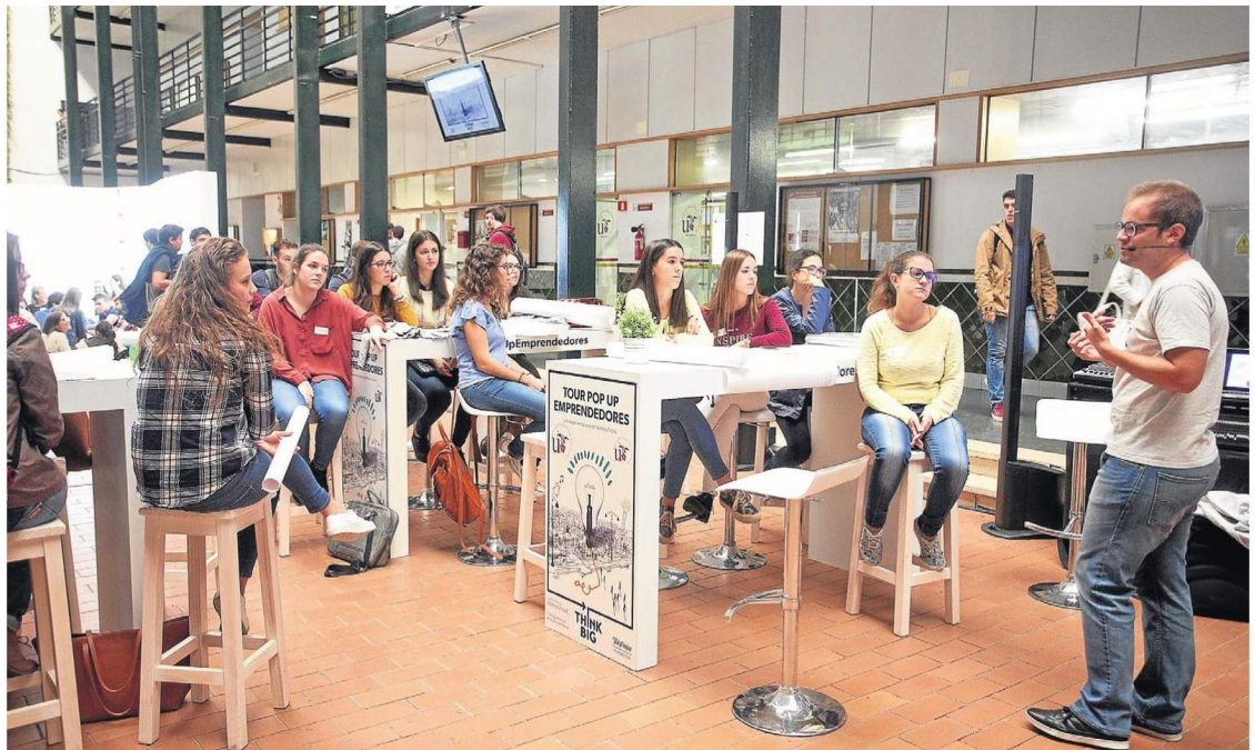
Una iniciativa de emprendedores desarrollada en la Universidad de Sevilla.

Universidad. Es un buen momento para despertar la creatividad y dar forma a las ideas. La Hispalense y la UPO fomentan este caldo de cultivo