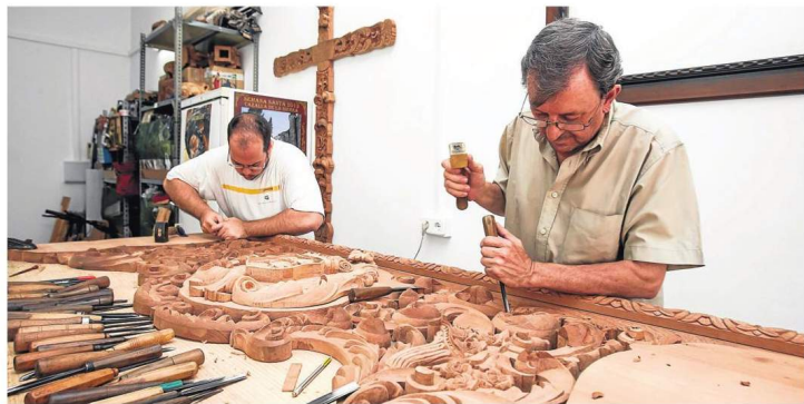
Los tallistas y carpinteros se han visto obligados a buscar nuevos mercados

la mayoría de los negocios han logrado «capear los baches sociales y económicos». En este sentido, se insiste en la certeza de que «la demanda de productos de arte sacro está muy condicionada por la situación socioeconómica», teniendo que decidir las hermandades «qué porcentaje de sus ingresos dedican a invertir en su patrimonio o a la bolsa de caridad».