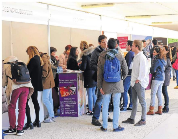
Feria de empleo y emprendimiento promovida por la UPO.