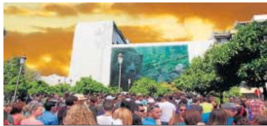
La fachada podría ser escenario o pantalla de cine y proyecciones.