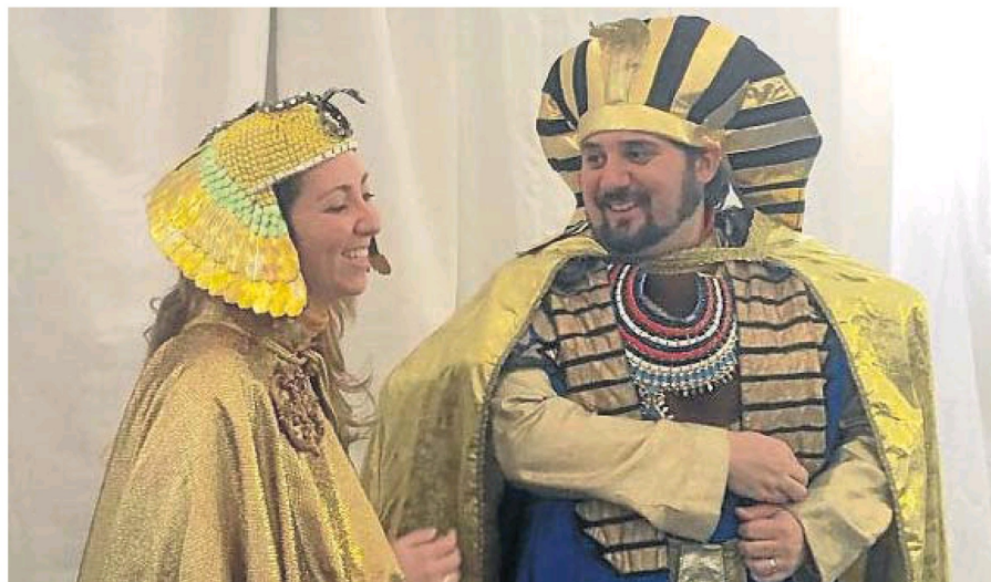
La compañía sevillana logró recuperar el vestuario de Tamayo para 'La corte de Faraón'.

Me acerqué a Cajamadrid a pedir una subvención para financiar los primeros trajes de chulapa, el CAT nos prestó trajes costumbristas que tenía, luego la Universidad también ayudó con la cartelería... y de buenas a primeras me encuentro que los que eran mis clientes institucionales de la empresa (dedicada a comunicación institucional, azafatas, protocolo, logística de eventos...) se unen a mí para sacar adelante un proyecto social y cultural, convirtiéndose en mis amigos y en mis apoyos para seguir sacando esto adelante».