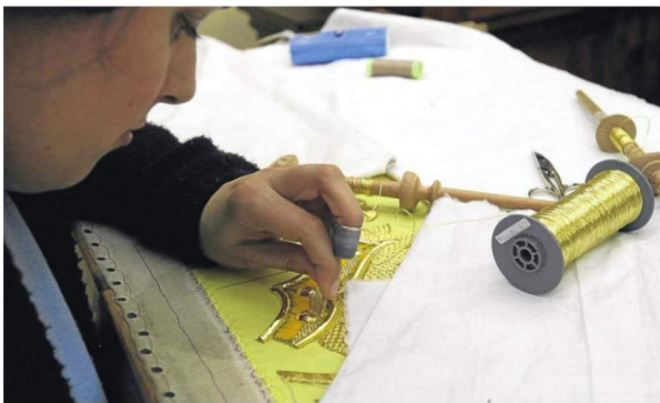
Sevilla cuenta hoy con más de una veintena de talleres de bordados.