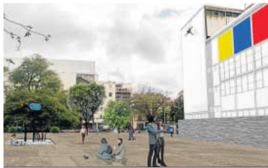
Idea para unir la plaza al edificio, con un mismo pavimento y sin tráfico.

nos, iluminado por dentro para que su arquitectura pudiera ser apreciada y explicada a la ciudadanía. Entre adoquines se ofrece para montar una exposición con este objetivo. Es más, las intervenciones no se quedarían ahí, sino en el entorno. Desde la asociación se recuerda que el edificio se encuentra en el medio de un sistema de espacios públicos: plazas de la Gavidia, del Duque y de la Concordia. “Espacios que han sido invadidos por