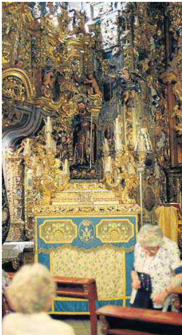
La imagen de San José ayer en el paso preparado para la salida.

El coste total de la restauración integral de las valiosas pinturas murales, que se encuentran en un estado muy deficiente, y del conjunto de bienes muebles asciende a 1,4 millones de euros, según se recoge en el proyecto redactado