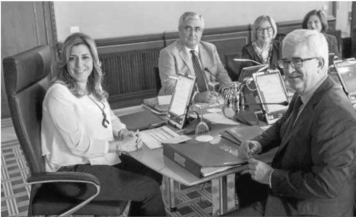
Reunión del Consejo de Gobierno de la Junta de Andalucía en la presente legislatura.