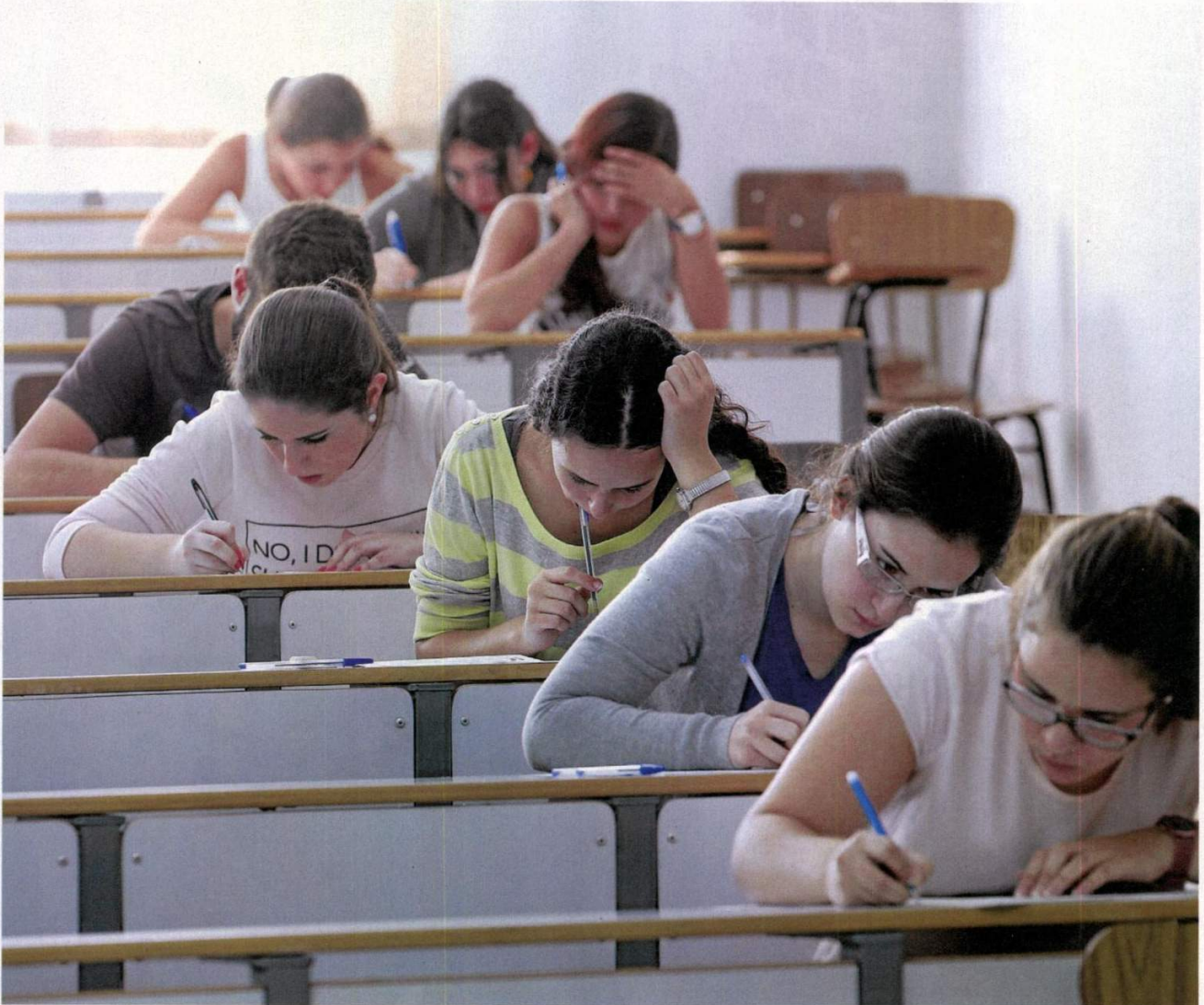
16-06-2015. Pruebas de selectividad en la Universidad de Córdoba