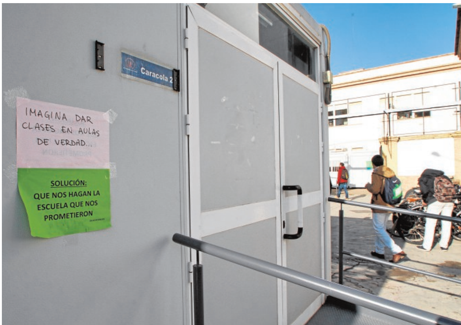
Caracolas instaladas en el patio del centro como aularios ante la falta de espacio que acusa el inmueble