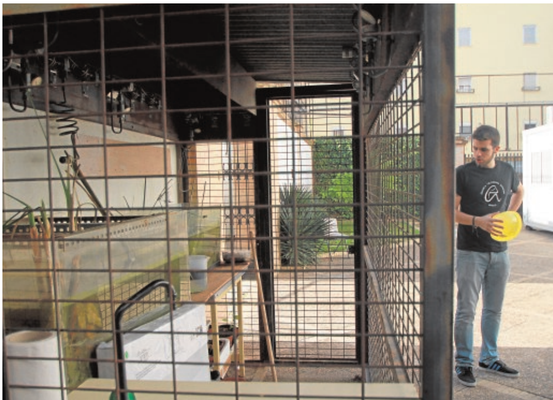
Un «laboratorio» improvisado para prácticas en el exterior de la Escuela

Todo ello ha derivado en unas condiciones de gran estrechez para la docencia —con una ratio de 4 metros cuadrados por estudiante cuando se precisarían del orden de 11 para un centro de estas características—, donde el deterioro de las instalaciones y la falta de espacio son tan acusadas que hacen inviable, por ejemplo, poder adaptar siquiera ocho metros cuadrados para un profesor «con dos premios nacionales en su haber que viene a dirigir dos tesis y que requiere una mínima superficie para instalar el aparataje necesario para las labores de investigación. Eso, en el siglo