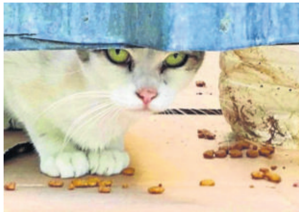
Uno de los más de 20 inquilinos felinos de la Gavidia.

Gracias a la labor en distintas direcciones de las asociaciones especializadas el Ayuntamiento de Sevilla se comprometió el pasado mes de abril a iniciar un modelo de colonias controladas de gatos que permitirá disfrutar de estos animales en la ciudad y mirar por su protección y bienestar, al mismo tiempo que disminuirán los problemas de superpoblación, garantizará una adecuada integración a la realidad urbana y fomentará una convivencia respetuosa entre la ciudadanía y los ani-