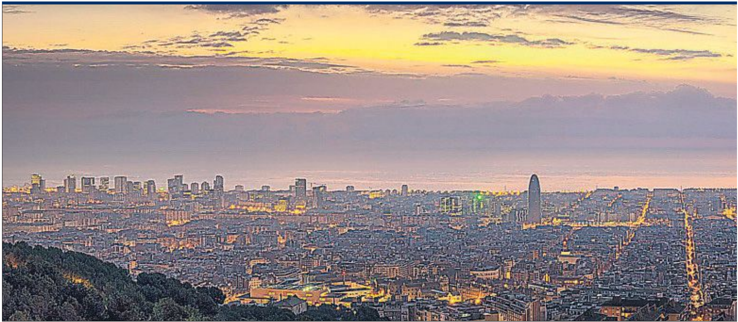
Imagen de un amanecer en Barcelona, donde el próximo domingo saldrá el sol a las 7.22 h