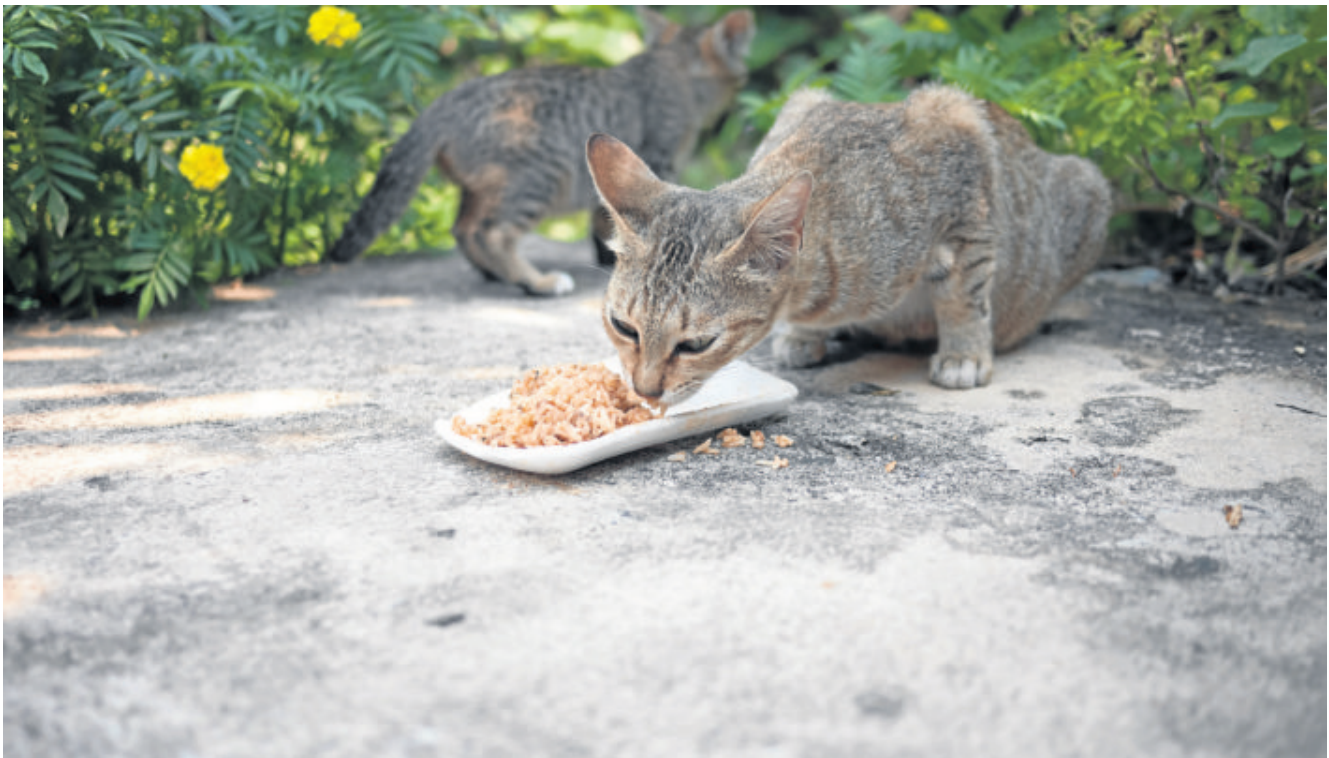
Un gato de la colonia de la Universidad de Sevilla acude a comer gracias a la intervención de las numerosas personas implicadas en su protección y cuidados.