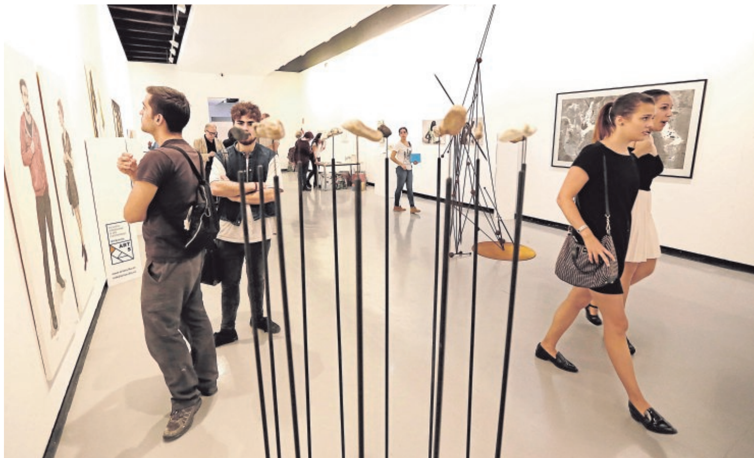
La inauguración de ARTSevilla tuvo lugar ayer en la sala Santa Inés, epicentro expositivo del encuentro