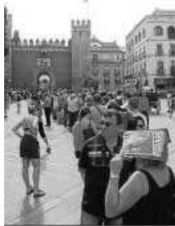
M. J. LÓPEZ

Por otra parte, la Junta anunció ayer que los alojamientos hoteleros andaluces han recibido un total de 7,6 millones de viajeros en verano, en los meses de junio, julio, agosto y septiembre de este año, superando en un 4,6% los datos del año anterior. En el mismo periodo, las estancias hoteleras sumaron más de 24,8 millones, lo que refleja un incremento del 4,9%. Sevilla es la provincia en la que más crecieron las pernoctaciones, por encima del 7%.