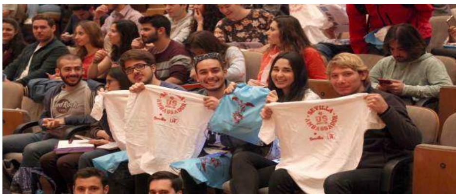
Estudiantes en la US