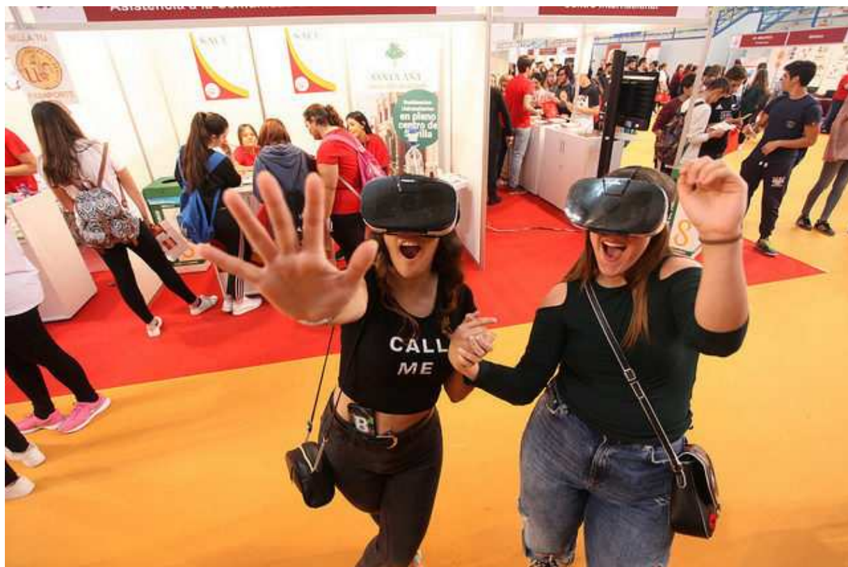
Dos estudiantes en una de las actividades lúdicas del salón.

Durante seis días la Universidad de Sevilla recibirá a más de 16.000 estudiantes preuniversitarios (de 3º y 4º de ESO, 1º y 2º de Bachillerato y Ciclos Formativos de Grado Superior), procedentes de 173 Centros de Secundaria de la provincia de Sevilla y 13 Centros de las provincias de Huelva, Cádiz, Córdoba y Badajoz. Todos los visitantes tendrán la oportunidad de conocer en un único espacio toda la oferta formativa, de investigación, cultural y de servicios de la Universidad de Sevilla, así como su oferta deportiva a través de Ferisport. Esta edición se desarrollará hasta el 29 de abril de 2017 en el Complejo Deportivo Universitario Los Bermejales (Avda. de Dinamarca, s/n).