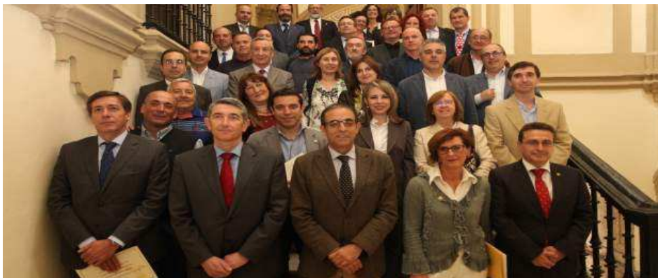
Reconocimientos Prevención De Riesgos Laborales (UNIVERSIDAD DE SEVILLA)