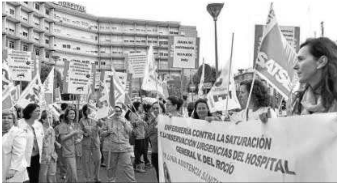
Trabajadores de enfermería convocados por el Satse en las Urgencias del Hospital General.