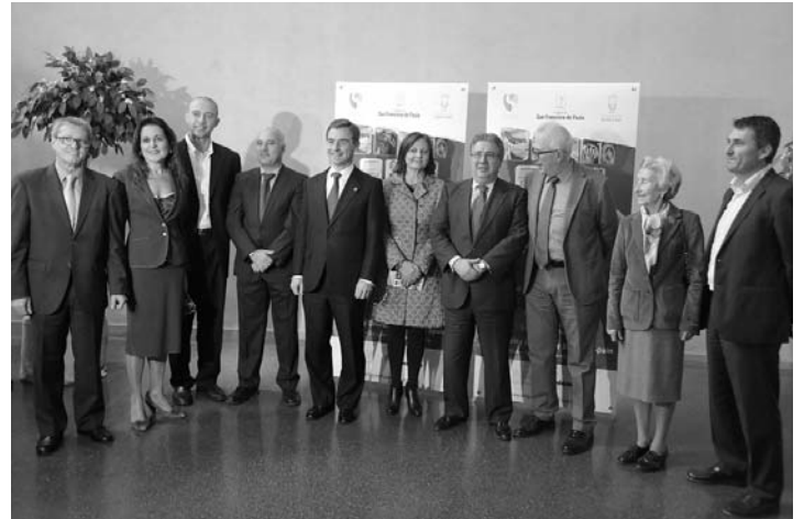
Un momento de la presentación en el Maestranza de la cumbre de la Singularity University.