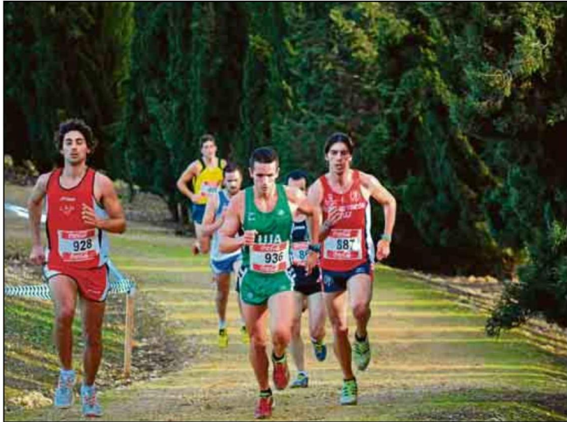
Los interesados ya pueden saber las sedes de los Campeonatos Universitarios de Andalucía.

ARRANQUE SE ESPERA QUE COMIENZE A PARTIR DE MARZO