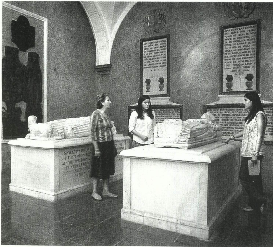
Los sarcófagos de Lorenzo Suárez de Figueroa y Benito Arias Montano.