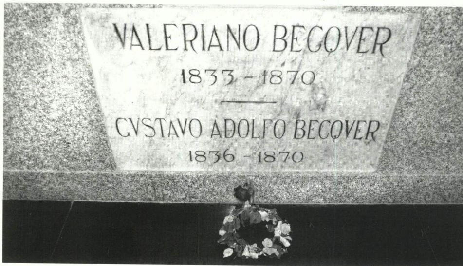
Hay personas que suelen dejar alguna flor frente a la lápida de los hermanos Bécquer.

Gustavo Adolfo Bécquer es sin duda la personalidad estelar del recinto y su tumba es la más visitada por muchos románticos. Precisamente, frente a su lápida, la gente suele depositar algunas flores. La figura de un ángel con el libro de Rimas se alza sobre esa lápida y se pueden ver dos golondrinas como homenaje a su famoso poema. En los resquicios de ese ángel los visitantes sue-