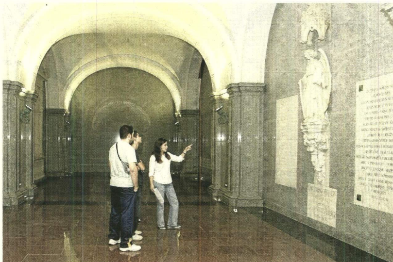
Cada viernes hay visitas guiadas gratuitas en el panteón. / José Manuel Cabello