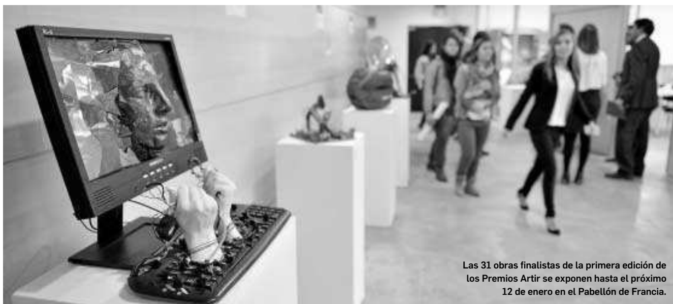
Las 31 obras finalistas de la primera edición de los Premios Artir se exponen hasta el próximo 12 de enero en el Pabellón de Francia.