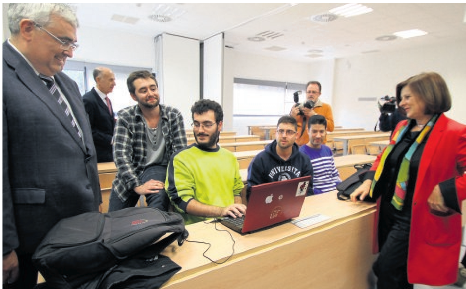
El rector de la Universidad de Sevilla y la consejera de Salud con varios estudiantes en una de las aulas