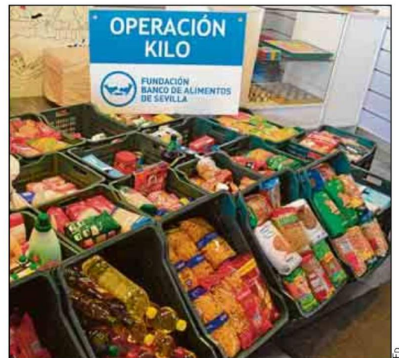
El SADUS promueve la recogida de alimentos no perecederos.

talaciones del Servicio de Actividades Deportivas de la US en el Complejo Deportivo Los Bermejales en horario de 10:00 a 14:00 horas y de 16:00 a 19:00 horas de la tarde.