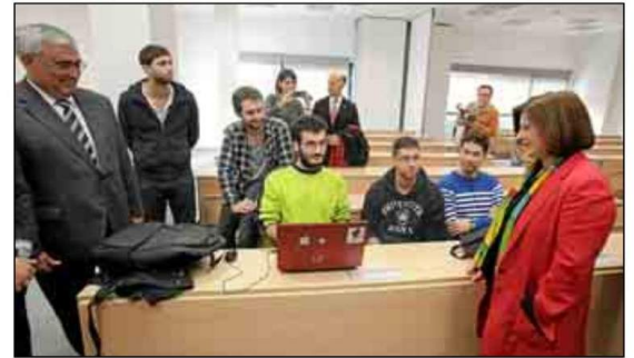
La consejera y el rector charlan con algunos estudiantes, ayer. CONCHITINA

En el caso del Hospital de Valme, donde se forman cada año 510 estudiantes, 300 de Medicina y 210 de Enfermería, se ha construido una ampliación del pabellón docente actual con capacidad para 588 alumnos.