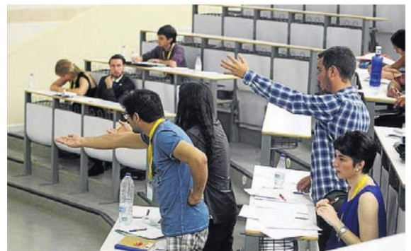
▶ Participantes solicitando puntos de información en un debate.