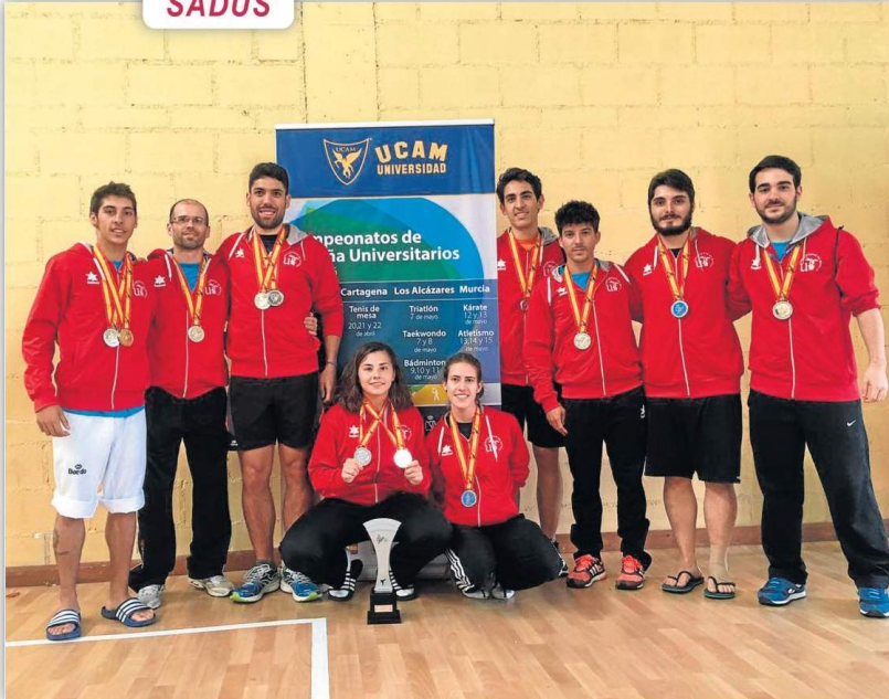
El SADUS pone a disposición de los usuarios sus tradicionales Ayudas Deportivas. ED