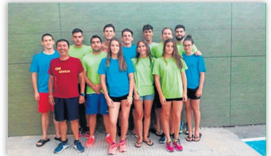
Buen papel de los representantes del C.D. Universidad de Sevilla. ED

Propias' o en el apartado de Ayudas Deportivas de esta página web. Del mismo modo, los solicitantes que posean un certificado digital de la FNMT o DNI electrónico podrán presentar su solicitud de forma telemática a través de la Sede Electrónica de la Universidad de Sevilla en el apartado 'Procedimiento y Servicios destacados'. Para conocer los requisitos en las Ayudas, así como el proceso de selección que llevará a cabo la Comisión de Becas de la Universidad de Sevilla y baremos para la evaluación de los candidatos, se pueden consultar las bases de la convocatoria en las páginas web anteriormente expuestas.