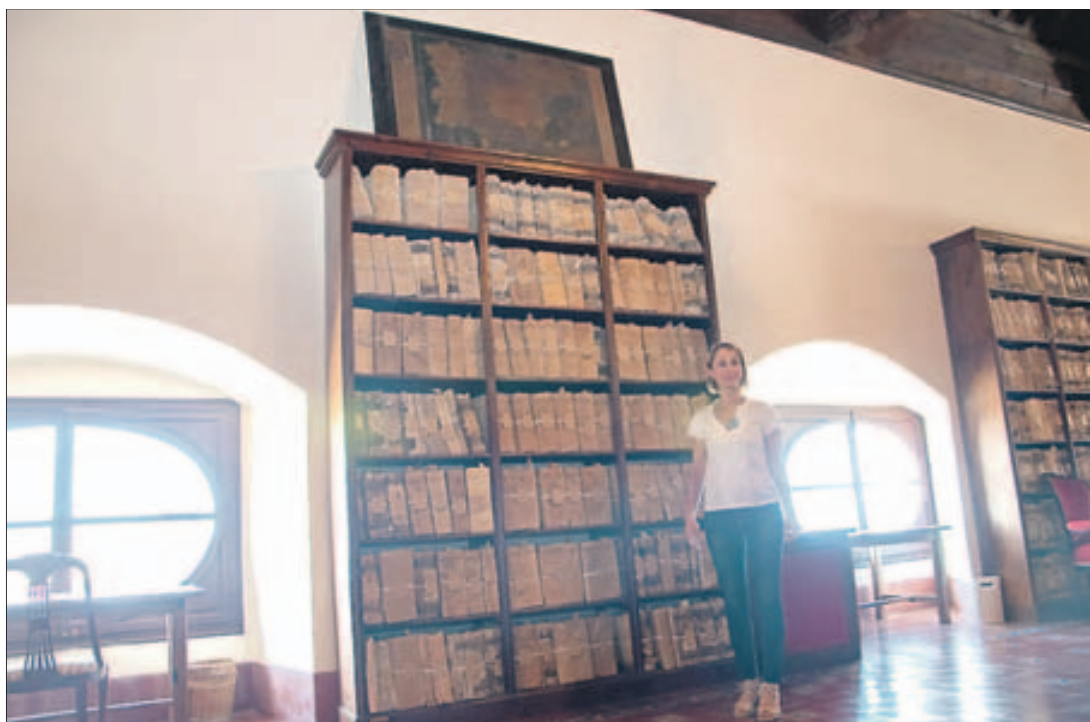
IESI'S DEL GADO