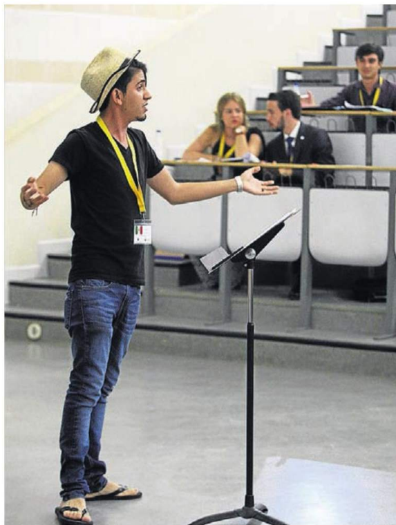
▶ Orador de la Universidad de México en mitad de su exposición.