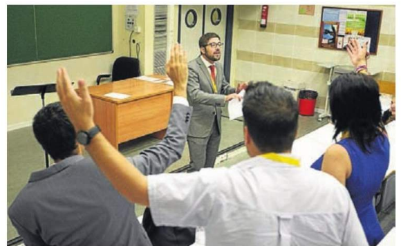
▶ Réplicas de un equipo durante la defensa de una moción.

Aplausos traducidos en golpes en la mesa, como apoyo al compañero del equipo de debate