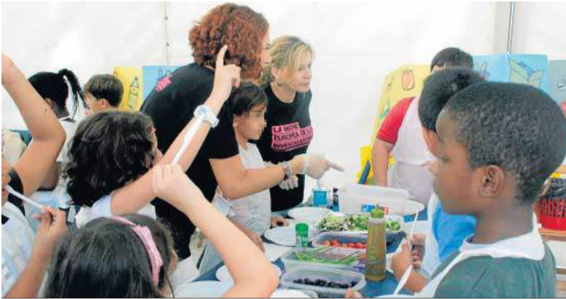
Taller de verduras, ayer en la Plaza Nueva.