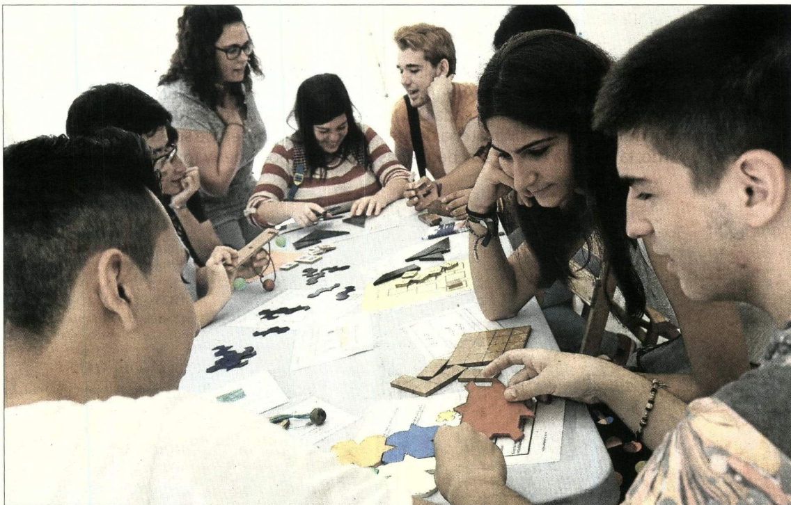
Los juegos geométricos y de lógica centraron algunas de las actividades organizadas por CSIC, la Hispalense y la Universidad Pablo de Olavide.

En la carpa instalada en la Plaza Nueva y en otros emplazamientos como la sede de la Fundación Cajal o el Alcázar—donde el recién pre-