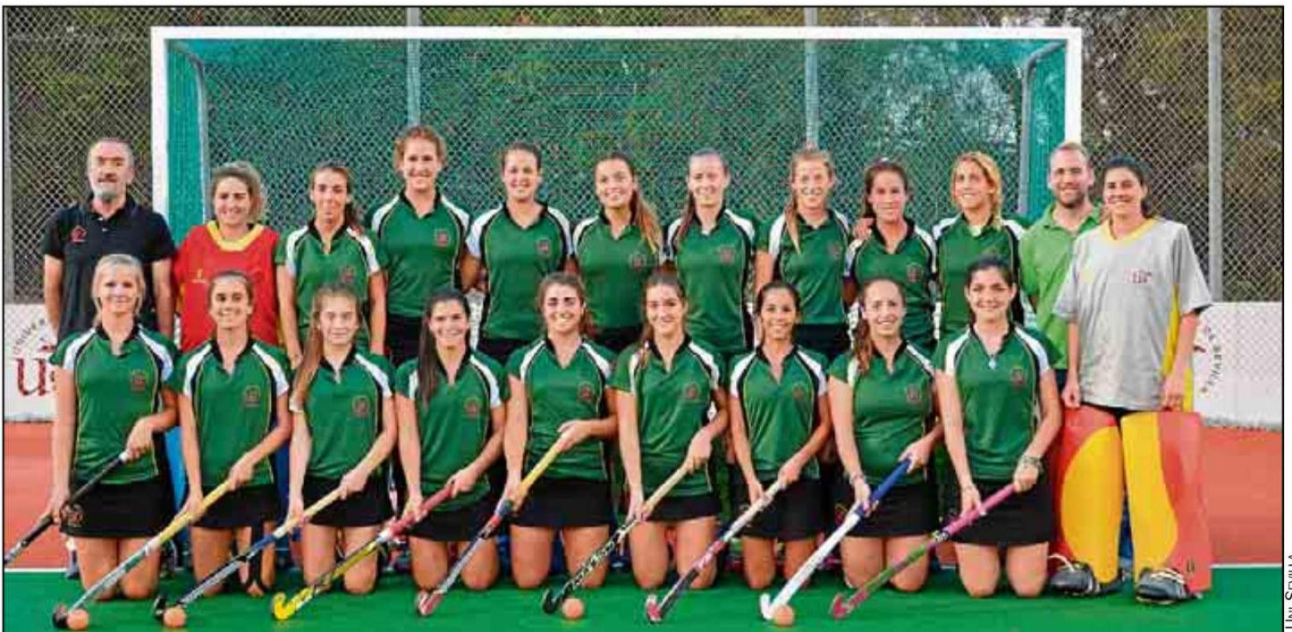
En la imagen, foto oficial del equipo de hockey femenino del Universidad de Sevilla; jugadoras y cuerpo técnico se conjuran para hacer un gran año.