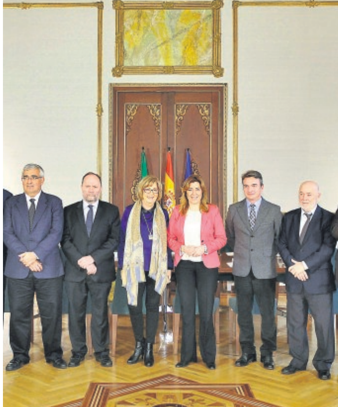
Susana Díaz, con los rectores andaluces en una reunión anterior