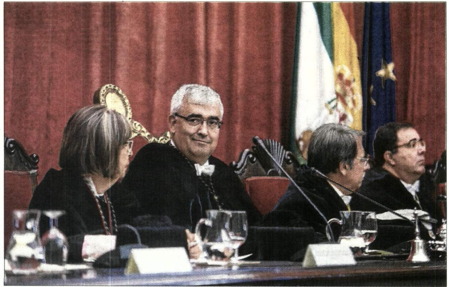
El rector de la Hispalense presidió ayer el solemne acto de apertura del curso académico en el Paraninfo.

«Durante este curso insistiremos en la rigurosa aplicación del modelo de financiación, que supone al menos 1.135 millones de euros de financiación operativa incondicionada —el dinero necesario para abrir los centros, al margen de otras cantidades condicionadas a objetivos—,