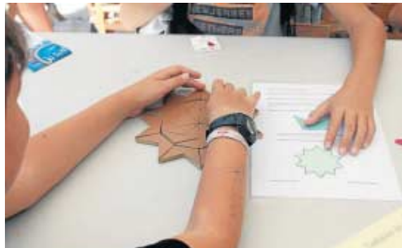
Taller de construcción tridimensional.

Fueron muchos los encargados de llevar la investigación a los más pequeños por la mañana y a los adultos a lo largo de todo el día con talleres, microencuentros con científicos, conferencias, teatro o danza, entre otras acciones. La Olavide lo hizo también con más