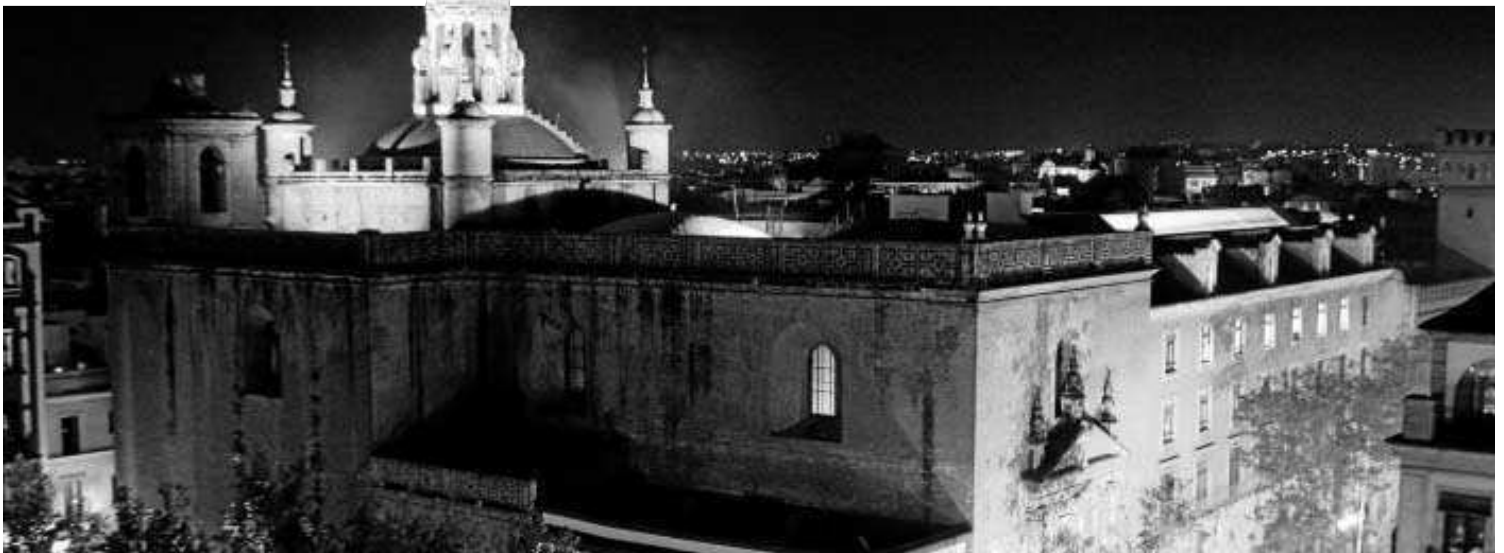
Una imagen nocturna de la Iglesia de la Anunciación.

La información que ahora se mostrará es la que se ha recopilado para redactar el proyecto de restauración integral del templo, obras cuyo inicio están aún por determinar debido a la actual crisis económica. Como tantos otros proyectos de la Hispalense, está a la espera de que se pueda garantizar su financiación.