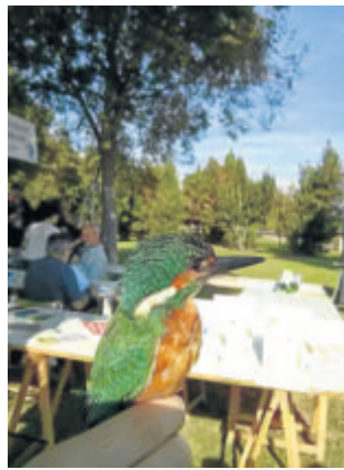
Parque del Alamillo DISTRITO NORTE

▶ Más allá de la estampa típica de una marea de palomas en busca de arvejonas en las manos de los visitantes, las especies animales del Parque de María Luisa -catalogado como parque histórico- van desde los majestuosos pavos reales a los cisnes blancos, pasando por el jilguero y el mirlo común, hasta varios tipos de lo que cualquier mortal consideraría un «pato» pero con nombres tan poéticos como ánade real, tarro canelo o barnacla. Y si también hay algo por lo que este parque destaca es por su espectacular e histórica flora. Tal y como señala el itinerario botánico realizado por la Plataforma Ciudadana por los Parques, los Jardines y el Paisaje de Sevilla, entre los ejemplares de árboles más destacados se encuentran las dos jacarandas situadas delante del Pabellón Real -donadas por un súbdito inglés y plantadas en 1921-, las esbeltas araucarias de la Plaza de América o el ginkgo y, en la glorieta de Goya, el colosal árbol de las lianas. ■