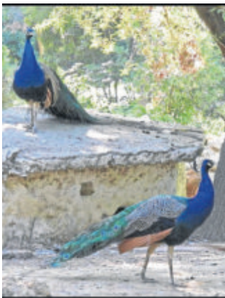
Parque de María Luisa DISTRITO SUR