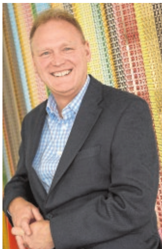
Buck, en Madrid

—Personalmente, estoy muy triste por la decisión que tomaron los británi-