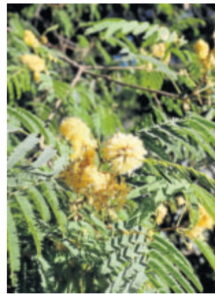
Parque Amate DISTRITO CERRO-AMATE

▶ Pocos son los sevillanos que desconocen las posibilidades de ocio que ofrece el Alamillo. Pero, ¿sabía que en sus suelos crecen más de 30 especies de árboles divididas en 11 zonas? En concreto, existen saucedal-alameda, olmeda-fresneda, bosque de transición, lentiscar, alcornocal, alcornocal-pinar, encinar, encinar-pinar, acebuchal-algarrobal, pinar y naranjal. Asimismo, en él se pueden observar el 25 por ciento de las especies de aves existentes en España, entre las que se encuentran las que usan la zona de lugar de invernada, como el petirrojo, el colirrojo tizón o la tarabilla común; las que habitan el parque todo el año, como la gallineta común o el verderón; o aquellas que usan las buenas condiciones del parque para alimentarse, como el Martín pescador, el cormorán grande o el cernicál vulgar. La rana común, el sapo corredor y el de espuelas representan a los anfibios y, entre los mamíferos, no es raro encontrar erizos terrestres, conejos o topillos. ■