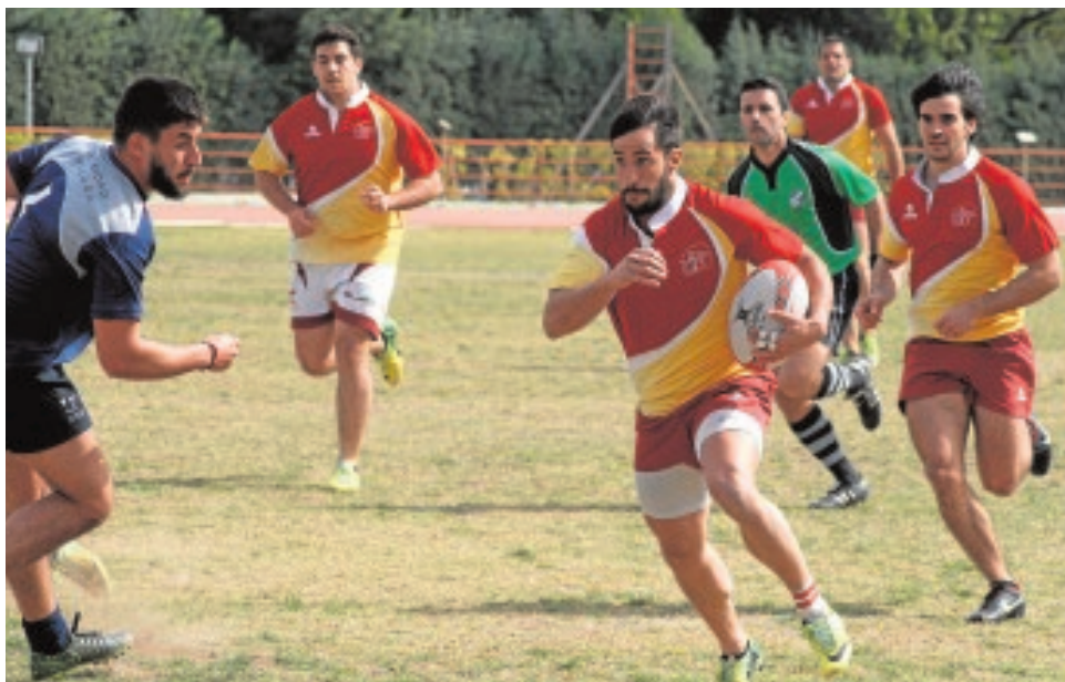
Partido de la selección de rugby sevillana contra la malagueña

Para el miércoles 2 de noviembre están citados los deportistas de fútbol sala masculino a las 14.00 en Los Bermejales, y el jueves 3 se probarán las interesadas para fútbol sala femenino a las 21.00. El entrenamiento de voleibol femenino cerrará esta segunda semana, el viernes 4 a las 13.30 en Los Bermejales.