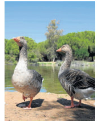
Parque Infanta Elena DISTRITO ESTE-ALCOSA-TORREBLANCA