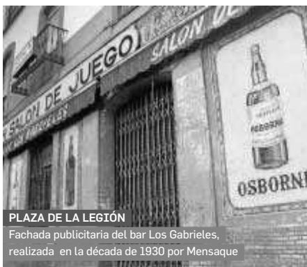
PLAZA DE LA LEGIÓN