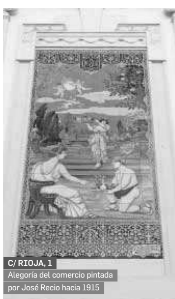
C/ RIOJA, 1 Alegoría del comercio pintada por José Recio hacia 1915

La comisión de Patrimonio, en este caso la local, ha desestimado por tercera vez este cambio de ubicación. Hay otros muchos anuncios cerámicos de gran valor dis-