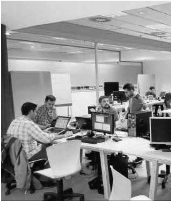
Integrantes de la empresa El Club del Parque.