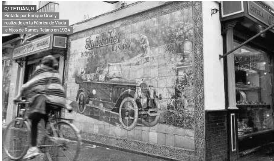
C/ TETUÁN, 9 Pintado por Enrique Orce y realizado en la Fábrica de Viuda e hijos de Ramos Rejano en 1924

Este tipo de paneles han llegado hasta la actualidad como un testimonio directo de la evolución de la publicidad propiciada por el desarrollo comercial e industrial que experimentó Sevilla a principios del siglo XX. La cerámica, una técnica artística tan vinculada a la