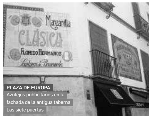
PLAZA DE EUROPA

Fachada publicitaria del bar Los Gabrieles, realizada en la década de 1930 por Mensaque