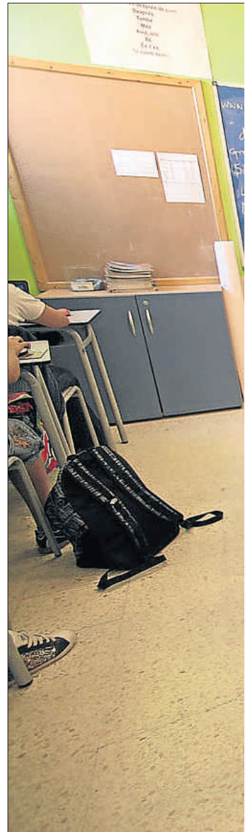
La brecha. La desigualdad entre niños y niñas en los resultados escolares se refleja también en los porcentajes de abandono escolar. Los varones entre los 18 y 24 años que no tienen la ESO son un 9,8%, frente al 5,5% de las chicas.

El estudio de la UB indica que no se trata de cambiar la escuela, sino la sociedad