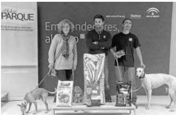
Donación a una protectora dentro de El Cubo.