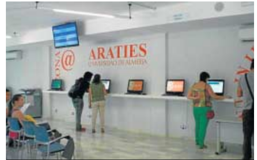
Araties es el lugar donde los alumnos gestionan sus matrículas.

Estas ayudas están financiadas con más de 2,5 millones de euros y tienen un importe medio previsto de 40.000 euros por beca. El objetivo es crear nuevas oportunidades formativas para que los jóvenes andaluces adquieran experiencia y conocimientos que luego puedan revertir en Andalucía, especialmente en la mejora de la competitividad internacional y de la capacidad de innovación de las empresas.