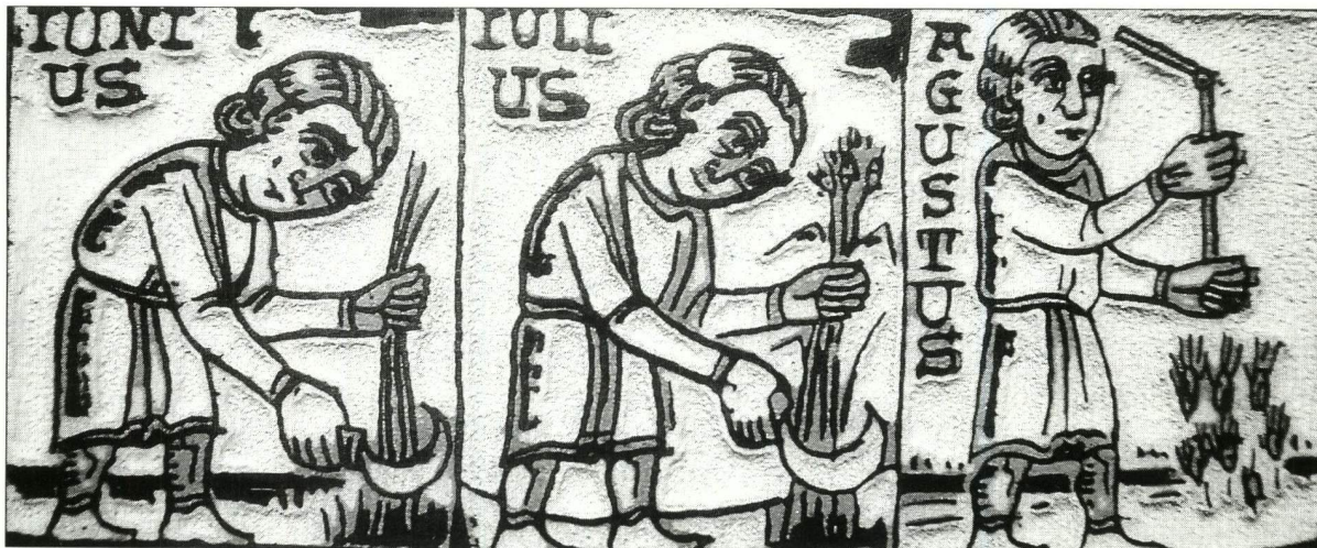
Imágenes difundidas por la Universidad de Sevilla de jornaleros andaluces en la Edad Media.

A comienzos del siglo XV, tras un periodo de crecimiento económico y demográfico, en el siglo XVI comienza una crisis agraria importante en la que se pierden muchas cosechas, descendiéndose drásticamente la población debido a múltiples epi-