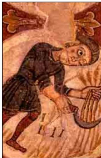
Trabajos agrícolas medievales.

comprender la época de fondo. Se trata de colocar la lupa sobre la gran Historia, sobre lo cotidiano o lo que se llamaría la intrahistoria unamuniana.