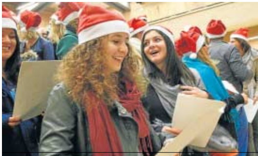
Alumnos Erasmus en un acto navideño celebrado en la UAL.

● Cada alumno podrá contar con entre 100 y 250 euros y los que tienen rentas más bajas recibirán entre 50 y 125 euros más