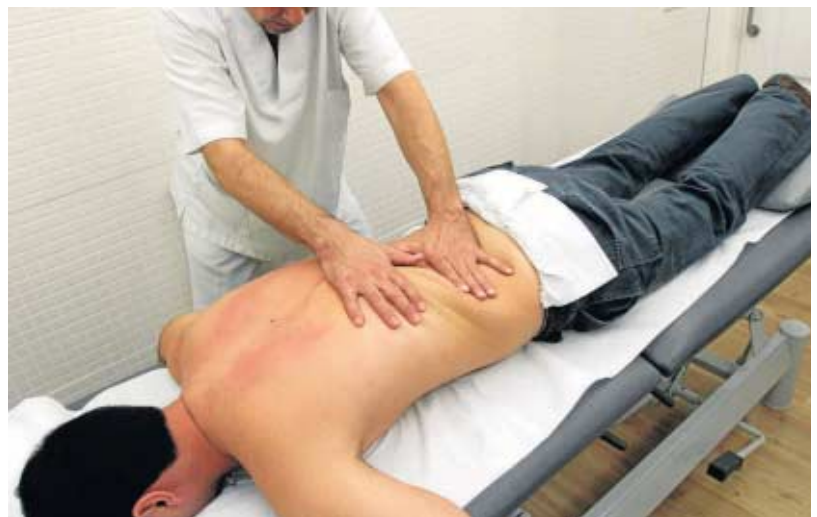
La alta demanda de plazas para estudiar Fisioterapia ha provocado una nota de corte alta.

El 2 de septiembre se publican las listas de la tercera adjudicación de plazas.