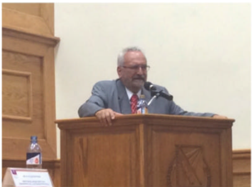
Por: Redacción LUNES 25 DE AGOSTO 2014 11:03

El Director de Periodismo II, de la Facultad de Periodismo, Universidad de Sevilla, España, detalló durante su ponencia en la III Semana Internacional de Comunicación que este movimiento surge principalmente luego de que cientos de periodistas perdieron su trabajo a raíz de la implementación de nuevas tecnologías, en donde por cuestiones de "ahorro" administrativo en las empresas decidieron prescindir de sus servicios.