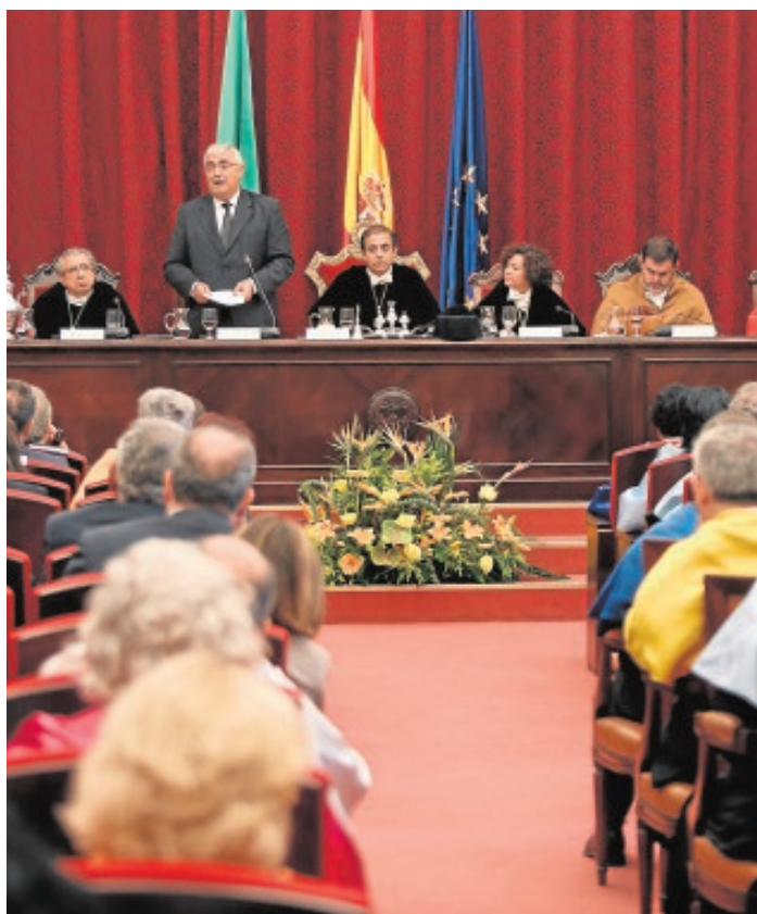
El consejero de Economía durante su intervención en el Paraninfo