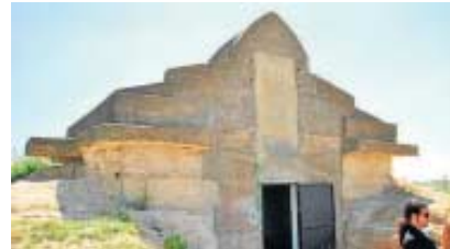
1. Dos turistas, en el interior del Dolmen de la Pastora. 2. Una vista del monumento arqueológico.