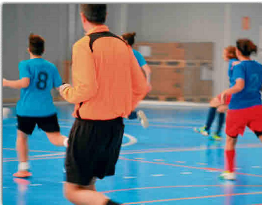
El SADUS trabaja en cursos de arbitraje en las modalidades de fútbol 7, fútbol 11, fútbol sala y baloncesto. ED