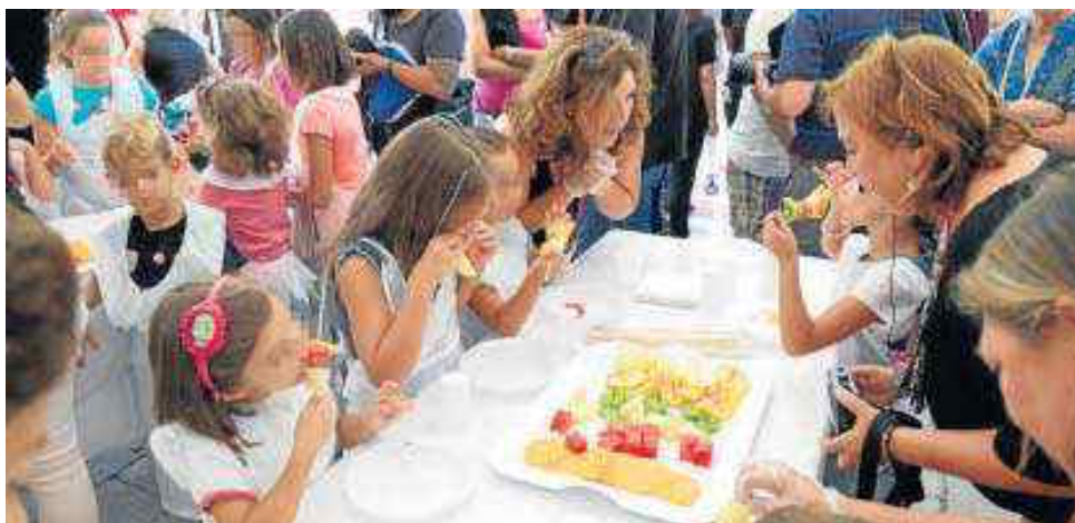
Niños de todas las edades disfrutan de los talleres de alimentación saludable.