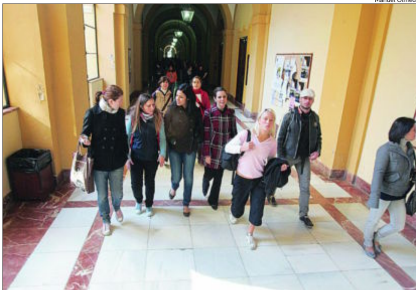
Un grupo de jóvenes camina por los pasillos de la Universidad de Sevilla

cada diez habrán perdido la ayuda, pese a que para muchos es la única forma de continuar sus estudios. Así se desprende de los «Datos y cifras del sistema universitario español. Curso 2014-2015», editado por el Ministerio de Educación y Ciencia (MECD). Una estadística que se vuelve más cruenta atendiendo a la nota con la que se accedió: cuanto más baja, mayor es el índice de pérdida de respaldo institucional. En quienes tuvieron menos de 5,5 de media entre la nota de la PAU y el Bachillerato o FP, el porcentaje asciende hasta el 59%, lo que significa que solo cuatro estudiantes de cada diez mantendrán alguna de las ayudas que recibían. En esa nota de corte, el abandono universitario afecta al 21,5% de los estudiantes tras cursar el primer año, mientras que la media de los estudiantes noveles es del 15,7% –este dato corresponde al curso 2010-2011, último recogido por el MECED–. De los estudiantes que