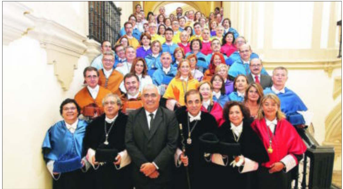
El consejero de Economía y Conocimiento, ayer en la inauguración del curso en la Universidad de Sevilla