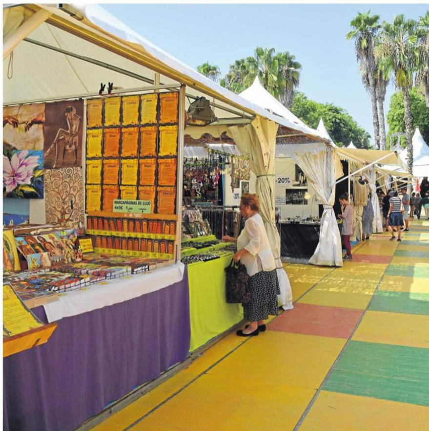
La oferta para el visitante es muy amplia y, a la vez, solidaria y cultural.

de esos galardones desde entonces. Me fascinaba su espíritu de libertad, de romper moldes, de estar al lado de los más necesitados y los más glamourosos a la vez. Nos ayudó a que el Festival se introdujera en la sociedad sevillana.