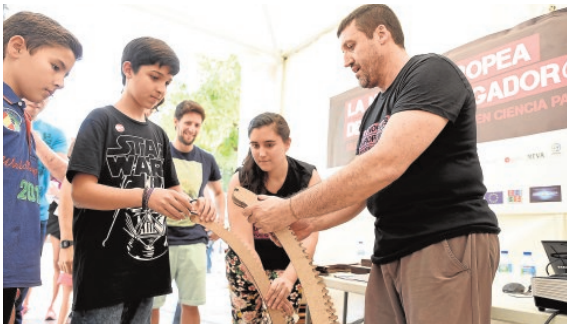
Varios jóvenes atienden las explicaciones de un investigador