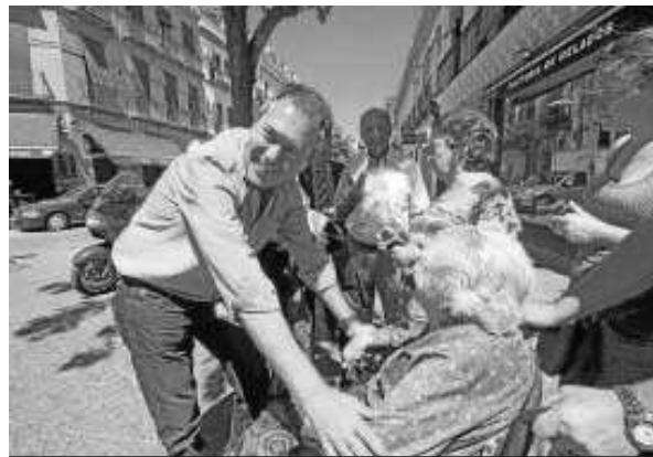
Espadas en la pasada campaña electoral en la calle Castilla de Triana.

En su programa electoral aparece una mención a este tema en punto 347 de su programa electoral, en el capítulo relativo a la movilidad sostenible. El punto