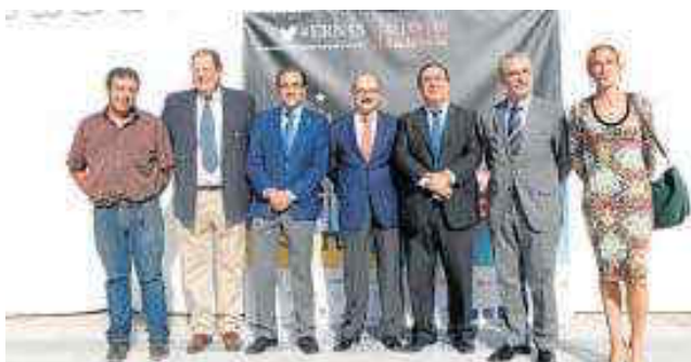
Acto inaugural del evento con las instituciones organizadoras.

● La Noche de los Investigadores reunió en el centro de la ciudad a pequeños y mayores en torno a talleres, microencuentros y conciertos