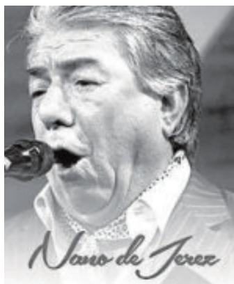
Nano de Jerez