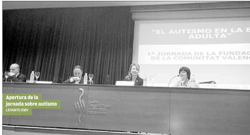
Apertura de la jornada sobre autismo LEVANTE-EMV

► Fundación TEA reúne en Valencia a 600 profesionales de la psicología y la medicina que analizaron los retos vinculados con el espectro autista