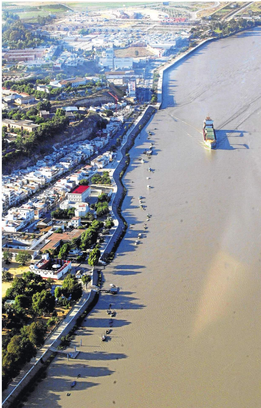
El río Guadalquivir a su paso por el municipio sevillano de Coria del Río.

Economía vs medio ambiente. El proyecto está en suspenso a falta del informe de protección de márgenes