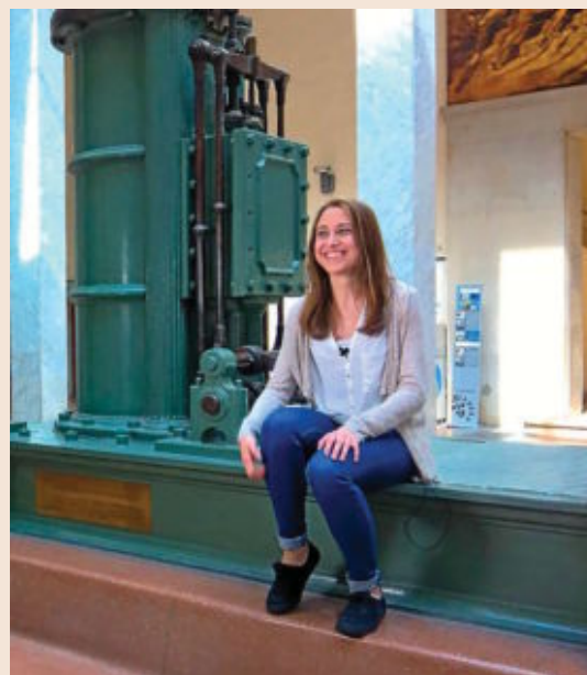
Una alumna de la Escuela de Industriales de la UPM, en plena grabación del 'spot'.

UN VÍDEO VIRAL PARA CONCIENCIAR A LA SOCIEDAD La Real Academia de Ingeniería presenta este jueves un 'spot' que recoge testimonios de profesionales del sector, universitarias y escolares en torno a los estudios de Ingeniería y Arquitectura. Su intención es que llegue a cuanta más gente mejor.