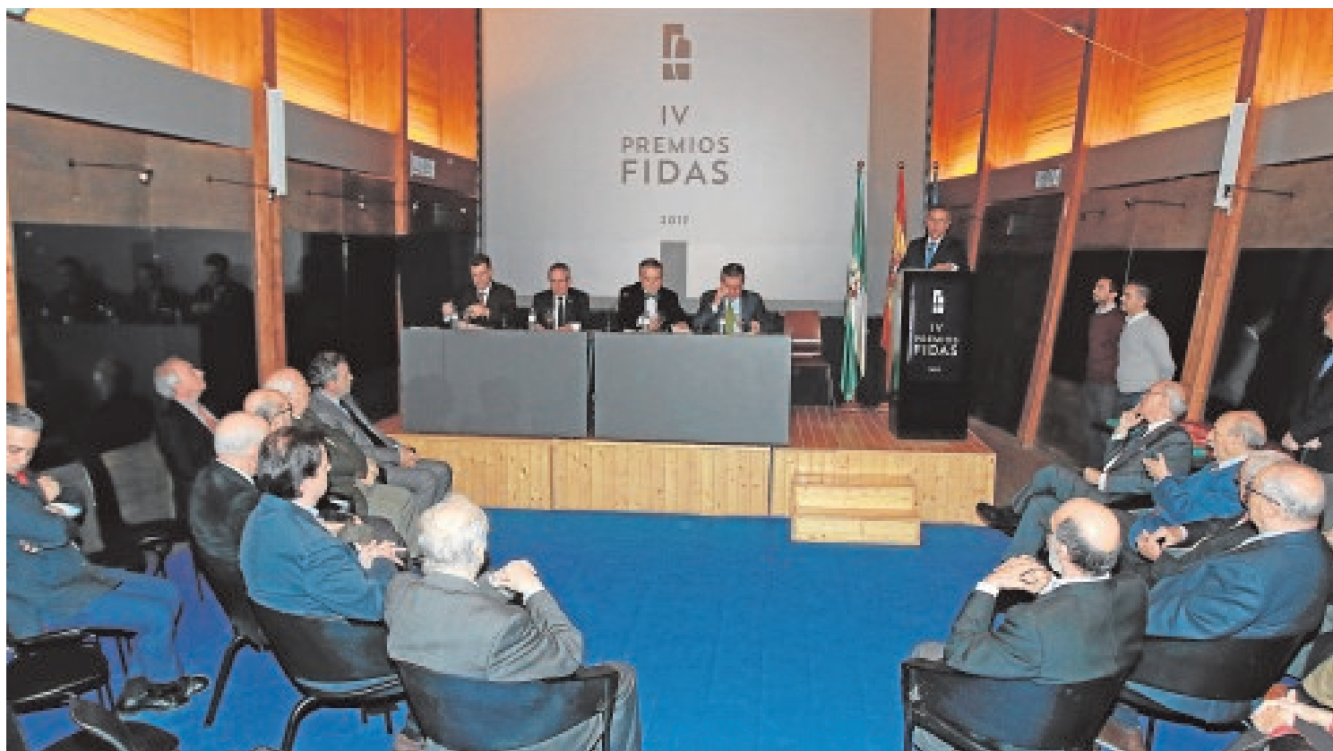
Un momento del acto de entrega de los premios de la fundación Fidas