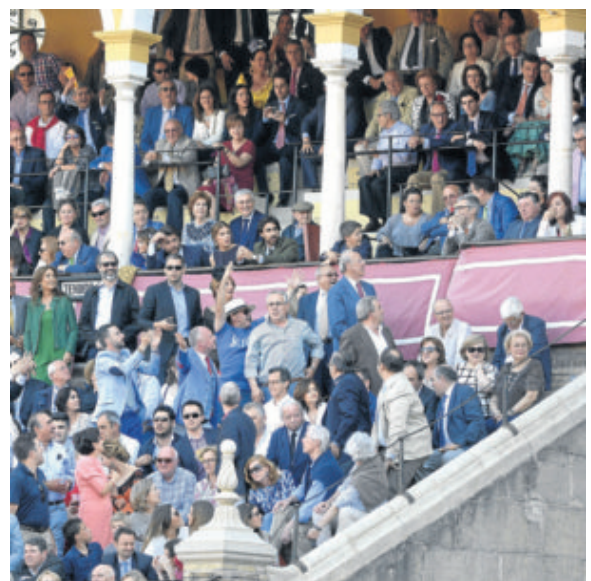
Aficionados en una tarde taurina.

A escasas semanas de empezar una de las campañas turísticas más beneficiosas para la