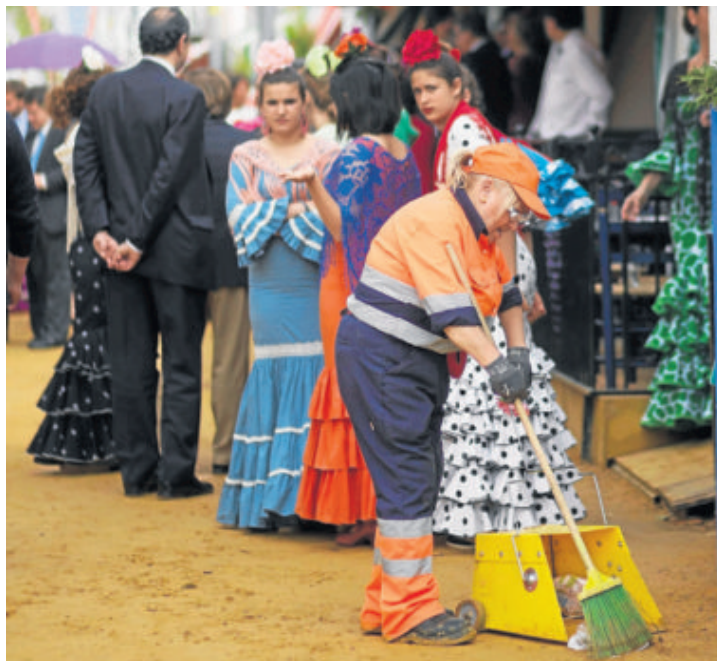
Una limpiadora barriendo las calles del Real de la Feria.

El Ayuntamiento de Sevilla ha puesto en marcha una campaña en las redes sociales aprovechando las Fiestas de la Primavera. La primera acción ensalza los colores de la ciudad con la campaña Sevilla tiene un par-tone especial .