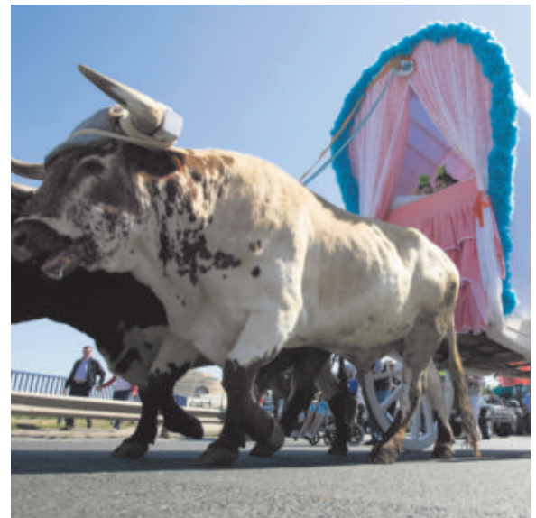
Instantánea de una hermandad durante el camino hacia El Rocío.

Y si tiene que renovar el armario rociero, aprétense los machos , pues la media, tanto para ellos como para ellas, es de 1.000 euros. ■