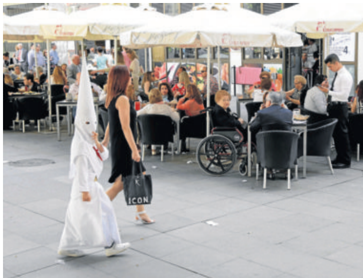
Un nazareno pasa por una zona de veladores abarrotada.

Pero el atractivo de la plaza es palpable más allá de los festejos, pues no hay más que dar un paseo por el entorno de la Maestranza cualquier día de la semana para darse cuenta de que el entorno es un atractivo también para el turista. ■