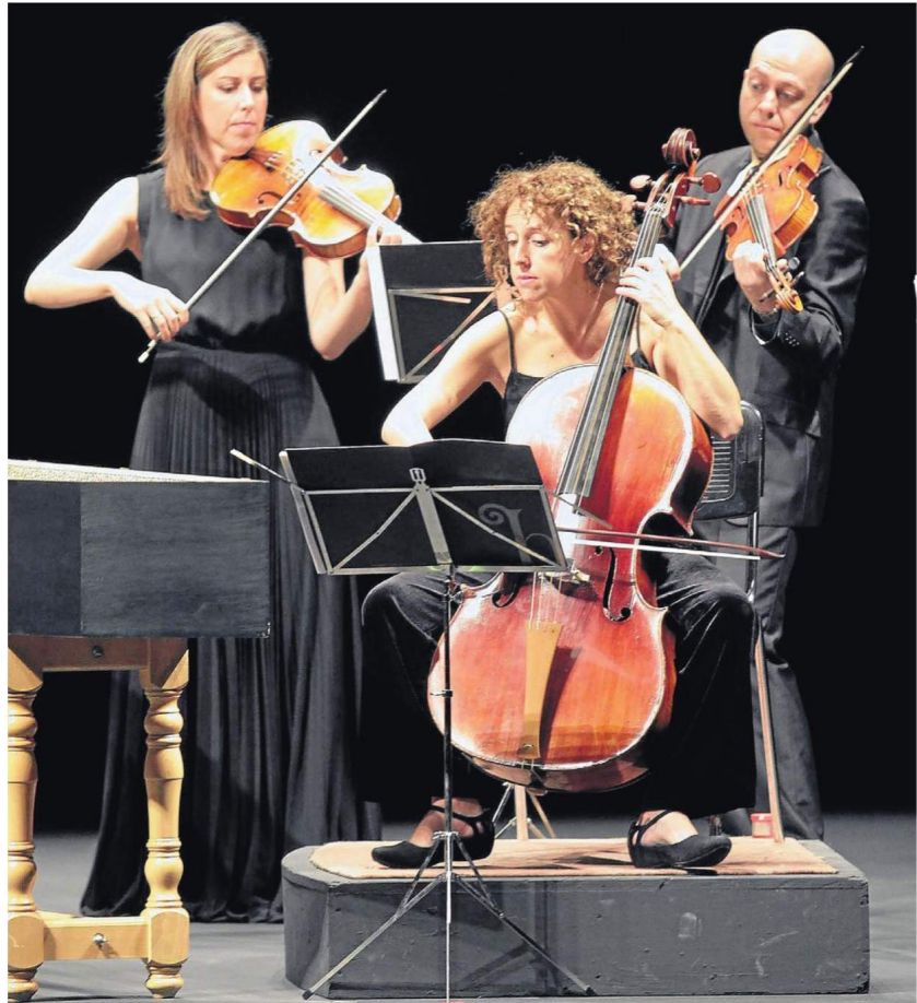
La Orquesta Barroca de Sevilla comenzará su temporada los días 11 y 12 de octubre en la Sala Turina.