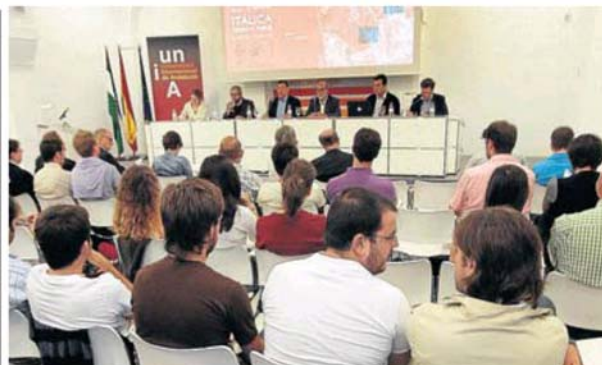
Asistentes a uno de los cursos de verano de la UNIA.

Desde entonces, una formación basada en la calidad y el rigor científico, con una temática actual, oportuna y variada, se refleja en los 73 cursos y encuentros y en la programación de 48 noches de cultura abierta en la UNIA, que se desarrollan en los cuatro campus de la Universidad, en Málaga, La Rábida (Huelva), Baeza (Jaén) y Sevilla, desde el 11 de julio hasta el 23 de septiembre de 2016. La poesía española en la era digital, la asistencia en crisis humanitarias, el feminismo, la jurisdicción europea, el rock español, la violencia escolar, el consumo consciente o los grandes vinos españoles figuran en el programa junto a otras muchas materias. Sus respon-