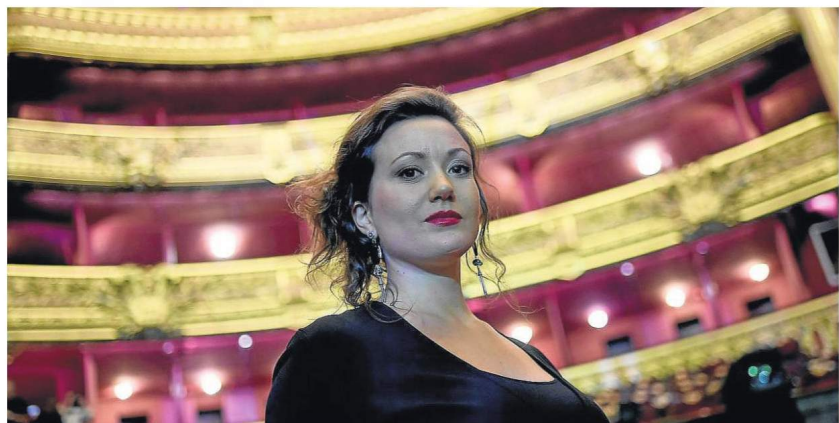
La soprano Julie Fuchs, que tiene un contrato con Deutsche Grammophon, debutará con la OBS.