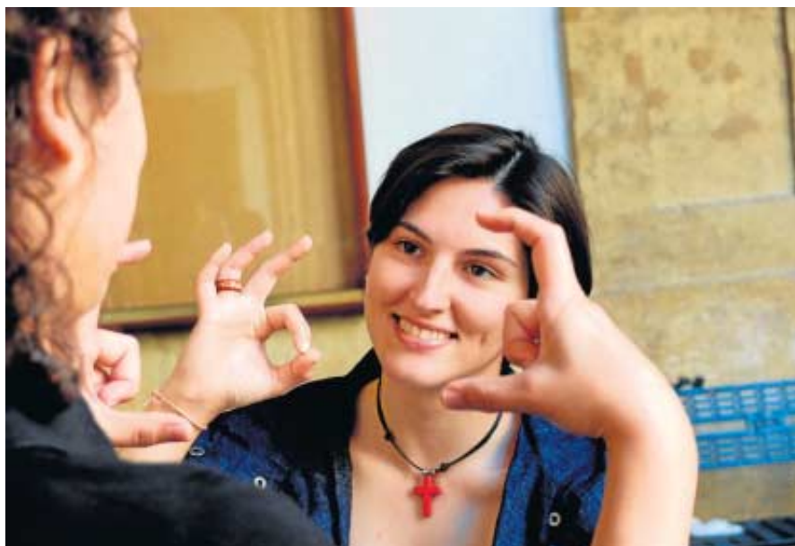
La US es la primera universidad que potencia y desarrolla esta medida en un formato accesible.

La iniciativa, que nace bajo el marco de la Ley 27/2007 de 23 de octubre, ha sido desarrollada por la Unidad de Atención a estudiantes con discapacidad, adscrita al Servicio de Asistencia a la Comunidad Universitaria (SACU), órgano que articula los recursos necesarios para que el alumnado con discapacidad cuente con las medidas y herramientas precisas en igualdad de oportunidades. La creación de un glosario con estas