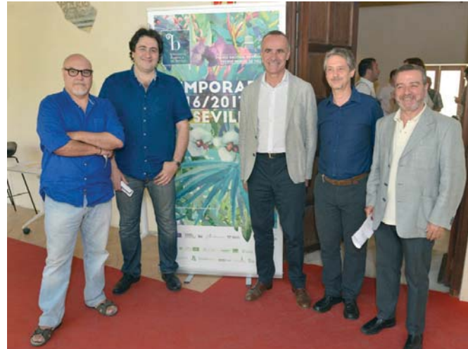
Un momento de la presentación de la próxima temporada de la Orquesta Barroca de Sevilla.