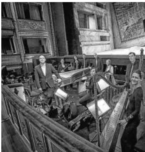
Capella Mediterranea, otro de los grupos que interpreta a Monteverdi.

► Las entradas para el festival, entre los 10 y los 40 euros, están a la venta a partir de las 11:00 de hoy en el Espacio Turina o en la web del Ayuntamiento ( www.sevilla.org )