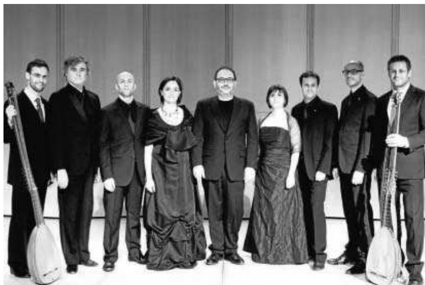
Concerto Italiano, la formación encargada de abrir el Femás el 17 de marzo en la Iglesia de la Magdalena.

parte de Collegium Vocale Gent y Philippe Herreweghe en la clausura, aseguró que el futuro pasa por "hacernos más grandes y mirar a Europa. En música antigua, de España se conoce a Jordi Savall y al Femás. Debemos potenciar eso".