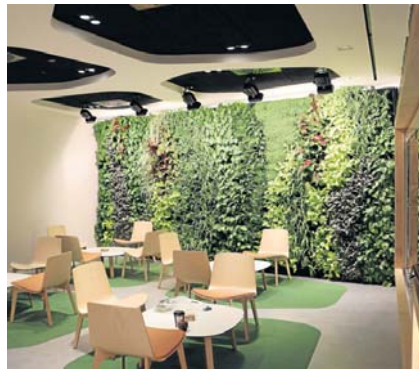
Arriba, cafetería de una clínica de Sanitas en Madrid y sede de DGNB de Stuttgart. A la derecha, interior de Park Stuttgart.

Formado por ingenieros agrónomos, arquitectos, diseñadores y doctores de la Universidad, expertos en fitotecnia, paisajismo sostenible, integración arquitectónica, riego e ingeniería hidráulica (el proyecto partió de una investigación de la Escuela Técnica Superior de Ingeniería Agrícola de Sevilla), el equipo ya cuenta con la experiencia de más de 4.000 metros cuadrados de jardines verticales y cubiertas verdes realizados. Algunos en el Reino Unido, Alemania, Austria, Suiza, Oriente Medio e incluso ahora tienen un proyecto en Grecia.