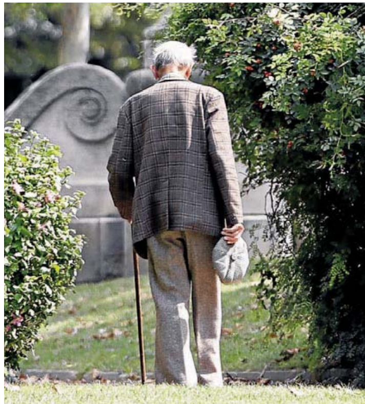
La mitad de los mayores de 65 años muestra síntomas de depresión. ■ E. C.

Más de la mitad de los ciudadanos que han superado los 65 años presentan síntomas asociados a la depresión. No todos la padecen. La media, según diferentes estudios, se sitúa en torno al 22% de la población que ha pasado ya la edad tradicional de la jubilación. El desafío terapéutico resulta, sin embargo, de bastante más envergadura porque un alto porcentaje de ellos (por encima del 50%) presenta síntomas que requieren atención especializada, «con más razón ahora, que se sabe que tratando la tristeza de los mayores podemos quizás evitar una demencia», apostilla Ángel Moríñigo, profesor de Psiquiatría de la Universidad de Sevilla, que hablará en el simposio de Bilbao sobre el impacto de las in-