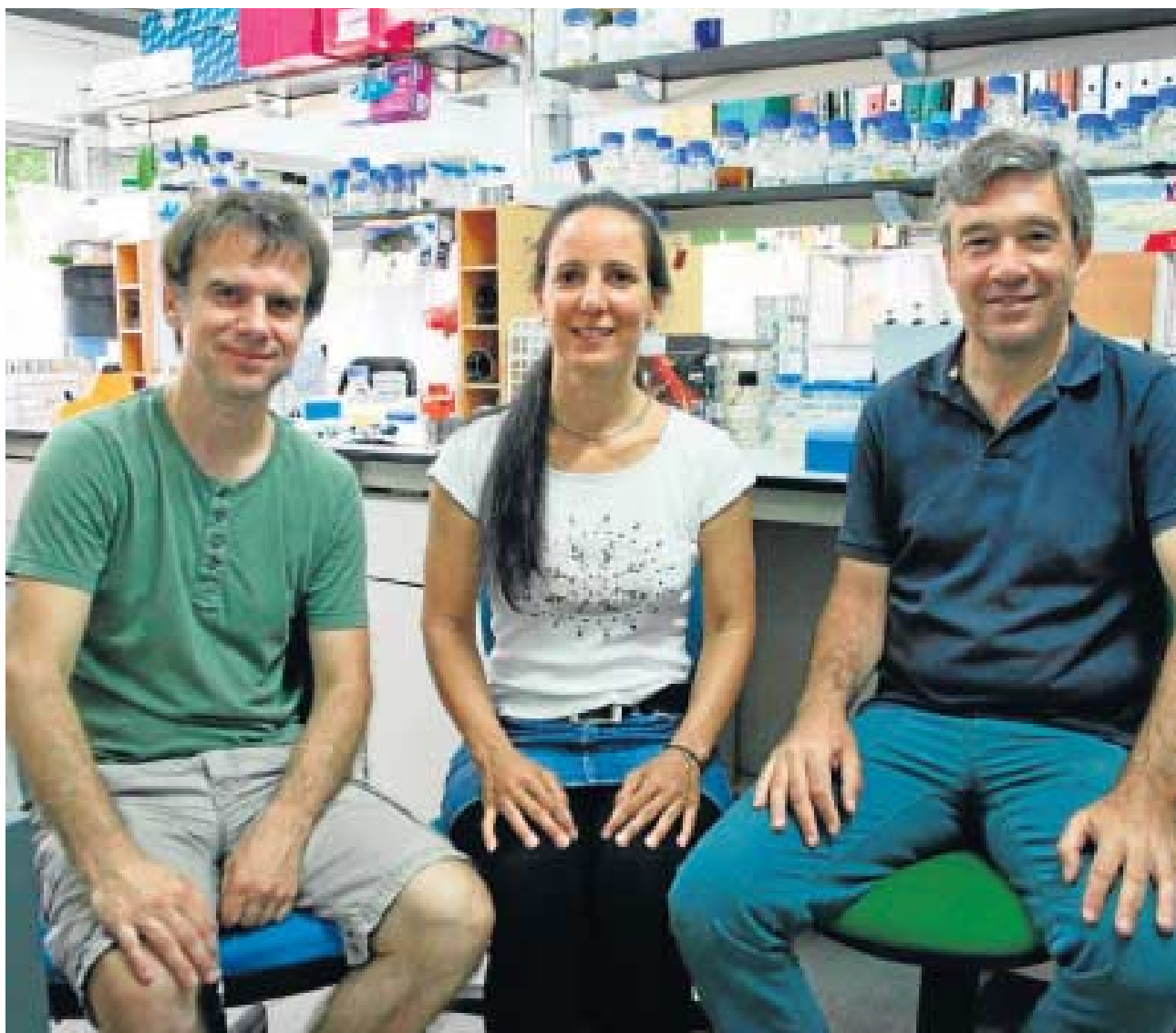
FIRMA DEL FOTÓGRAFO