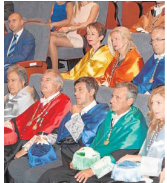
El acto se celebró en la Escuela de Ingenierías Industriales.