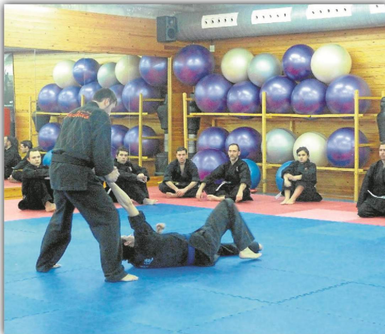
Las sesiones de hapkido se impartirán en el C.D.U. Los Bermejales. ED

personal puede practicarse los martes y jueves a las 21:00 horas, y a partir del próximo 3 de octubre se doblarán las clases y los abonados interesados podrán asistir también los lunes y miércoles a las 11:00 horas. Las sesiones serán de 90 minutos de duración y se impartirán en las instalaciones del Centro Deportivo Universitario Los Bermejales.