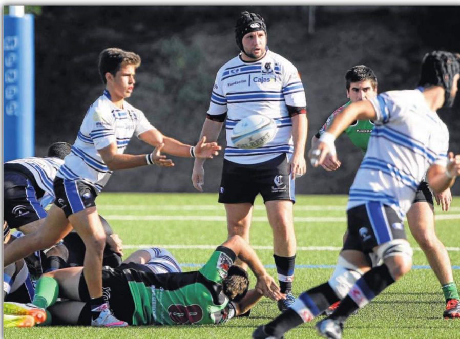
El Ciencias Fundación Cajasol amarró en las instalaciones de Los Bermejales su primer triunfo de este curso. Lince