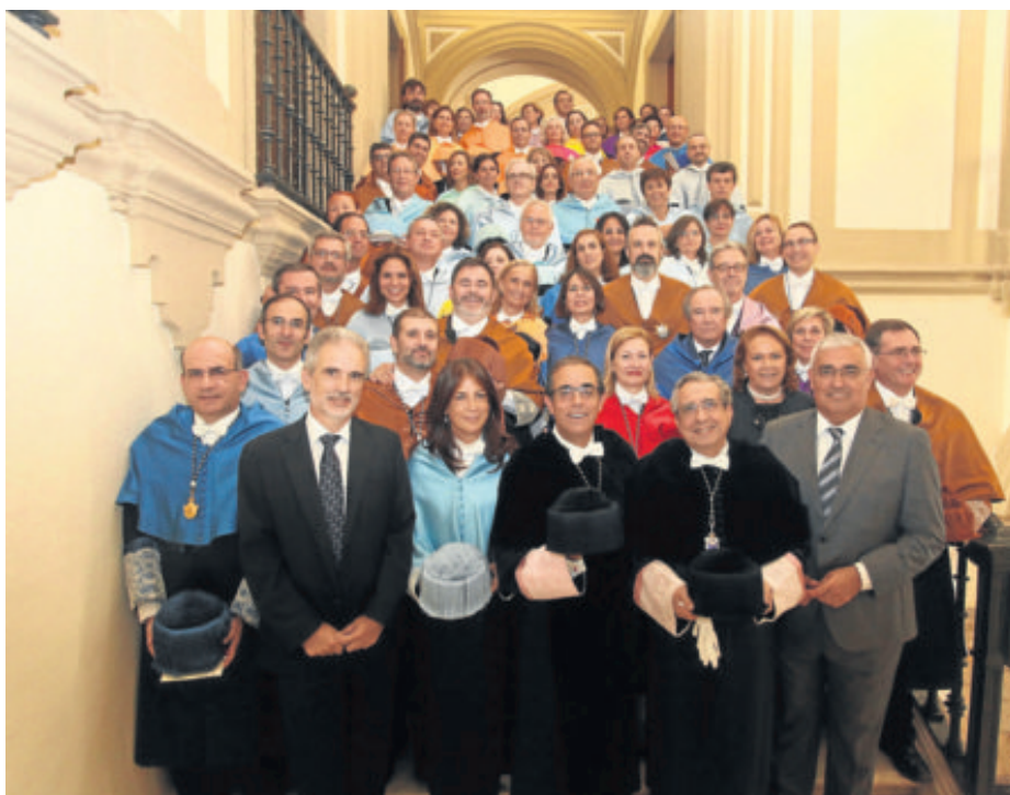
Foto de familia, con el rector de la Hispalense en el centro de la imagen.

El apartado de ordenación académica de la memoria explica que son 36