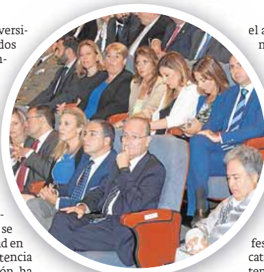
Autoridades asistentes al acto.