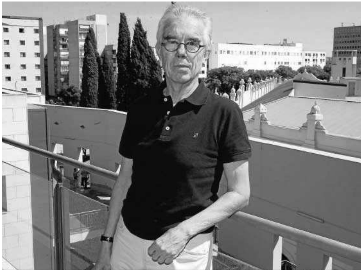
Fernando Pérez Royo en la Facultad de Derecho de la Universidad de Sevilla.

—Sí, los siete primeros años de mi vida los pasé en el cuartel de Caballería de Sagunto, que se encontraba en Bellavista, que en-