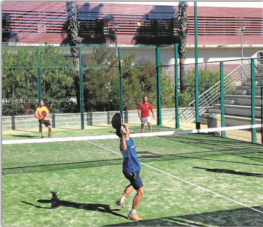
El primer cuatrimestre echa a rodar en las instalaciones del Servicio de Actividades Deportivas de la US. ED