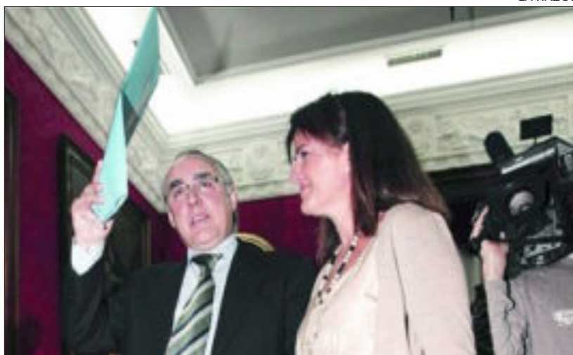
El ex presidente del Parlamento Javier Torres Vela

En total, acudirán al grupo de trabajo 67 comparecientes. La intención de los grupos políticos es que los trabajos estén finalizados en diciembre.