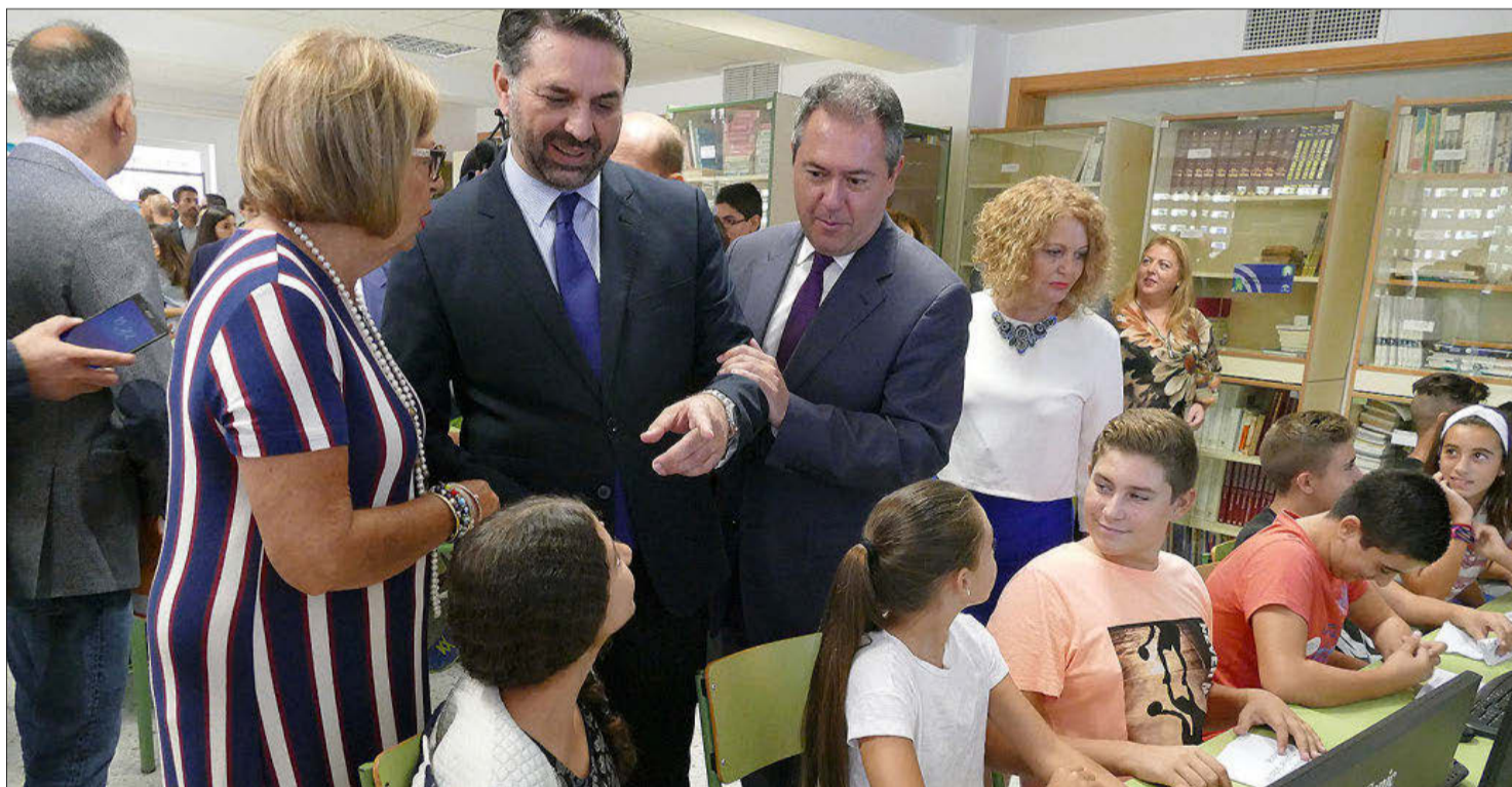
La consejera de Educación y el de Turismo, junto al alcalde de Sevilla, en una visita a la biblioteca 'multimediatca' del IES Torreblanca.

Fe de erratas. En una información publicada ayer se decía que el contrato de la Junta con la empresa Aora para la campaña de publicidad de la Autovía del Olivar era de 21,8 millones de euros, cuando debía decir 21.800 euros.