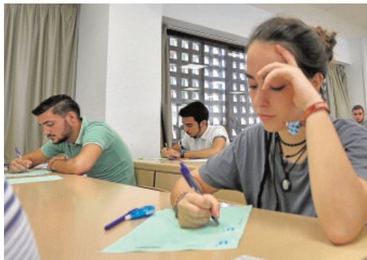
Estudiantes en el examen de Selectividad

El rector, por la continuidad El índice de aprobado ha ido creciendo cada vez más; el rector de la US cree un «dislate» su desaparición