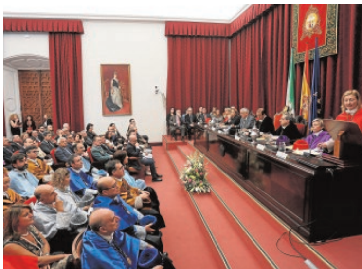
Acto de apertura del curso, ayer, en la Universidad de Sevilla

Castro también aprovechó su discurso para pedir ya la formación de Gobierno. Así, dijo que el bien común «reclama un acuerdo generoso y sensato entre los principales partidos políticos nacionales para facilitar ya un Gobierno estable en nuestro país» y que ese mismo bien común «exige un