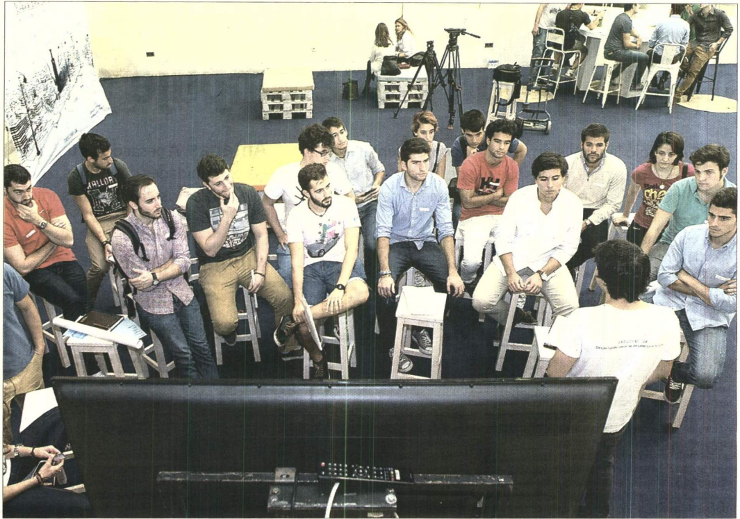
Un grupo de jóvenes participantes atiende ya el último espacio –llamado 'tools'– de la experiencia formativa.

Como ellos, más de 800 jóvenes de entre 15 y 26 años se han inscrito para participar en esta ruta emprendedora, que también estará hoy abierta al público hasta las 17.00 horas, y para la que en realidad tampoco hace falta un registro previo. Solo hace falta acercarse hasta la Cartuja y apuntarse. Cada media hora un grupo con una veintena de personas inicia este particular tour que comienza cómodamente recostado sobre un puf –es el llamado espacio reset –, en el que se hace una primera aproximación a qué le gustaría a cada uno cambiar o mejorar y una liberación de preocupaciones que se escenifica depositando las cargas en una urna. De ahí, se pasa al espacio de inspiración , un túnel con pantallas que proyectan testimonios de jóvenes sevillanos señalando qué les molesta o qué cambiarían: aquí hay reivindicaciones de aplicaciones culturales, pasando