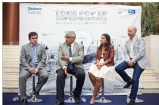
Presentación de 'Pop Up Emprendedores'

SEVILLA.-Por tercer año consecutivo, Fundación Telefónica sigue apostando por los jóvenes, su potencial de innovación y de convertirse en agentes de cambio social. Para ello, ha concebido el 'Tour Pop Up Emprendedores', una serie de eventos por siete ciudades españolas, que consiste en dos días de formación intensiva sobre las competencias necesarias para emprender.