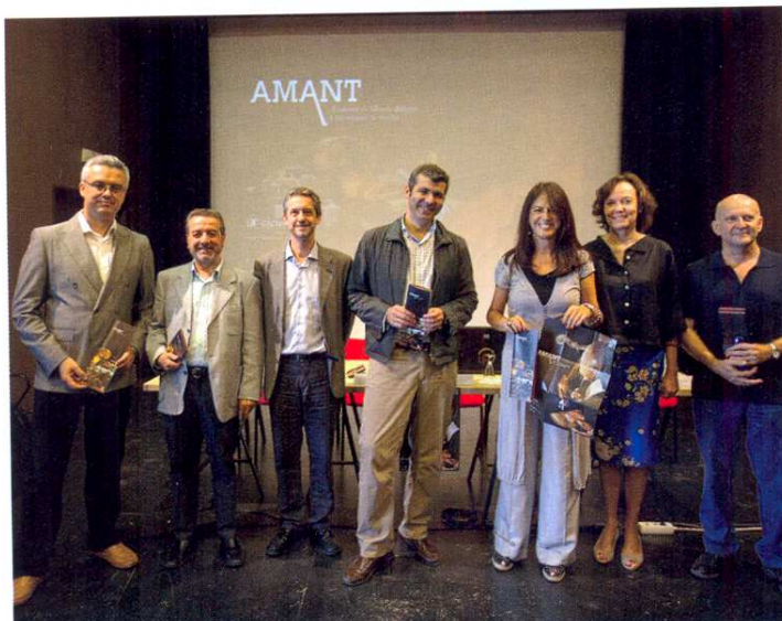
Acto de presentación de la Academia de Música Antigua, Amant.

El proyecto que ahora se inaugura parte de una clara vocación por aunar música y formación musical, gracias a iniciativas ya puestas en marcha en años anteriores: el curso Contextualización histórico-artística y apreciación de la Música , el compromiso de recuperación del patrimonio musical a través del Proyecto Atalaya, o la oferta de clases magistrales para posibilitar la especialización de los músicos en formación junto al Conservatorio Superior de Música de Sevilla, siempre con el apoyo de la Asociación de Amigos de la OBS, que ha sido capaz de crear un público fiel y competente para la escucha de las obras programadas.