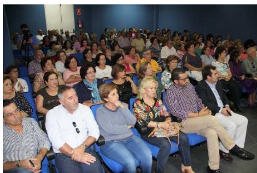
Acto de presentación del Aula de la Experiencia de mayores

LOS PALACIOS.-El himno universitario Gaudeamus Igitur, interpretado por los profesores de la Escuela Municipal de Música y Danza y el Coro "Lux Aeterna" abrió de manera solemne el curso académico del Aula de la Experiencia de la Universidad de Sevilla en su sede de Los Palacios y Villafranca, ayer tarde en el salón de plenos del Ayuntamiento.