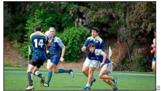
El rugby 7 cada día tiene más aceptación entre los usuarios.

durante el año) todos aquellos estudiantes de la Universidad de Sevilla que quieran confeccionar un equipo para poder jugar tienen hasta el jueves para reunir a los suyos e inscribirlos. Para ello, los delegados o capitanes de cada conjunto deben rellenar la inscripción a través de la Oficina Virtual en la página web www.sadus.us.es , o bien presentándose en la Oficina de Atención al Cliente para hacerlo de forma presencial en el CDU Los Bermejales.