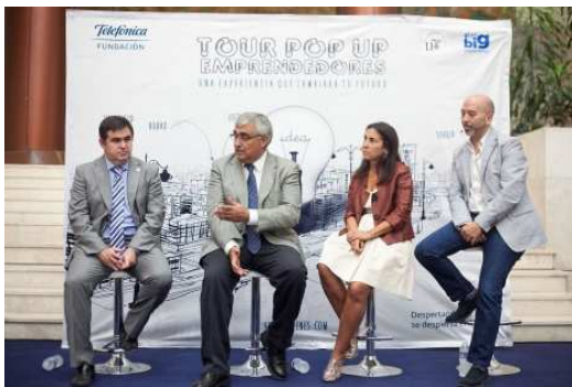
Presentación de 'Pop Up Emprendedores'

SEVILLA.-Por tercer año consecutivo, Fundación Telefónica sigue apostando por los jóvenes, su potencial de innovación y de convertirse en agentes de cambio social. Para ello, ha concebido el 'Tour Pop Up Emprendedores', una serie de eventos por siete ciudades españolas, que consiste en dos días de formación intensiva sobre las competencias necesarias para emprender.