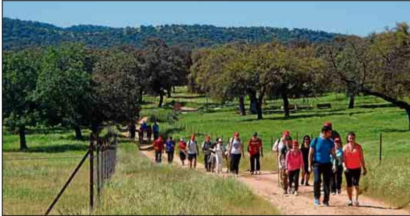
Los eventos al aire libre causan sensación cada curso entre los usuarios del Servicio de Actividades Deportivas.