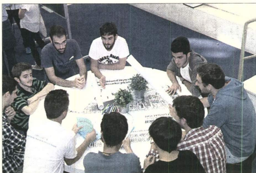
Una de las mesas del espacio 'coworking', donde se trabaja en equipo.

por la necesidad de mejora del transporte público y la conexión de algunos barrios «que no son la Torre del Oro ni la Giralda» o la reclamación de más zonas verdes y de esparcimiento para conciertos y menos dedicadas al turismo, la falta de oportunidades para jóvenes artistas o el poco uso de las energías renovables.