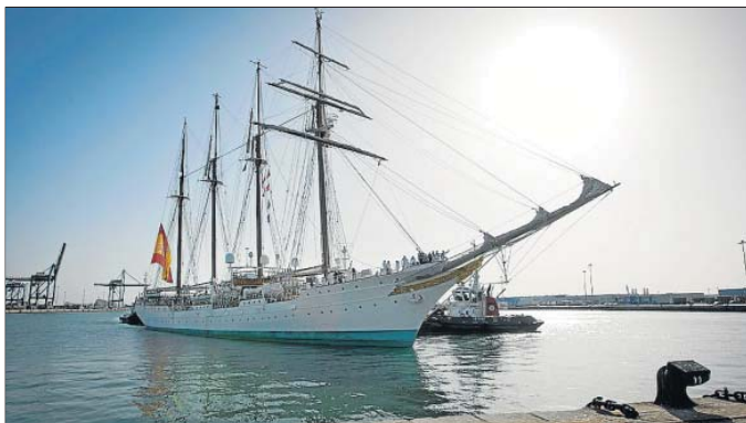
El velero atracó ayer en Cádiz después de seis meses navegando por alta mar.

Málaga a un hombre por atropellar a una mujer y a su hija. Se saltó un semáforo en rojo, las arrolló y luego se dio a la fuga.