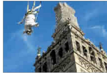
El Giraldo, ascendido el 22 de julio de 2005. J.M.

El director del Instituto de Patrimonio resta gravedad a la intervención. Asegura que la estatua presenta un buen estado general, y que, además de tratar el problema específico de la pieza oxidada, el Giraldo sólo necesita una limpieza general y renovar las capas de protección ambiental.