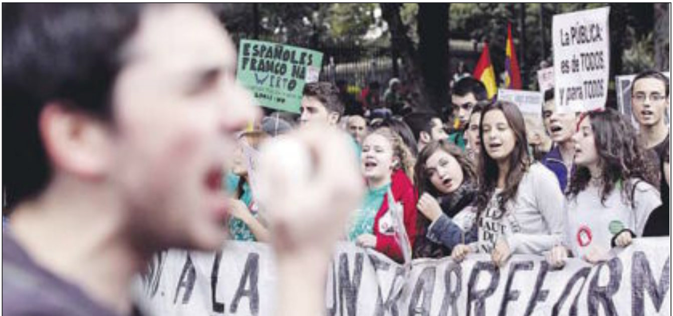
Estudiantes participan en la manifestación celebrada en Madrid contra la Ley Orgánica de Mejora de la Calidad Educativa (Lomce) y contra los recortes en educación en el curso pasado.

También el Colectivo de Estudiantes (Colest) de Cantabria se manifestó el pasado sábado en Santander contra las tasas universitarias. El acto fue el pistoletazo para #UnFuturoSinTasas, una campaña para reflexionar acerca del futuro de la Universidad. Esta manifestación forma parte de las Euro-marchas 2015, una serie de movilizaciones a nivel estatal y europeo.