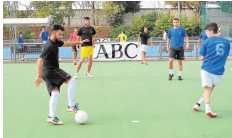
El fútbol sala es uno de los deportes con más adeptos

Todas las inscripciones deberán realizarlas los correspondientes capitanes o delegados de equipo de cada uno de los conjuntos que participen, a tra-