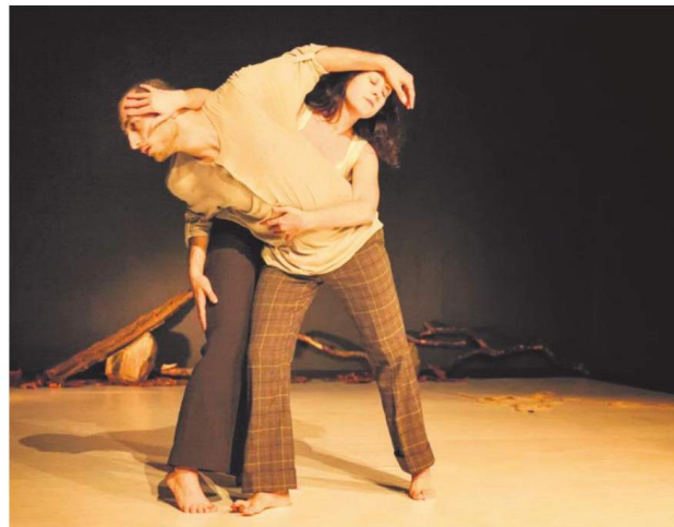
L'Animal a L'Esquena, primera compañía con carta blanca.

El caS (Centro de las Artes de Sevilla) será en esta edi-