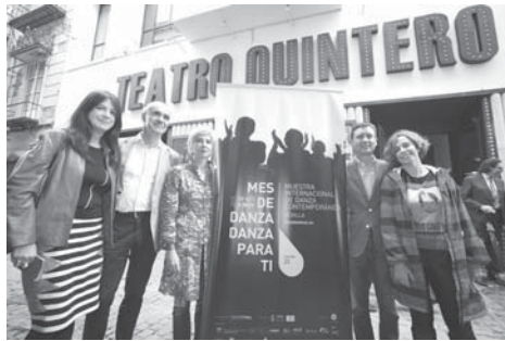
Presentación de la muestra internacional Mes de Danza. AVTQ.

Dentro de la profunda vinculación que Mes de Danza tiene con la ciudad de Sevilla, el festival cada año se plantea el reto de redescubrir nuevos espacios para la danza a través del ciclo Danza en Espacios Singulares. Así, este año se visitarán por primera vez el Monasterio de San Jerónimo, donde podrá verse un programa