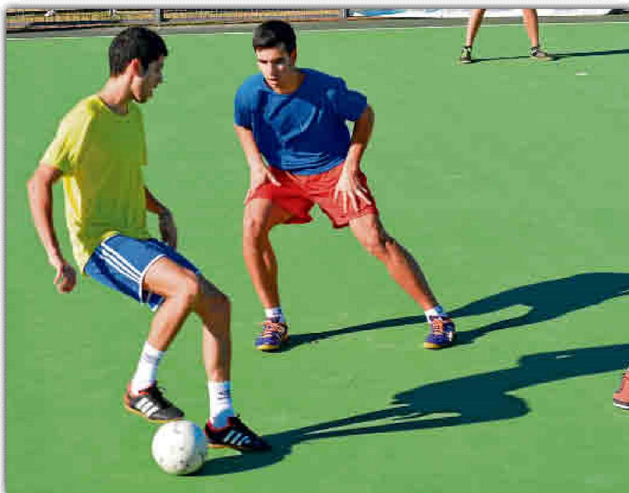
La competición interna de fútbol sala es una de las que mejor acogida tiene entre los universitarios.