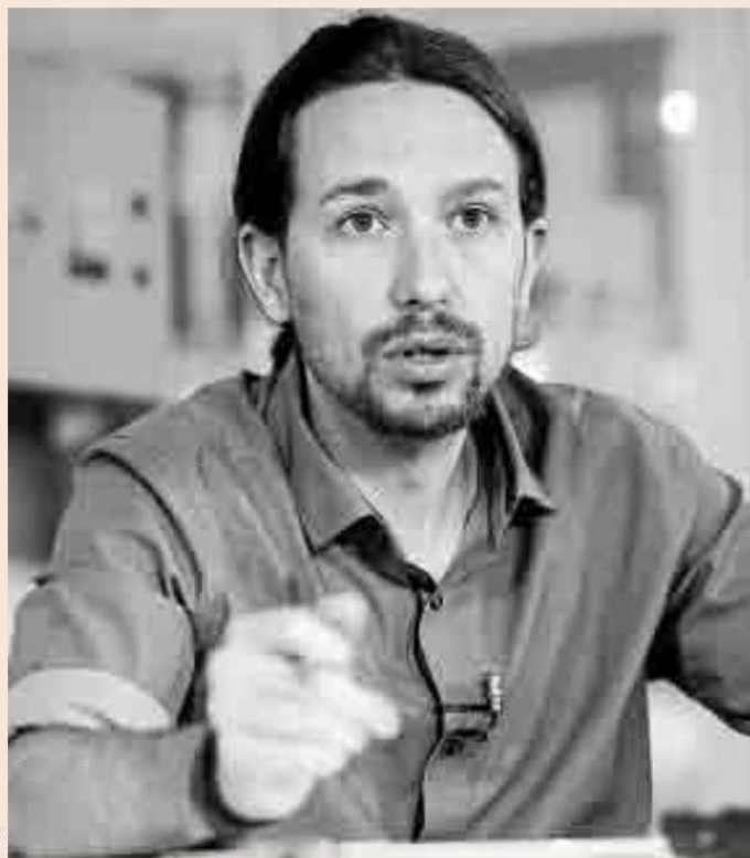
El secretario general de Podemos, Pablo Iglesias.

Así lo aseguró durante una entrevista en la Cadena Ser , donde avanzó algunos puntos del programa de Podemos para estas elecciones del 24M, aunque también quiso avanzar la posición inicial del partido en asuntos que deberán ser abordados a nivel estatal. Preguntado sobre el exceso de universidades públicas señaló “hay demasiadas” pero que, “en cualquier caso, es un debate que habrá que tener a nivel estatal”. “Lo fundamental es que haya suficientes plazas y suficientes ayudas, aumentar la calidad”, señaló, para añadir que no sabe si esta reforma tendría que pasar por “cerrar alguna” Universidad y que lo importante es que “todo el mundo pueda estudiar”. El líder de Podemos también se mostró a favor de reducir la