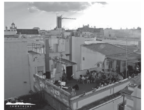
Azotea participante en una de las pasadas ediciones.

Nacido en Ceuta en 1948, aunque residente en el sevillano barrio de Triana desde muy temprana edad, Manuel Molina Jiménez era hijo del guitarrista 'El encajero', del que aprendió a tocar la guitarra. Estuvo involucrado en el mundo musical desde muy niño, formando parte a los 12 años, junto a Chiquetete y El Rubio, del trío Los Gitanillos del Tardón. Posteriormente formó el grupo Smash, grupo de rock progresivo de raíz flamenca que popularizó el conocido El Garrotín , y luego el dúo Lole y Manuel, que en 1975 sacó al mercado el disco Nuevo día .