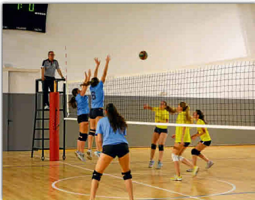
El voleibol, en su modalidad masculina y femenina, celebró ayer sus primeras finales del campeonato.