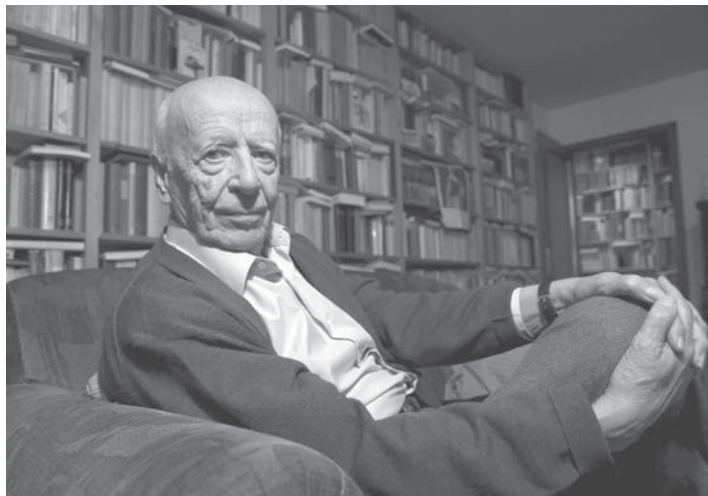
El sevillano Emilio Lledó ha sido galardonado con el Premio Princesa de Asturias de Comunicación.

Ganador de la última edición del Premio Nacional de las Letras, y antes del María Zambrano, el Antonio de Sancha y el Pedro Henríquez Ureña, su mayor satisfacción "es poder seguir trabajando y manteniendo los mismos ideales que tenía de jovencito", cuando se marchó a estudiar a Alemania.