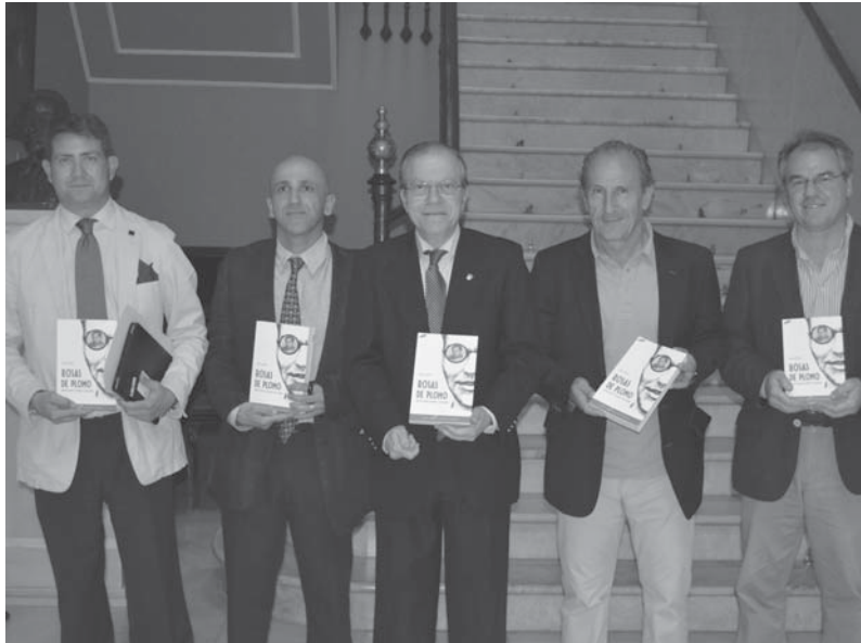
Imagen del día

Las organizaciones agrarias andaluzas han expresado su hondo malestar por la tardanza de la Consejería de Agricultura de la Junta a la hora de publicar en el Boja los requisitos para las ayudas de la Unión Europea.