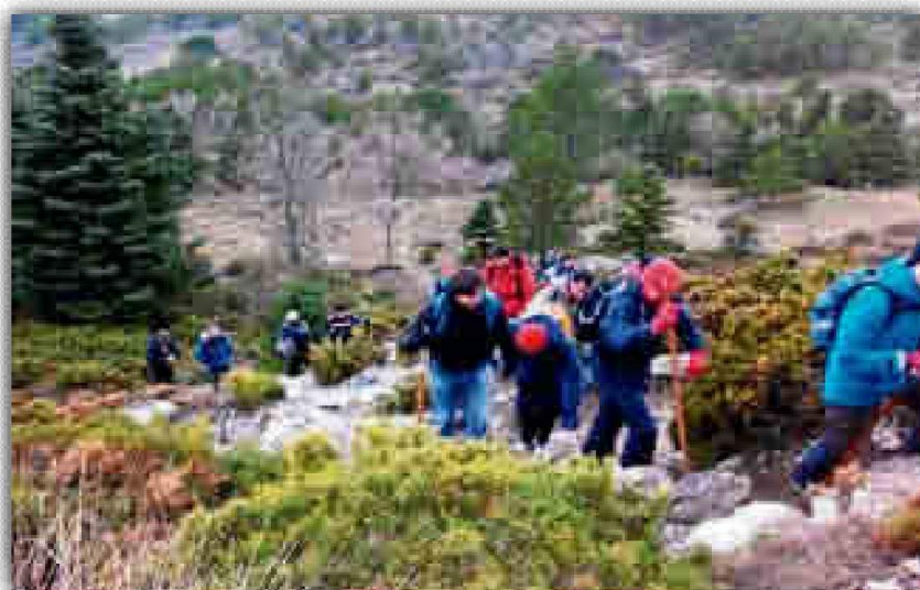
Esta será la penúltima salida senderista del SADUS.

Malo. El recorrido comenzará en el bonito pueblo de Cortelazor del Real, y de ahí subirán a lo alto del pueblo para contemplar unas vistas panorámicas espectaculares. Aunque, sin duda, el gran aliciente de esta ruta será poder ver el arroyo de la Guijarra, que desemboca en el Charco Malo, con una preciosa cascada alrededor de un bosque de galería. Para poder inscribirse a la ruta, se puede hacer a través de la Oficina Virtual, situada en la página web del centro, o bien de forma presencial en la Oficina de Atención al Cliente situada en el Complejo de Los Bermejales.