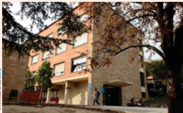
Facultad de Educación de la Universidad de Barcelona.