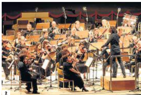
1. Actuación en la pasada edición del Día de la Música. 2. Miembros de la Real Orquesta Sinfónica de Sevilla actuarán en diferentes plazas del centro.

sumarse a la celebración del Día de la Música con un programa que incluye obras de Mendelssohn, Reinicke, Bizet y Smetana.