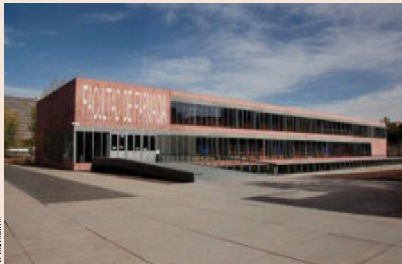
Farmacia va a pasar a formar parte de Medicina y Ciencias de la Salud.