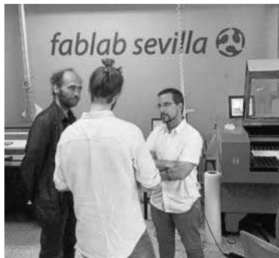
Pascual visita un laboratorio de prototipos de la Universidad de Sevilla.

Para sufragar ese incremento, Pascual detalló la apuesta de Unidos Podemos por "una reforma fiscal progresiva" que haga "que aquellas grandes empresas multinacionales que están tributando al 5%, que es la cuarta parte de lo que tributa un trabajador normal, tributen a la media europea que está en el 15%". Además, dejó claro que "no vamos a subir el IRPF a la gente que tenga salarios menores a 60.000 euros al año".