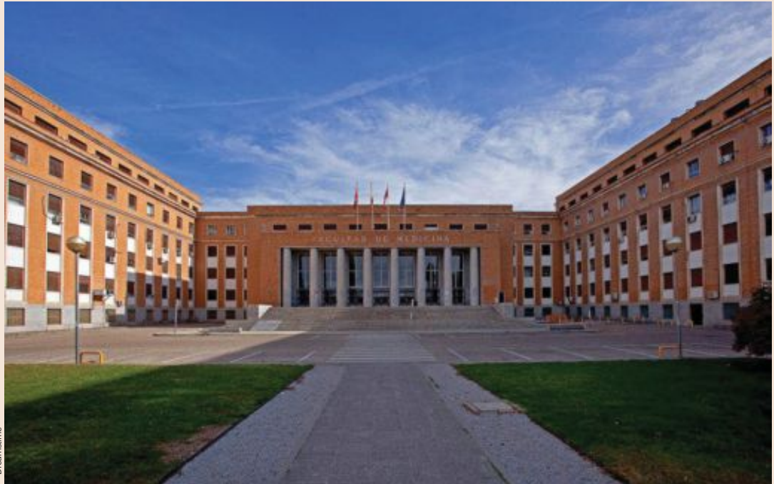
La Facultad de Medicina de la Universidad Complutense se va a fusionar con Enfermería, Odontología y Óptica.

El pasado mes de enero la Universidad del País Vasco estrenó su nueva organización con la fusión de las