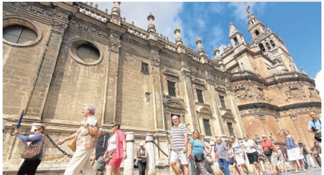
La cola de turistas para visitar la Catedral es una estampa habitual