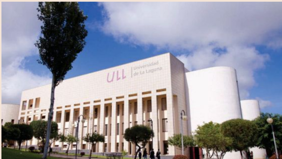
Vista de uno de los centros de la Universidad de La Laguna en Tenerife.

Por lo que se refiere a la eliminación del equipo directivo de una facultad o escuela para la fusión con otra, el ahorro se cifra en 36.799 euros anuales, que es el resultado de sumar los complementos económicos del director, secretario y vicedecano (12.530 euros) más 400 horas de descuento docente (24.268).