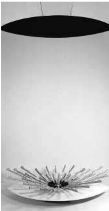
'Ogive Satie', una instalación de Pep Fajardo.