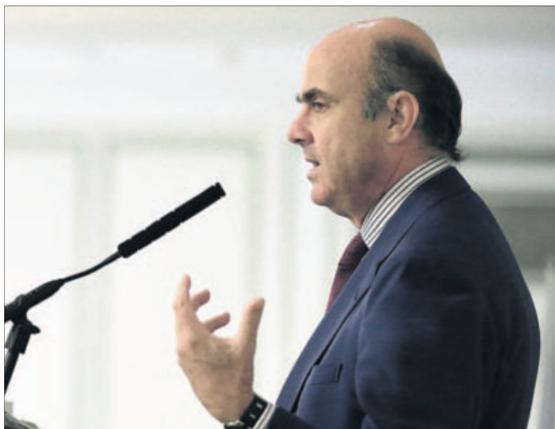
El ministro de Economía en funciones, Luis de Guindos, durante su intervención de ayer.

Seguidamente, entre las titulaciones con una empleabilidad media -con un porcentaje de titulados moderados y una demanda media por parte de las empresas- están las de Medicina o Farmacia y algunas ingenierías como Química, Naval o Civil. Es especialmente llamativo lo ocurrido con los titulados en Comercio y Marketing. El pasado año fueron la tercera titulación más demandada (por el 4,5% del total de las ofertas que