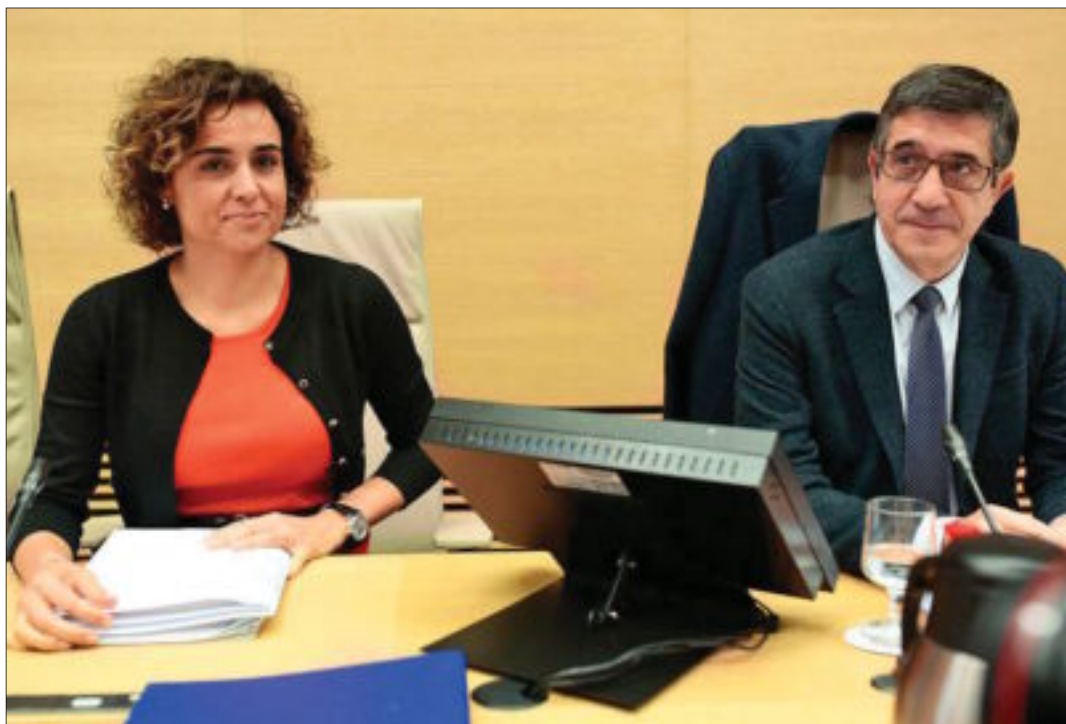
La ministra de Sanidad, Dolors Montserrat, ayer, en la Comisión de Sanidad del Congreso, junto a Patxi López.