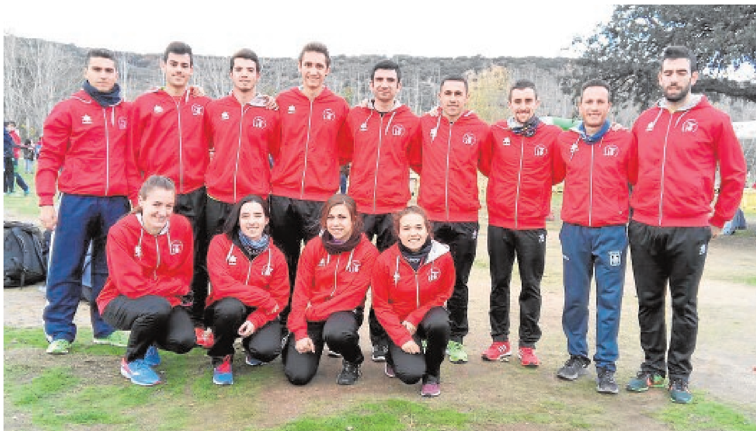
Miembros del equipo de la Universidad de Sevilla