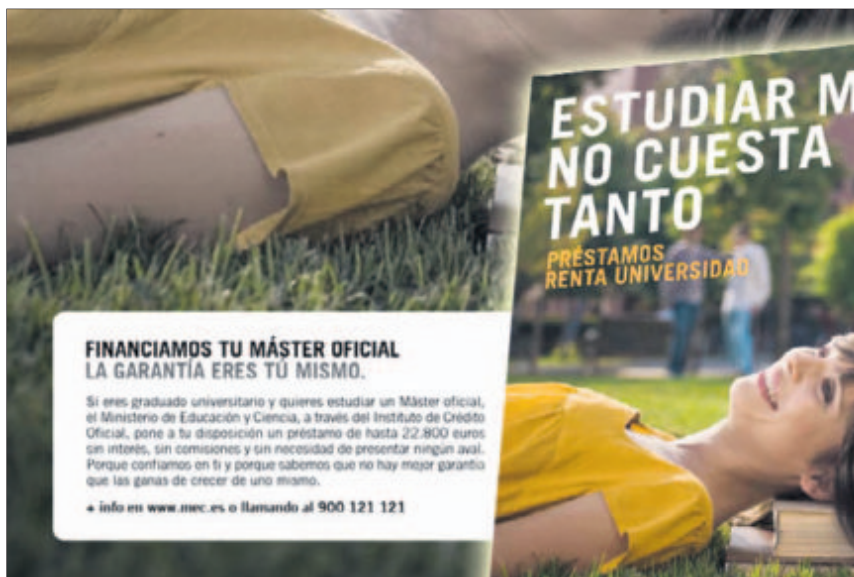
Uno de los carteles con los que el Ministerio de Educación promocionaba el programa.

La plataforma de afectados ha reclamado al Ministerio de Educación que se haga cargo de las deudas contraídas por jóvenes que no pueden devolverlas.