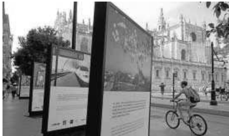
Las instantáneas se pueden ver hasta el 4 de octubre.

● Una muestra de 30 fotografías en la Avenida de la Constitución sirven de balance a las influencias en la ciudad de la Expo 92