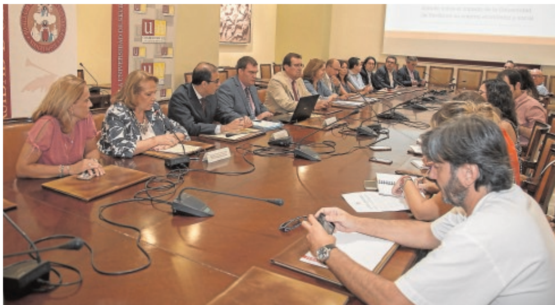
Los autores del informe presentan sus resultados junto al rector y la presidenta del Consejo Social

Los gastos vinculados a la celebración de congresos y jornadas de la US generan en torno a 24,31 millones. El estudio calcula que la media de asistencia por evento es de 189 personas.