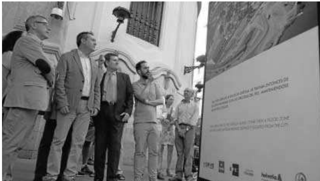
El alcalde, Juan Espadas, en el acto de presentación de la muestra.