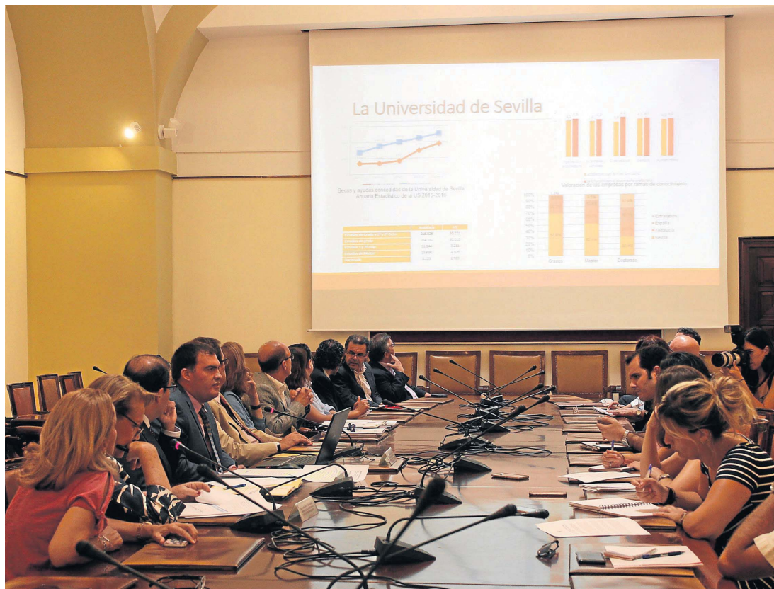
Momento de la presentación del estudio sobre el impacto de la Universidad de Sevilla en su entorno.