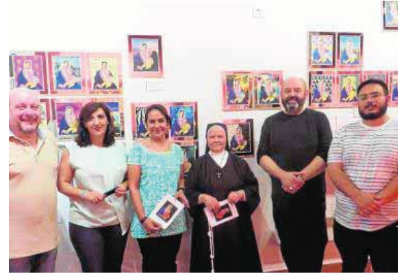
En artista baezano (segundo por la dcha.), en la exposición.

Respecto a la segunda actividad en la que ha participado el artista, se trataba de una nueva campaña, la séptima ya, de restauración organizada por el Monasterio de Santa María del Valle, el Excelentísimo Ayuntamiento de Zafra, la Dirección General de Patrimonio de la Junta de Extremadura, el Grupo de Investigación HUM 467: 'Materiales y Técnicas Artísticas' de la Universidad de Sevilla, así como la estrecha colaboración de la Asociación de Amigos del Patrimonio y del Museo de Zafra. Dicha campaña, dirigida por el baezano, cuenta con 14 graduados y licenciados en conservación, que este año han restaura-