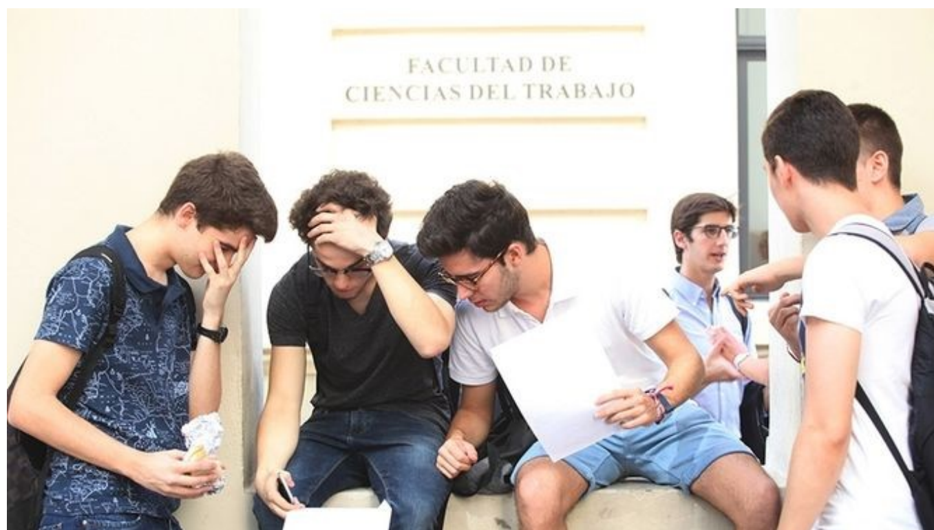
El doble grado en Física y Matemáticas, la titulación con nota de corte más alta