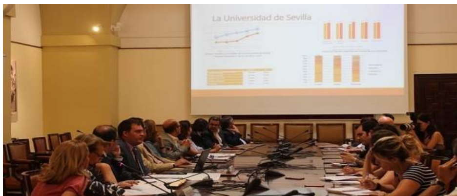
La US genera con su actividad 5,23 euros por cada euro que recibe