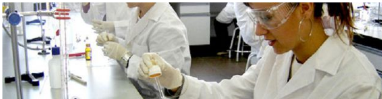
Universidad de Sevilla

El esfuerzo puesto en el ámbito docente se evalúa en la visión que las empresas tienen sobre la capacitación que obtienen sus alumnos. La US alcanzó valores de 4 sobre 5 tanto en satisfacción con la formación de los estudiantes como con el desempeño de estos en la actividad profesional.