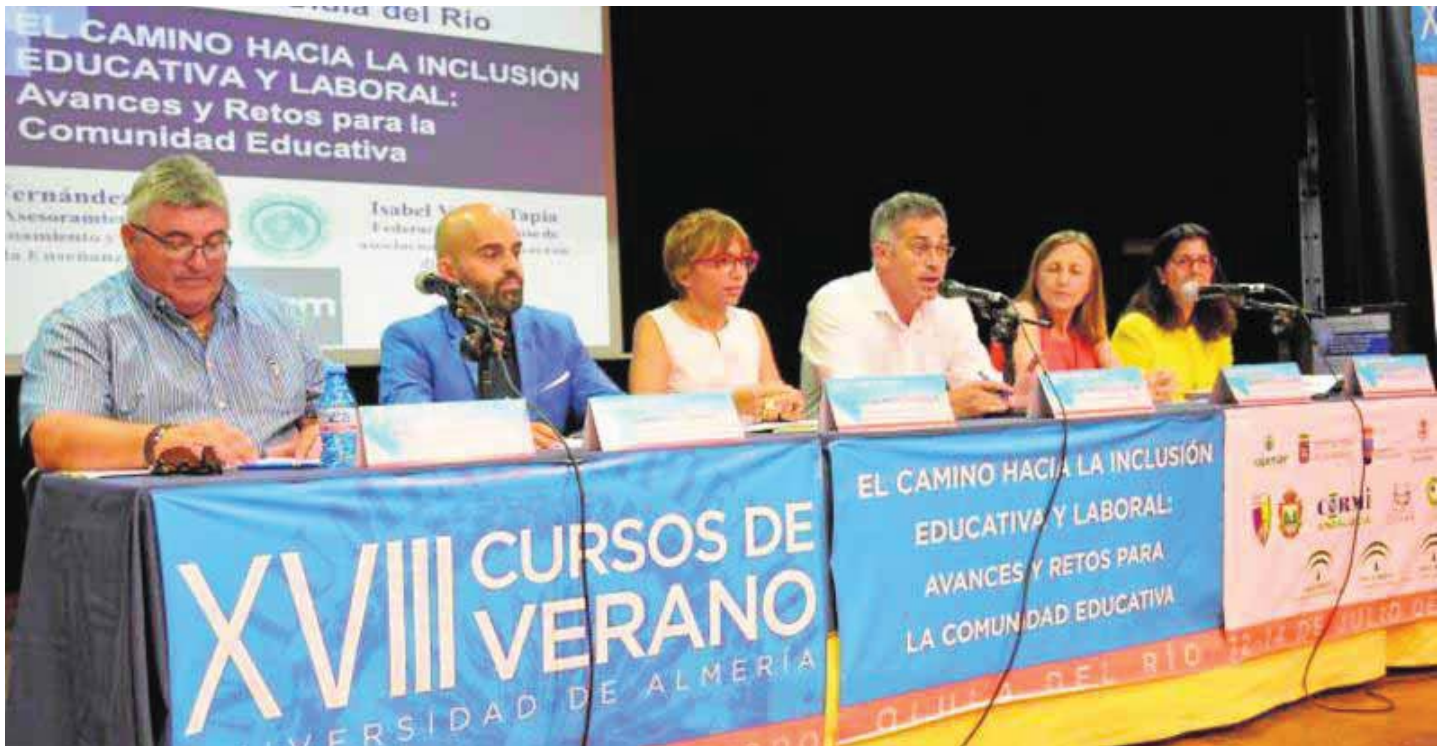
Fechas. El curso se celebró del 12 al 14 de julio en la localidad almeriense de Olula del Río. :: IDEAL