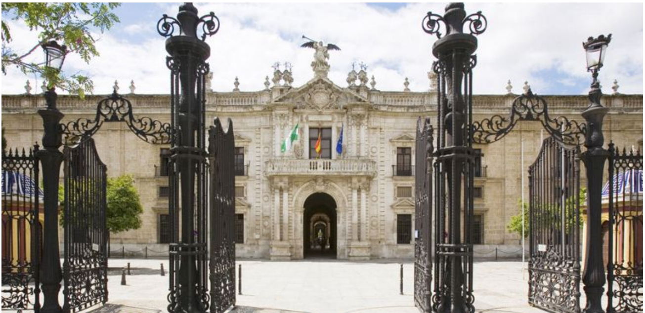
Universidad de Sevilla