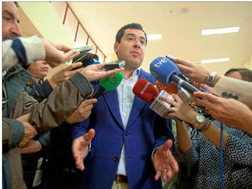
El presidente del Partido Popular andaluz, Juan Manuel Moreno, ayer en una comparecencia.