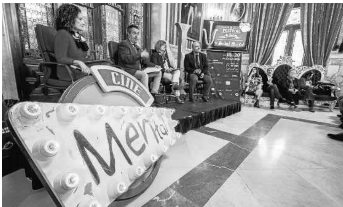
Presentación con las autoridades y los actores, ayer en el Salón Colón del Ayuntamiento.