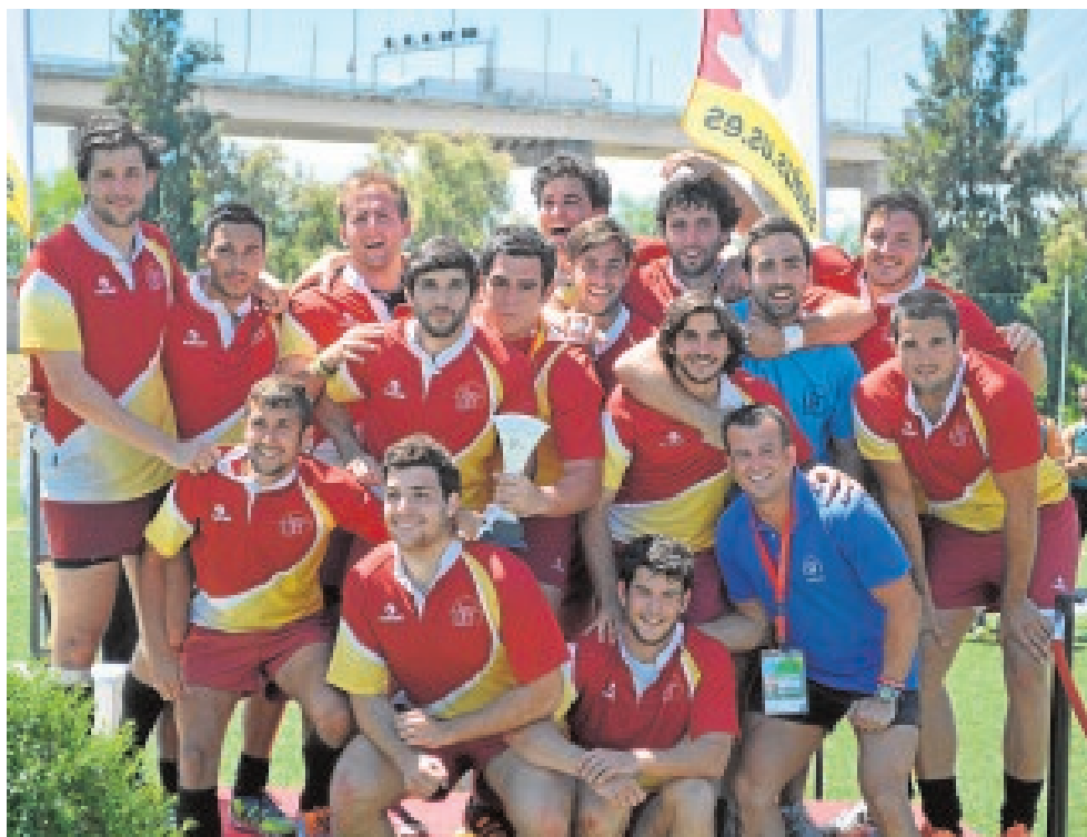
Miembros del equipo de rugby 7

Al campeonato acudirán un total de 25 universidades de todo el territorio español, entre las que se encuentran las actuales campeonas de baloncesto, la UCAM en categoría masculina y femenina, y la Universidad de Valencia en rugby 7, también de ambas modalidades. Los equipos masculinos de la Universi-