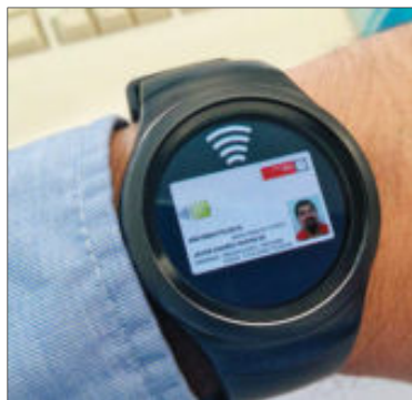
La TUI, en un reloj inteligente.

La UMU cuenta con el apoyo de Banco Santander para estas iniciativas. Ambas instituciones mantienen un marco de colaboración desde 1997. Fruto de esta relación, en diciembre de 2012, nació el Observatorio Internacional de la Tarjeta Universitaria Inteligente, con sede en el Área de