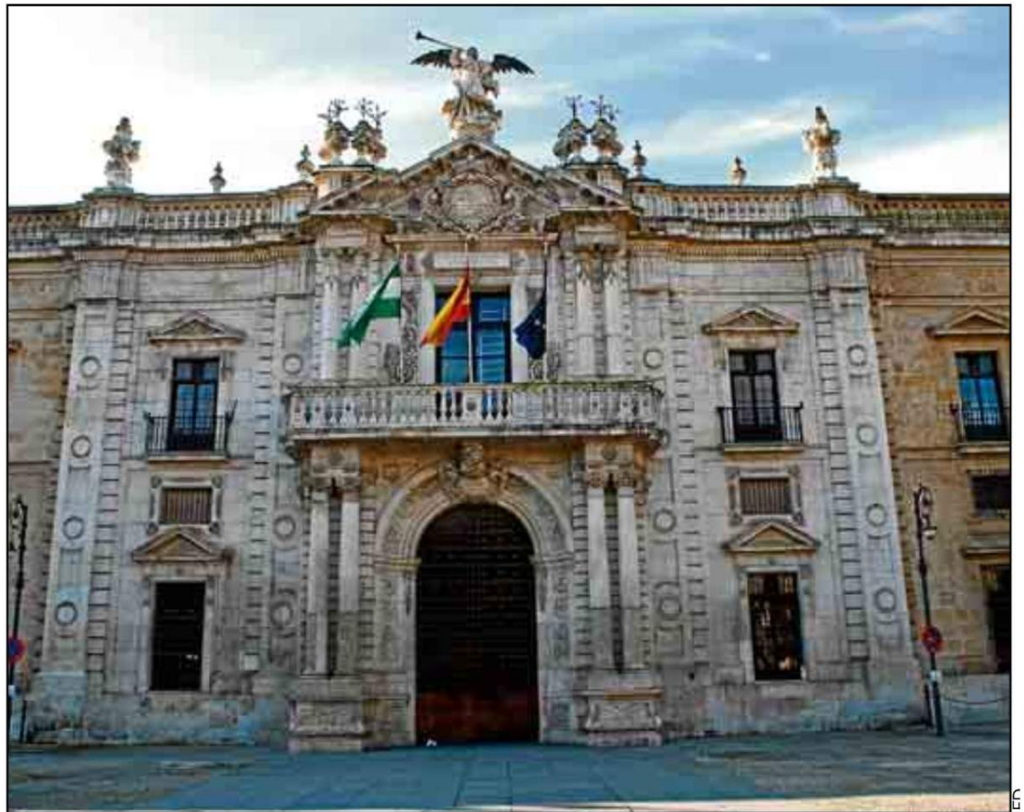
La US ha tenido este curso 2013-2014 un descenso de un 1% con respecto a los estudiantes inscritos.

El cierre del pasado curso académico de la Universidad de Sevilla se realizó con casi 60.000 estudiantes entre sus filas. En concreto, según la propia US, 59.841 estudiantes optaron por los centros propios y adscritos de la Hispalense, lo que supondría el descenso de un 1% con respecto al curso 2012/2013. La Universidad de Sevilla ofrece un total de 77 titulaciones, lo que supone un amplísimo abanico de posibilidades para los estudiantes. Sevilla es, por tanto, una de las ciudades universitarias de Andalucía por excelencia. Su amplia oferta en titulaciones, las múltiples opciones de ocio, la cantidad de estudiantes de distintos países que acoge cada año, el bienestar que proporciona su clima, su gastronomía y el carácter afable de sus gentes, así como la amplia oferta en alojamientos para estudiantes, hacen de Sevilla uno de los destinos preferidos por los estudiantes de nuevo ingreso. En este sentido, son muchos los estudiantes que se decantan por comenzar su andadura en optando por una residencia universitaria en Sevilla. Para su como-