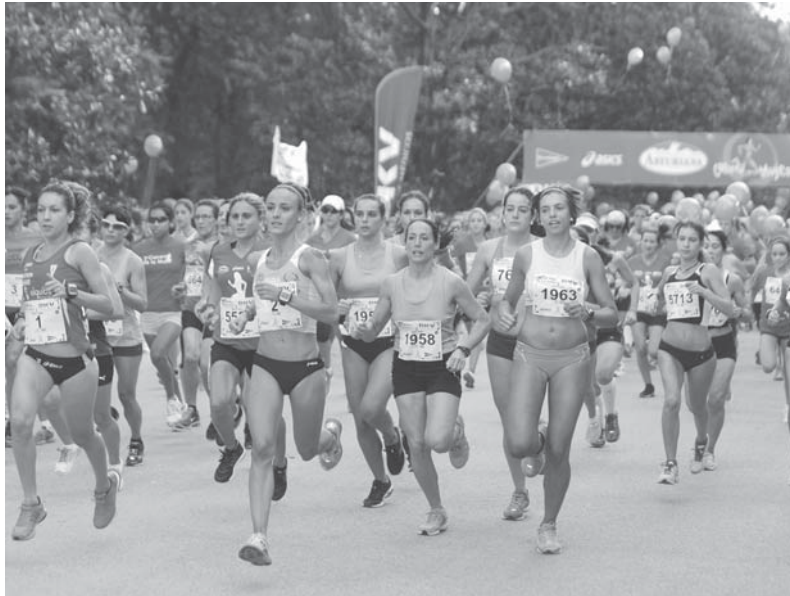
Imagen del día

La juez Mercedes Alaya ha ordenado el embargo de los 26.565 euros que en concepto de atrasos de la Junta debía cobrar Guerrero, al cual impuso una fianza civil de 686 millones de euros en el caso de los ERE.