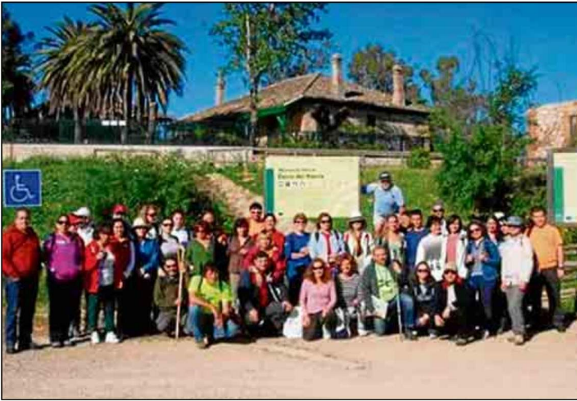
Los amantes del deporte al aire libre están de enhorabuena con la programación del SADUS.