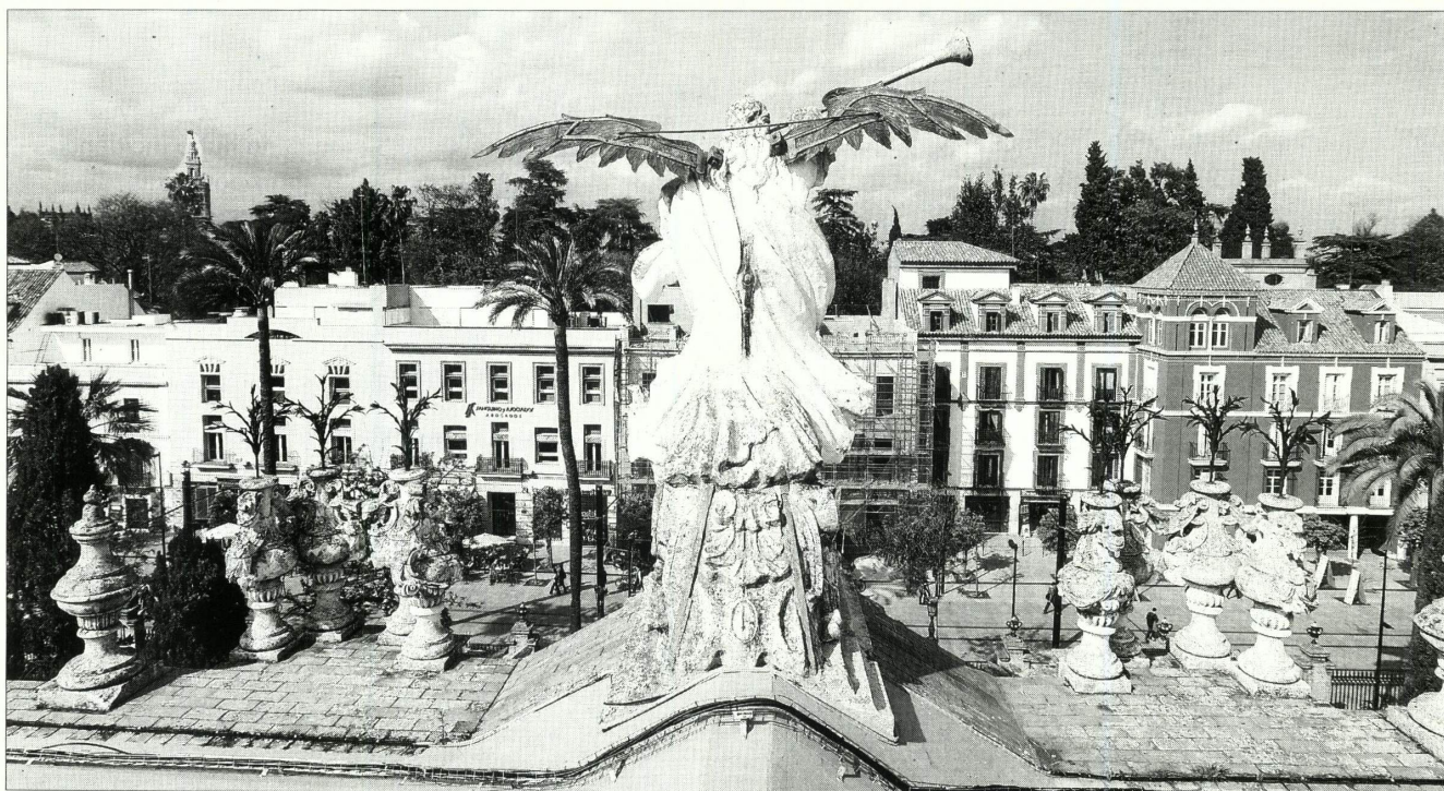
El edificio de la antigua Fábrica de Tabacos, en plena ruta turística de Sevilla, sería, según los socialistas, el mejor lugar posible para el museo.