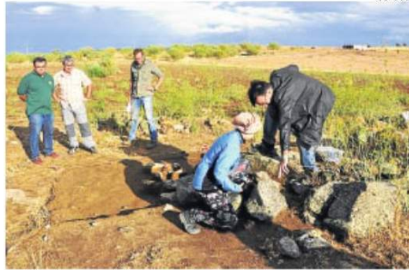
▶ Una imagen de las excavaciones en La Losilla.

Una vez delimitadas las zonas de cata y excavación, se ha comenzado esta semana con el descubrimiento de espacios en el entorno de la iglesia o núcleo central del yacimiento, que tendría en torno a unas tres hectáreas de extensión según los