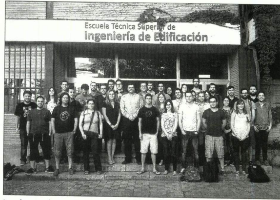
Los alumnos de Ingeniería que se han embarcado en la reforma de la iglesia.