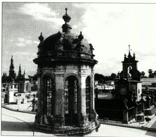
La azotea del edificio posee una indiscutible belleza.

«La oferta cultural, el producto tenemos que revisarlo. El análisis se llama Universidad de Sevilla, Rectorado... antigua Fábrica de Tabacos. Lo que me dice a mí la gente que sabe de museos y que me ha hecho informes sobre el Louvre y sobre cuál debería ser de verdad la apuesta museística de Sevilla, es que nos pensemos muy bien si la mejor opción sigue siendo mantener tal y como están el Arqueológico (donde se le ha ido al Gobierno de España todo el mandato sin invertir un euro y es de vergüenza con todos los informes que tienen desde hace tres o