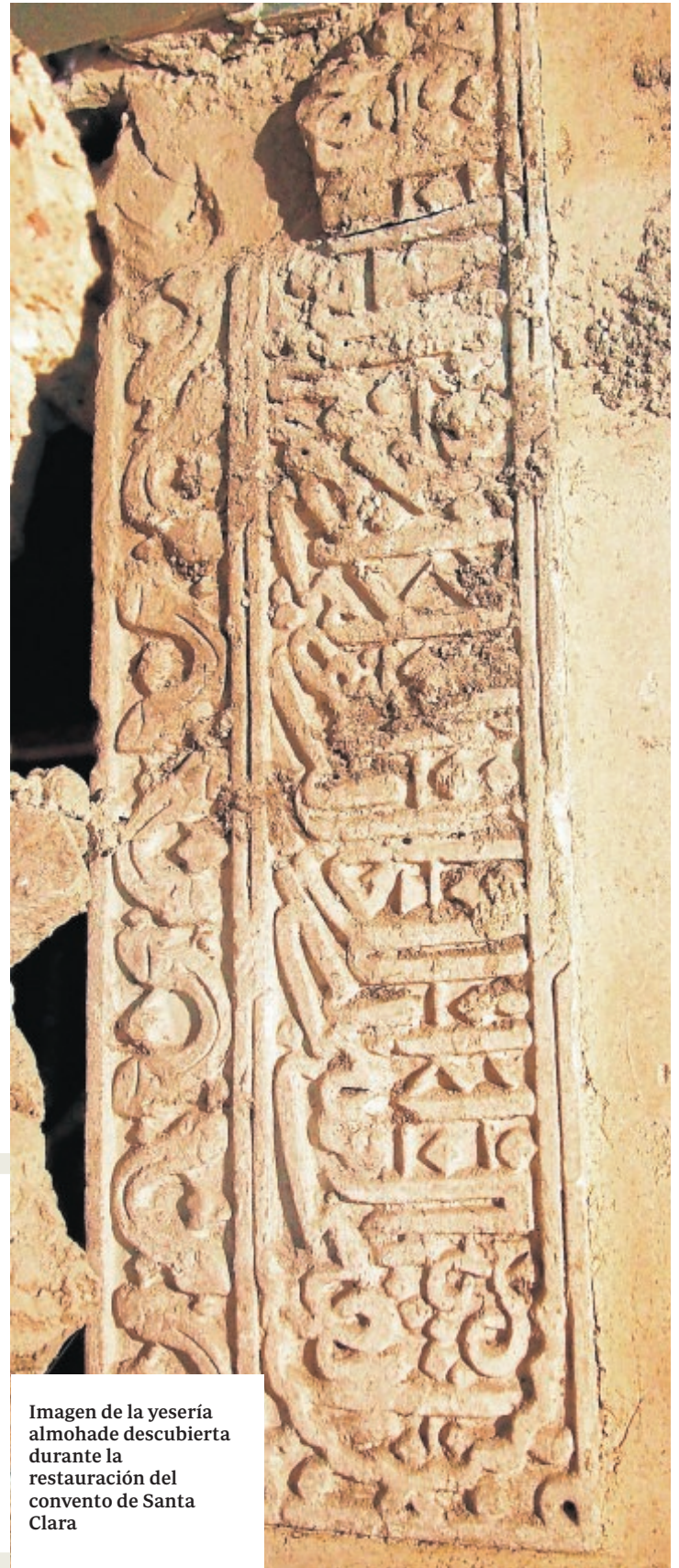
Imagen de la yisería almohade descubierta durante la restauración del convento de Santa Clara

época almohade con formas empleadas en momentos posteriores, en labor realizada mediante estampillado o al menos no preparada en el lugar de colocación». La inscripción dice, literalmente, lo siguiente: «¡Confianza mía! ¡Esperanza mía! ¡Tú eres mi anhelo! ¡Tu eres mi protector! ¡Sella con el bien mi obra».