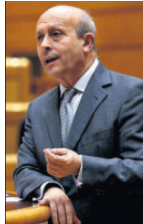
José Ignacio Wert.

de las enseñanzas durante los últimos años no parece beneficiar a la consecución de una educación de calidad en España", prosigue el dictamen. Para el órgano consultivo, resultaría "muy deseable que se tratara de alcanzar un acuerdo de las fuerzas políticas y sociales a fin de buscar un texto que pueda dar mayor estabilidad al sistema". El real decreto fue revisado en la Conferencia Sectorial de política universitaria, en la que participan todas las autonomías con el ministerio. Se mostraron conformes "con carácter general", señala el documento. Murcia y Madrid, gobernadas por el PP, alertaron de que la convivencia de los dos modelos "va a generar problemas e incertidumbres de cara a la internacionalización de las universidades". También incluye objeciones de rectores y colegios profesionales sobre