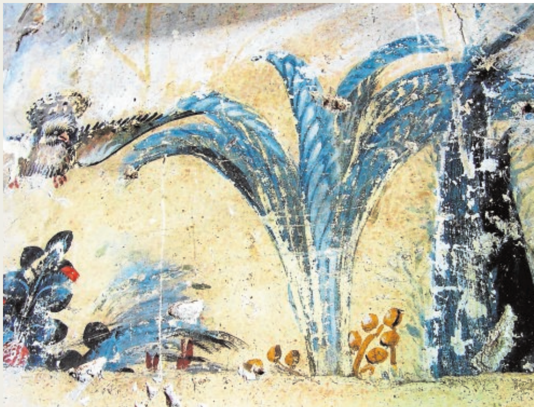
Uno de los frescos de estética orientalizante hallados en el Refectorio Alto de Santa Clara

Aquí ya hay otra conclusión contundente: no sólo es almohade, sino que se trata de un «palacio principal». «Aunque se ha dudado sobre el verdadero carácter islámico del palacio aparecido —continúa el profesor—, el análisis de sus yeserías no deja lugar a dudas tras compararlas con aquellas almohades de al-Andalus y del norte de África (Onda, Cieza, Murcia, Silves, Tinmal, etc.)». Para terminar, Ruiz Sousa concluye con seguridad: «No era lógico pensar que zócalos pintados de la riqueza y elegancia que presentan el que apareció bajo la mezquita aljama hispalense o el conservado en el salón meridional del Patio del Yeso del Alcázar de Sevilla, inexistentes de similar factura en construcciones cristianas, no se vieran acompañados de ricos conjuntos de yeserías decorativas como los que ahora han aparecido en Santa Clara. Yeserías que sin duda exornarían los palacios más importantes de la capital almohade». Es más, «su análisis formal nos vuelve a llevar al segundo cuarto del siglo XIII y al