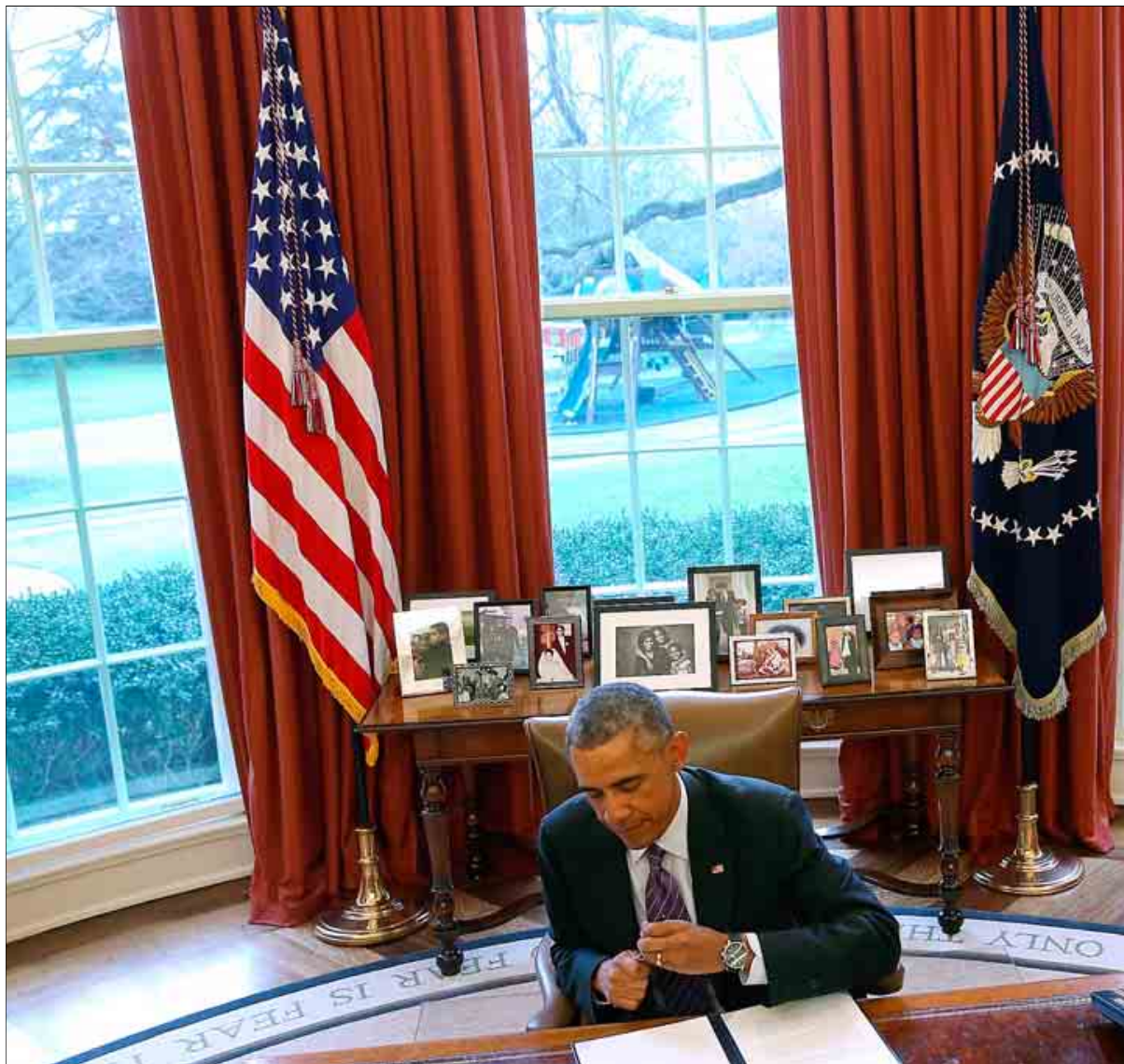
El presidente Barack Obama firma un memorándum en el Despacho Oval.

Finalmente, la Casa Blanca quiere otro impuesto, con un tipo del 0,07% la deuda de unas 100 grandes instituciones financieras que tienen activos superiores a 43.000 millones de euros. La propuesta llega un día después de que Jamie Dimon, el presidente del mayor banco del mundo, JP Morgan, afirmase que el Gobierno de EEUU está poniendo excesiva presión en las grandes instituciones financieras. «¿Queréis que el próximo JP Morgan sea chino?», dijo Dimon en la presentación de los resultados del banco en el cuarto trimestre de 2015, en el que ganó 4.265 millones de euros.