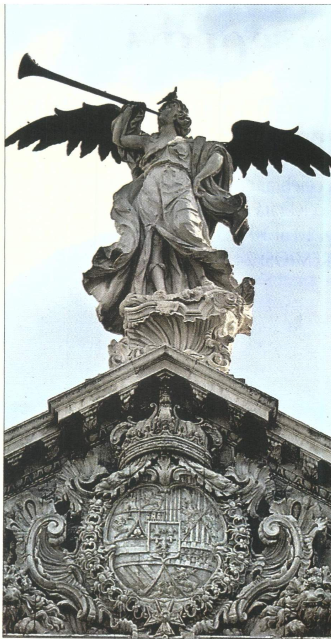
Escultura de la Fama que remata el edificio del Rectorado.

Además, la mejor posición aún ocupa la Hispalense en los últimos resultados del ranking internacional University Ranking by Academic Performance (URAP), ocupando el puesto 369 entre los más de 2.000 centros de educación superior que conforman este ranking.