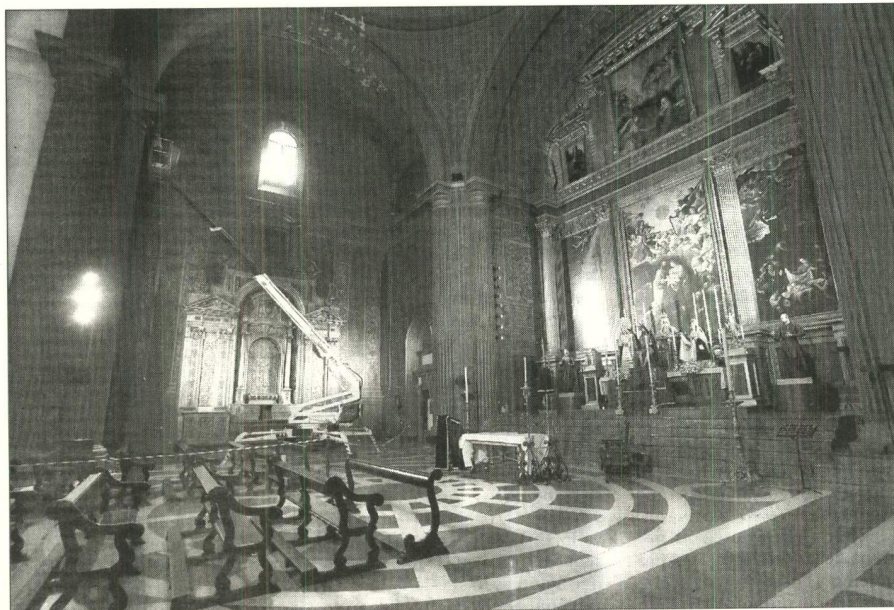
La Virgen del Valle, el Cristo de la Coronación y la Mujer Verónica presiden provisionalmente el altar mayor.

Debido al desarrollo de estas labores, las imágenes titulares de la Archicofradía del Valle presiden durante unos días de manera provisional el altar mayor de la iglesia de la Anunciación, templo edificado entre 1565 y 1579 por Hernán Ruiz II como iglesia de la Casa Profesa de la Compañía de Jesús.