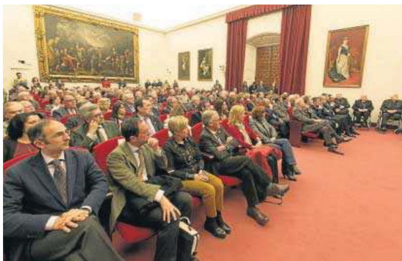
El Paraninfo se llenó de gente. Al fondo, en sillas de ruedas, los obispos eméritos de Mérida-Badajoz y Huelva.

El autor de la biografía ha investigado en 29 archivos públicos y privados, ha seguido la huer-