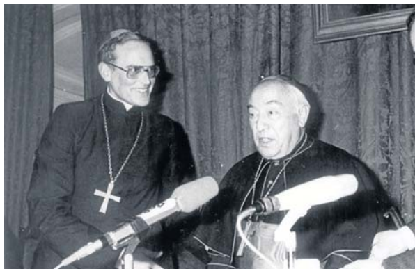
El cardenal Bueno Monreal junto al entonces arzobispo Carlos Amigo.