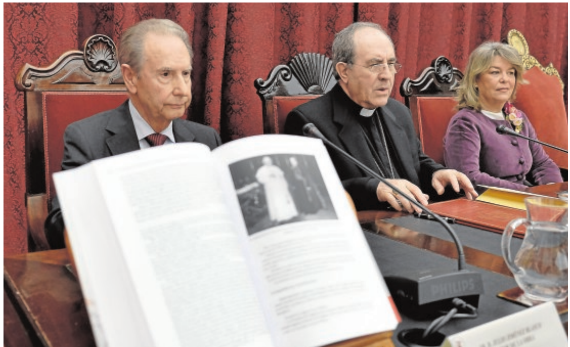
Un momento de la presentación en el Paraninfo de la Universidad de Sevilla

El autor ha querido retratar «a un obispo modélico que cumplió el mandato que tenía encomendado: enseñar, santificar y ser pastor de su grey. Parece bastante ser un hombre bueno, magnánimo, coherente, pobre, servicial, ambicioso de la realización efectiva de la justicia social que beneficiara y sirviera a toda la comunidad. Se mostró como un verdadero humanista cristiano de nuestro tiempo».