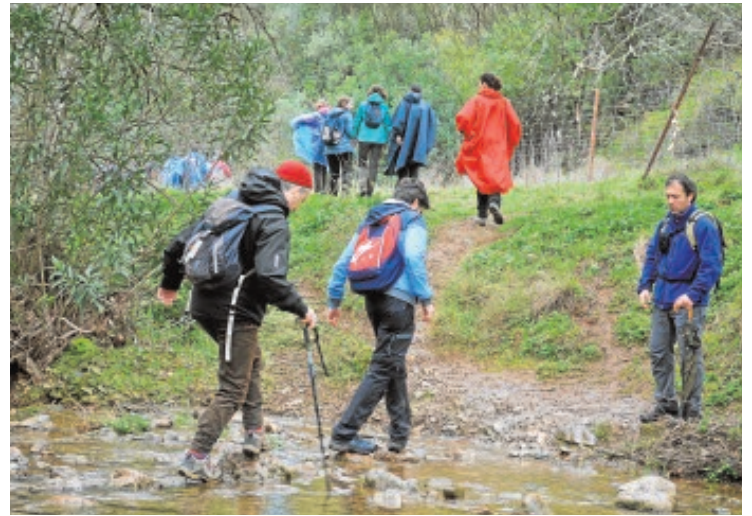
Un grupo de personas realiza una actividad en el medio natural

Por su parte, ya se han agotado las plazas para el senderismo por el río Odiel y la ruta fluvial Bocaleones, aunque las personas interesadas pueden apuntarse a la lista de espera que se ha establecido para dichas actividades. Como viene siendo habitual, el precio varía según el colectivo al que pertenezca, teniendo los abonados un 20 por ciento de descuento sobre la tarifa fijada (Comunidad Universitaria o ajenos).