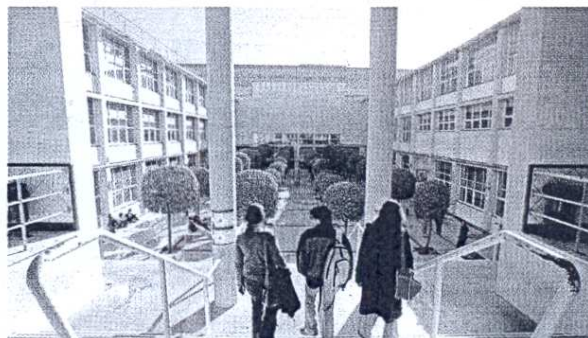
Patio de la Facultad de Psicología de la Universidad de Sevilla. /US

experiencia de las personas LGB en los contextos laborales de nuestro país, profundizando en las dinámicas que surgen en torno a la revelación de su orientación sexual en el trabajo. Concretamente, se estudia en qué medida los compañeros y supervisores fuerzan o facilitan este proceso de apertura sobre la orientación sexual y las dinámicas que ello provoca. Hacer preguntas insistentes sobre asuntos personales, difundir rumores dentro de la organización sobre la orientación sexual de un compañero LGB; o al contrario, «invitar» a dichos compañeros a no hablar de su vida privada o tiempo li-