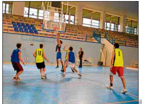
El baloncesto, en su formato de 3x3, regresa este mes al SADUS.

La Oficina Virtual mantendrá el proceso de inscripción abierto hasta el día antes del comienzo del torneo, hoy, miércoles 14 de enero de 2015.