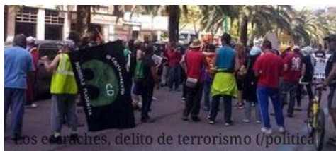
Los escaraches, delito de terrorismo (/politica/PP-pretende-converter-alteracion-terrorismo_0_345766354.html)

Investigación (http://www.eldiario.es/temas/investigacion)