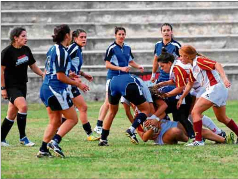
El rugby vuelve a escena en breve en el Complejo Deportivo Universitario de Los Bermejales.