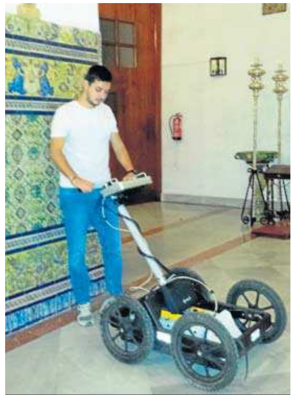
El georradar sirve para conocer el subsuelo.

Los resultados del estudio serán entregados a la oficina de obras de la Archidiócesis