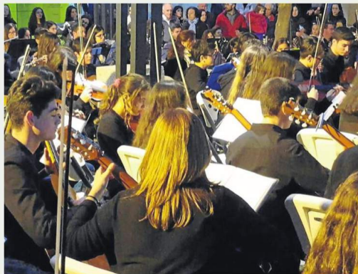
Orquesta Sinfónica del Aljarafe.