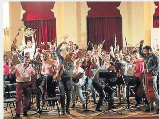
Orquesta Sinfónica de Triana.