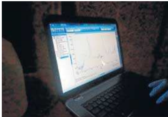
Los datos recogidos en un ordenador.