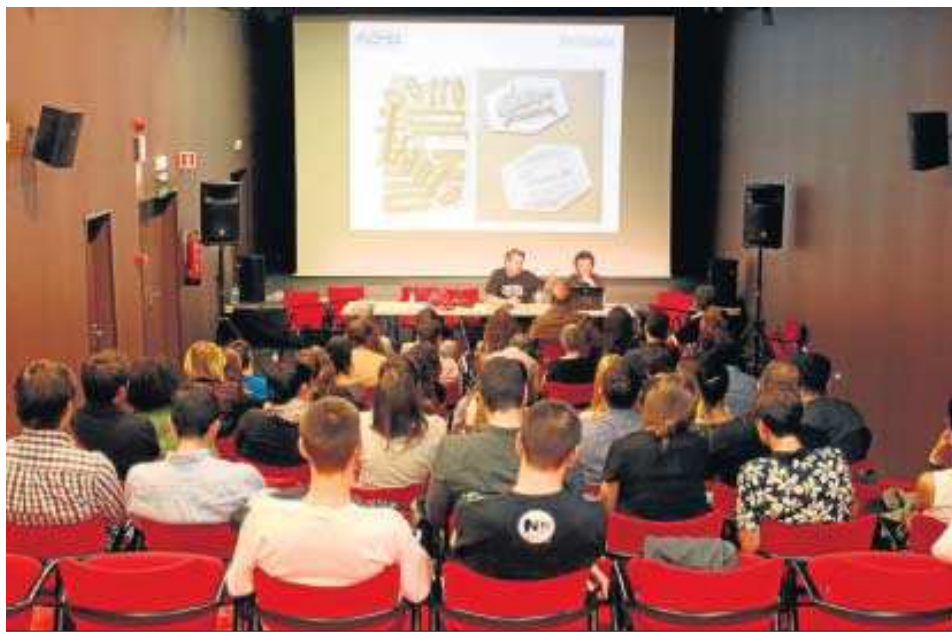
La idea es que Sevilla se convierta en un foro de discusión sobre las últimas tendencias del diseño.

● Profesionales del sector se dan cita del 24 al 29 de octubre para compartir, aprender, poner en común sus conocimientos y generar debate