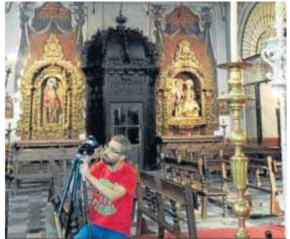
Un técnico tomando datos en la parroquia de la Magdalena.

● El programa Art-Risk busca establecer modelos que dictaminen el modo de actuar ante determinadas patologías ● Se han analizado varios templos sevillanos