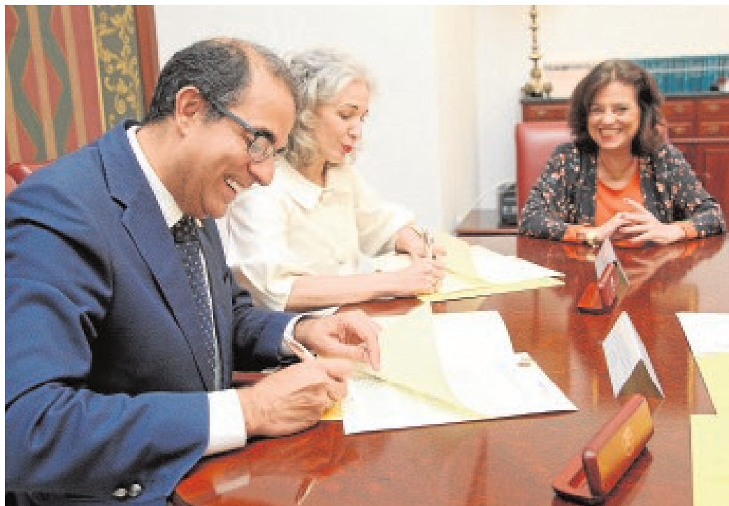
Sobre estas líneas, acto de la firma de los convenios