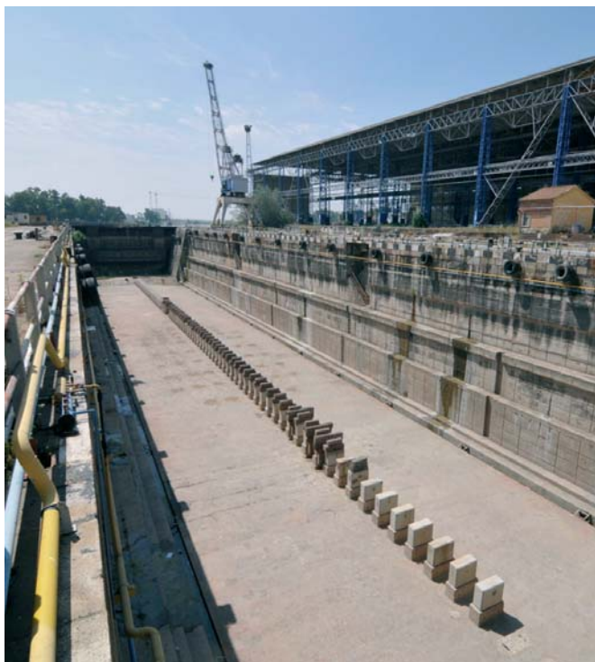
Las antiguas instalaciones de los astilleros de Sevilla acogerán la producción de torres eólicas.

Gri Towers Sevilla, perteneciente a Gestamp Wind Steel (Gonvarri), invertirá 54 millones de euros para la producción en Sevilla de estructuras metálicas y torres eólicas off shore para instalar aerogene-