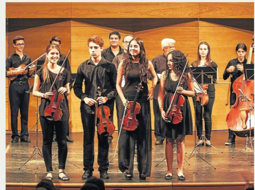
Interpretes de la Joven Orquesta Barroca de Sevilla.