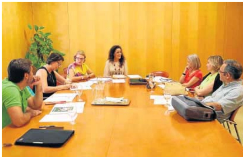
Reunión del jurado del Concurso 'Nuestra América', que convoca el Área de Cultura de la Diputación hace seis años.

Cultura. Seis trabajos se han presentado a este certamen que busca incentivar la investigación de las relaciones de países americanos vinculados con Sevilla