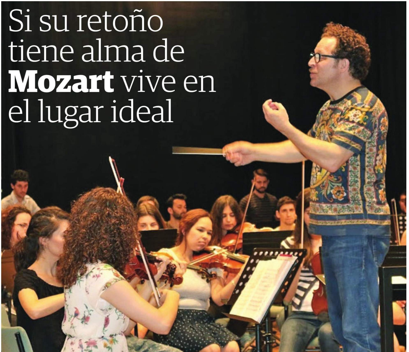
El director titular de la Sinfónica de Sevilla, John Axelrod, se puso al frente de la Joven Orquesta Sinfónica Conjunta el pasado mes de junio.

Orquestas menudas. Sevilla es la ciudad española con mayor número de agrupaciones sinfónicas dedicadas a dar una primera oportunidad a los jóvenes aspirantes a músicos