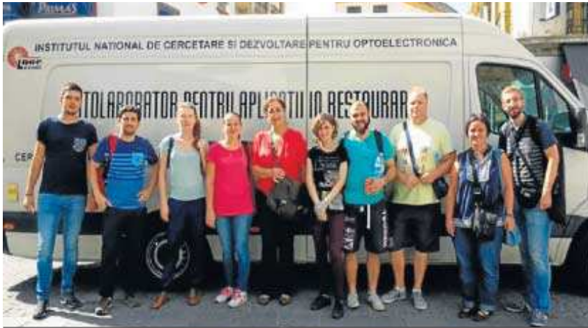
El grupo de investigadores, ante la ambulancia que cuenta con todos los dispositivos.