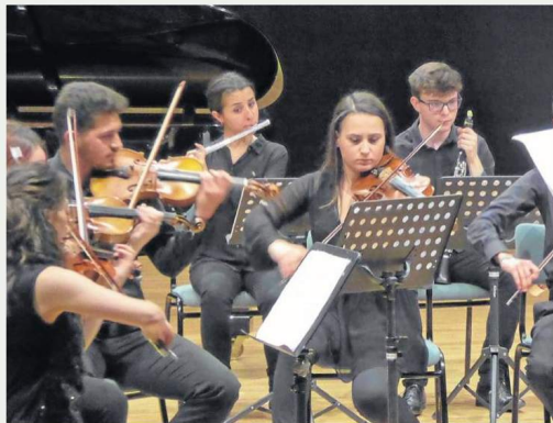
Detalle de un concierto de la Orquesta Sinfónica Conjunta.