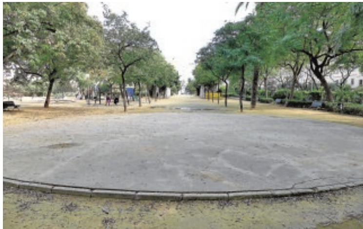
Los vecinos piden más actividad para los jardines de Federico García Lorca