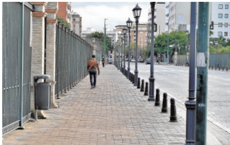
La avenida de la Buhaira, sin árboles, se convierte en un infierno en verano

ne, algo de lo que ahora no dispone», apuntan.