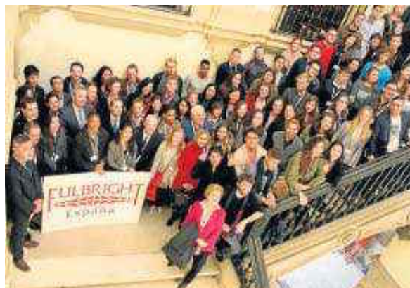
Encuentro de profesores de la Hispalense y estudiantes estadounidense. M. G.

En total, 344 andaluces han disfrutado en estos años de esta oportunidad, de los cuales 130 eran estudiantes de la Universidad de Sevilla. Actualmente, dos alumnos de esta institución académica continúan sus estudios en EEUU; y cuatro becarios estadounidenses lo hacen en Andalu-