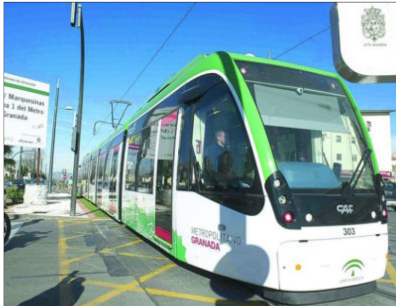
El metro ligero de Granada será el tercero en arrancar, a final de año, con un sobrecoste de cien millones

La movilidad a pie también es motivo de estudio de las universidades andaluzas, por encargo de la Consejería de Fomento y Vivienda, que pone especial énfasis en la implantación de rutas escolares a pie en colegios de primaria, para lo que invertirá 73.000 euros en una aplicación informática. A conocer la «integración en la planificación urbana y territorial» de Sevilla como ciudad peatonal destina casi 180.000 euros. La incentivación fiscal de la movilidad sostenible en los desplazamientos laborales de ida y vuelta constituye otra de las inquietudes de la Junta (180.000 euros, Universidad Hispalense). Málaga recibió 101.000 euros para el proyecto «movilidad inteligente: wifi, rutas y contaminación».