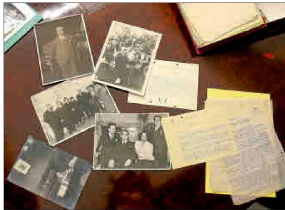
Fotografías y documentos del Archivo Blasco Garzón.