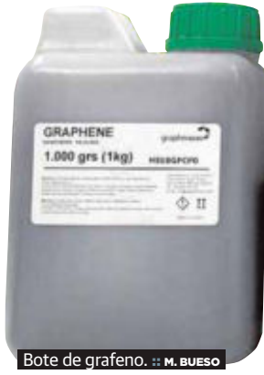
Bote de grafeno. :: M. BUESO

«Empezaremos a fabricar 80 millones de celdas al año, pero con eso no llegamos ni al 0,0001% del mercado»