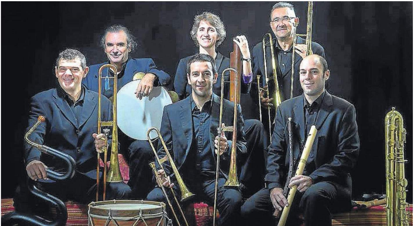
La formación sevillana de música antigua Ministriles Hispalensis.