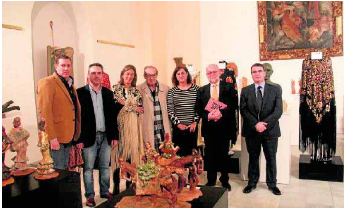
Las autoridades, junto a la conferenciante, en la inauguración de la muestra.