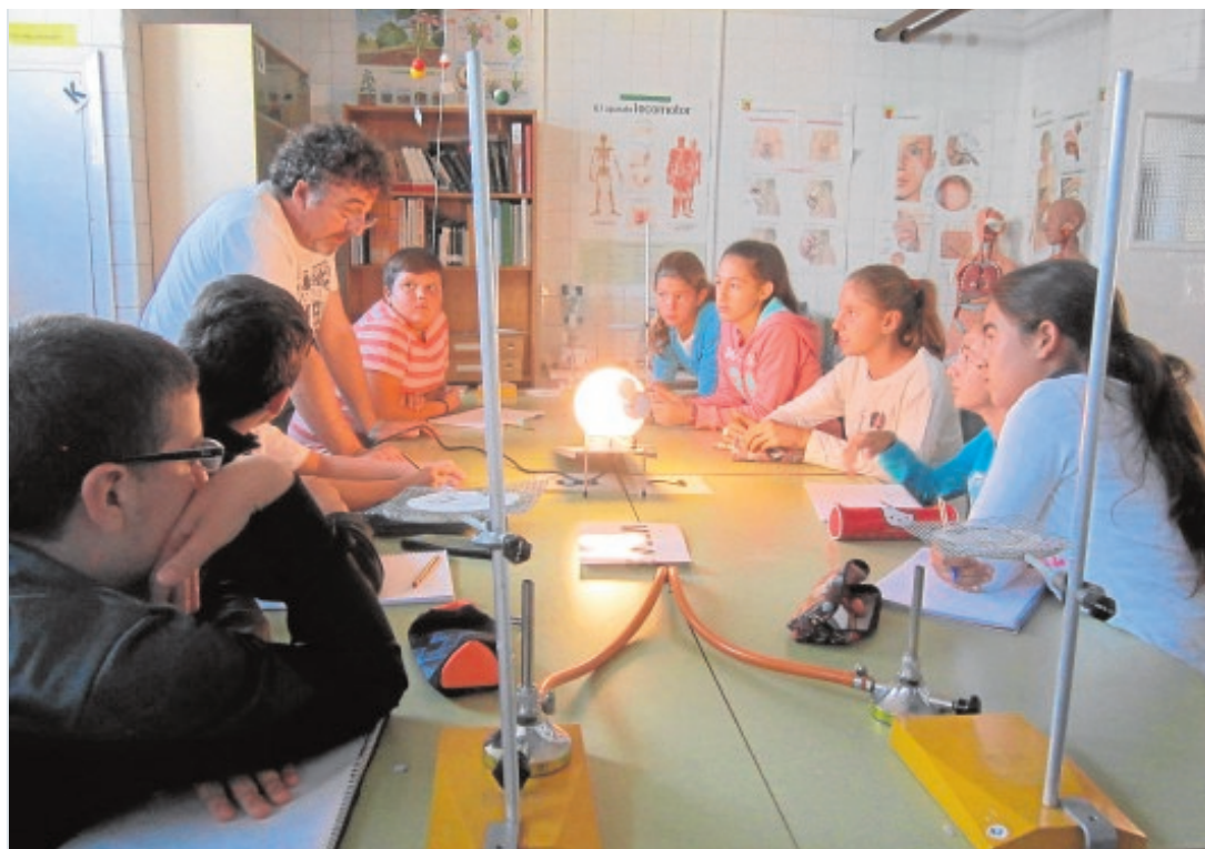
El alumnado del colegio Peñaluenga, en El Castillo de las Guardas, forma grupos de trabajo desde Educación Infantil a ESO y resuelven misiones con el método científico