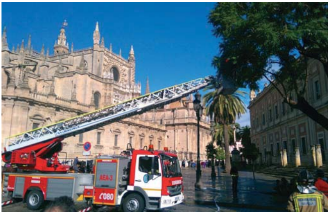
Los bomberos actúan por la caída de ramas en pleno centro de Sevilla.

Entre ellas, el 112 detalló que se recibieron avisos de caídas de árboles, cornisas, ramas, destrozos de mobiliario público, así como daños en antenas o chapas. Entre las más destacadas se encontraron la caída de una palmera en la calle San Fernando, junto al Rectorado de la Hispalense, que provocó el corte del Metrocentro y, además,