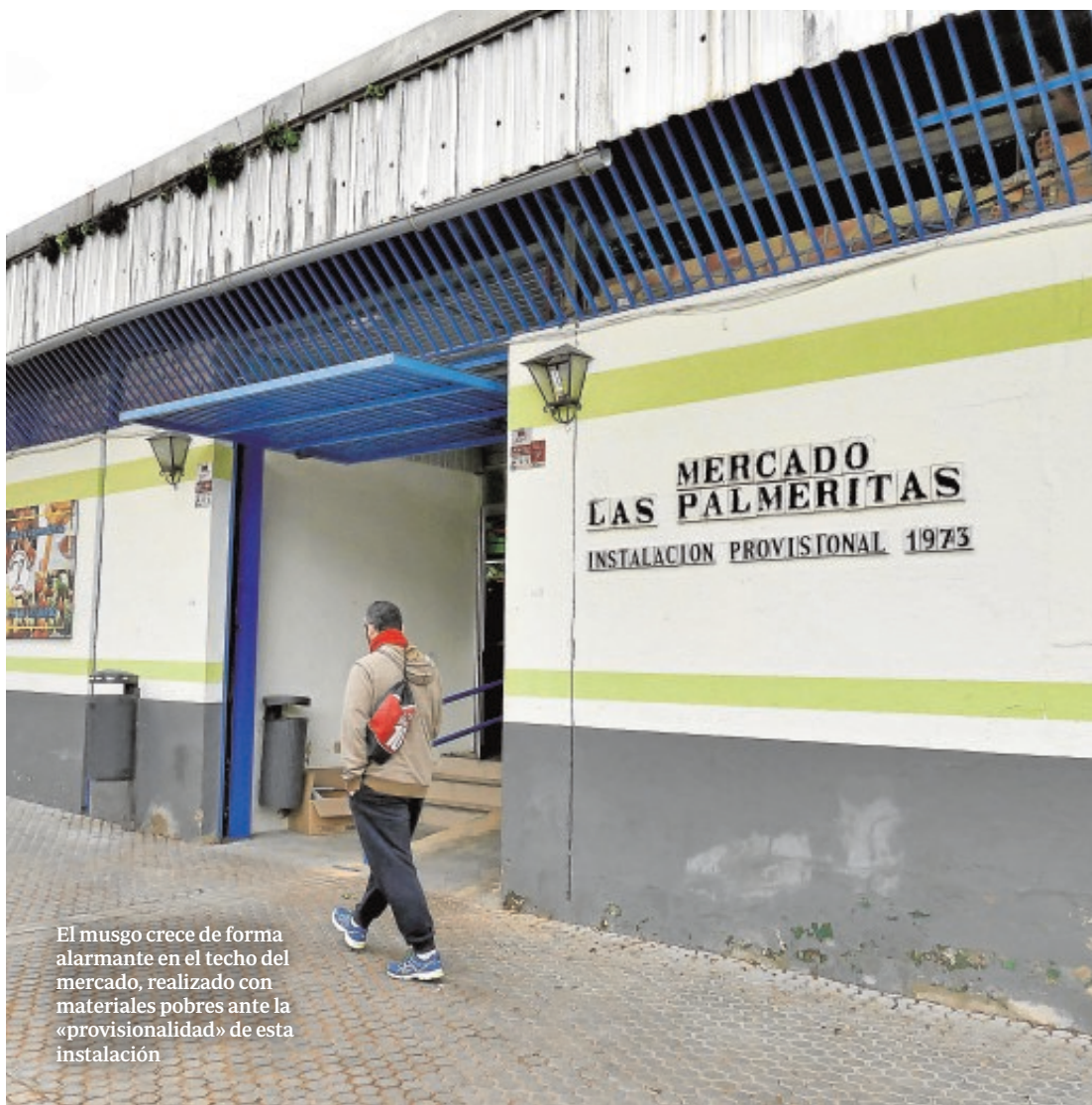
El musgo crece de forma alarmante en el techo del mercado, realizado con materiales pobres ante la «provisionalidad» de esta instalación