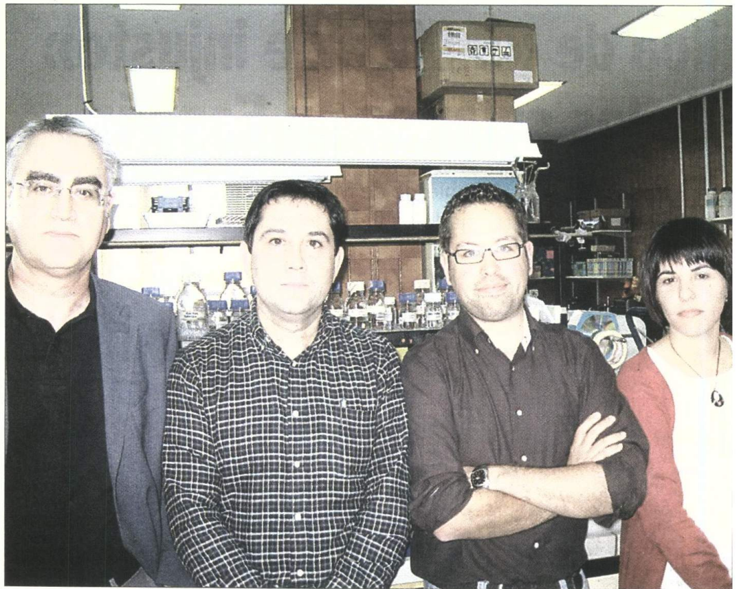
Los investigadores que han desarrollado y promovido esta nueva aplicación.

Para llegar a estas conclusiones los expertos desarrollaron y patentaron, en primer lugar, el nuevo ma-