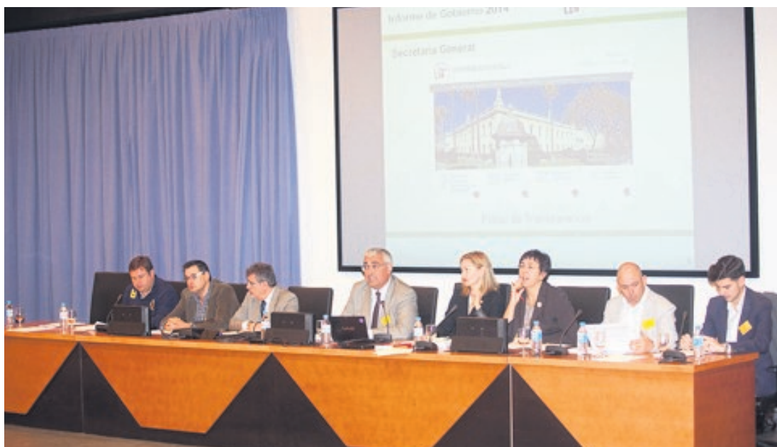
El rector de la Hispalense, en el centro de la imagen, en el transcurso de la sesión claustral de ayer