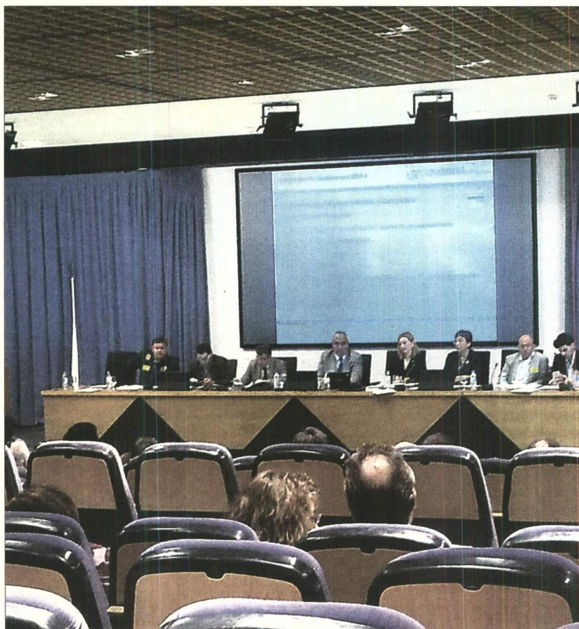
El claustro universitario se celebró ayer de forma excepcional en el salón de actos de la Facultad de Derecho.

Pero, sin duda, el asunto que más debate suscitó en el claustro fue el relacionado con la evaluación del profesorado. La Universidad de Sevilla va a implantar este curso un sistema propio para controlar «íntegramente» el proceso de evaluación por encuestas, de tal forma que ya no las pasarán alumnos becados (prohibido por el Gobierno). A par-