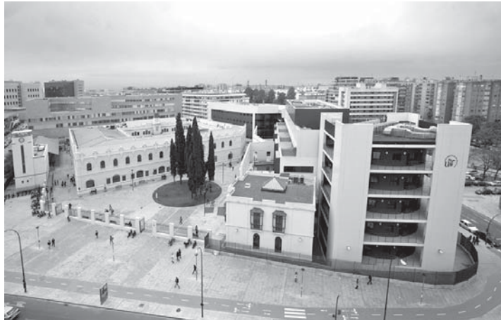
La Universidad de Sevilla ha perdido 400 docentes en tres años por la "insignificante" tasa de reposición. US

En el informe de gobierno, se destaca que este curso continúa la tendencia de matriculación "bastante estable" y con un grado de satisfacción aceptable en los grados. Los másters cubrieron el pasado ejercicio un 70% de sus plazas, con 4.000 matriculados, aunque la tendencia conti-