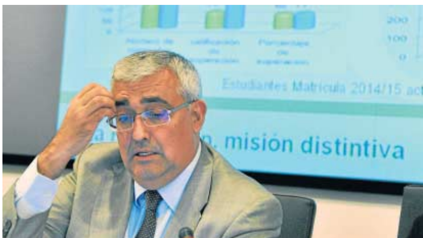
El rector de la Universidad de Sevilla, ayer, durante la celebración del Claustro, en la Facultad de Derecho.

por parte de la Hispalense las informaciones difundidas desde el ministerio que dirige José Ignacio Wert para defender que el aumento del número de becas concedidas en los últimos años. Así, según los datos difundidos ayer por el rector, si en 2009-2010 se concedieron un total de 13.045 ayudas, durante el último curso la cifra ascendió hasta 16.912, lo que supuso un aumento de casi el 30%. Sin embargo, también han crecido el número de becas denegadas, pasando de las 11.299 de 2009-2010 a las 11.930 del pasado curso, un 5% menos.