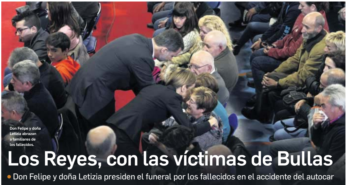
Don Felipe y doña Letizia abrazan a familiares de los fallecidos.

35 EL AUTOBÚS SINIESTRADO HABÍA SUFRIDO OTRO ACCIDENTE EN 2010