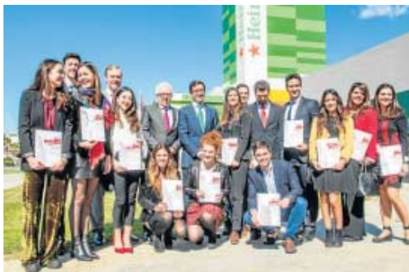
Los 14 premiados junto al consejero de Empleo y los directivos de Heineken.

Además del reconocimiento, los ganadores obtienen unas becas de prácticas remuneradas, de entre