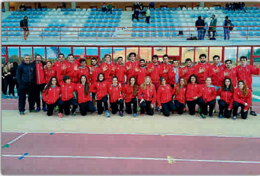
Los representantes de la Universidad de Sevilla se alzaron con el título en rugby 7.