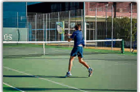
Los deportes de raqueta nunca faltan en el SADUS.

Para contar con más información sobre este torneo y consultar las bases de participación, se puede visitar la web ('www.pmsport.net/Liga-Ranking'). El SADUS continúa apostando por iniciativas deportivas eventuales para sus abonados, incrementando sus ofertas y diversificando su calendario de competiciones.