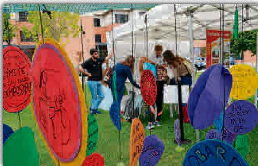
El SADUS busca colaboradores con dotes artísticas.

Todos los interesados en participar y formar parte de este programa pueden llamar al 954 482 002 de 09:00 a 14:00 o enviar un correo electrónico a eventosadus@us.es , indicando sus datos personales y una breve descripción sobre sus cualidades artísticas.