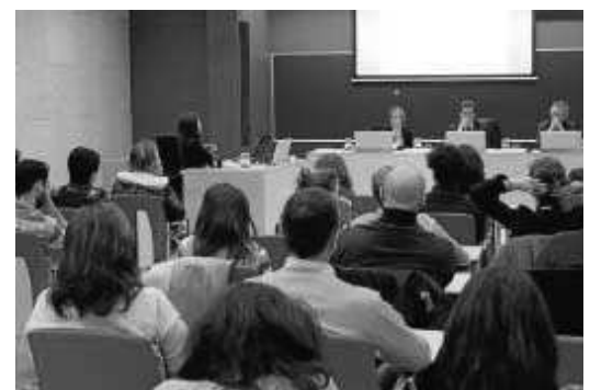
Defensa de una tesis en la Universidad Pablo de Olavide.