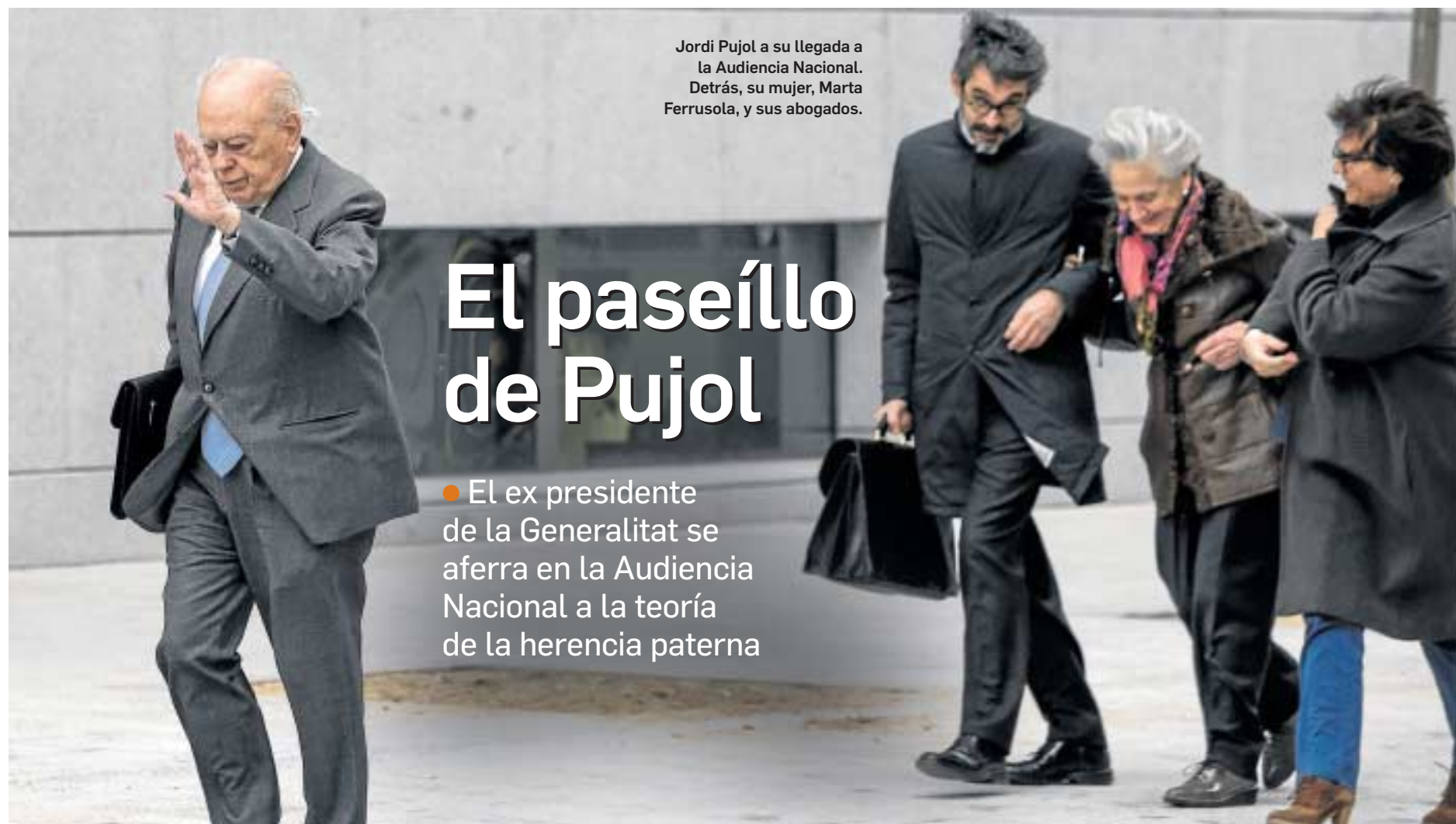
Jordi Pujol a su llegada a la Audiencia Nacional. Detrás, su mujer, Marta Ferrusola, y sus abogados.

38 ELUDE DAR EXPLICACIONES SOBRE EL DINERO LOCALIZADO EN ANDORRA Y SE DESVINCULA DE LOS NEGOCIOS DE SUS HIJOS