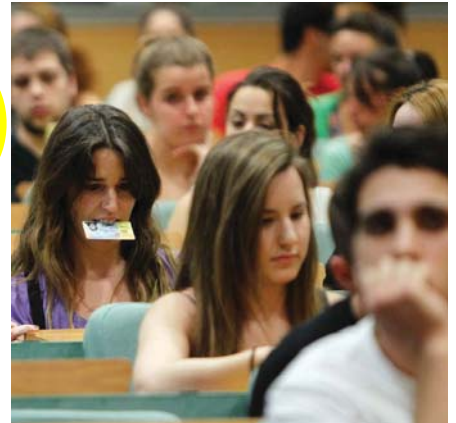
Estudiantes en un aula universitaria.

Tres de cada diez se consideran sobrecualificados y uno de