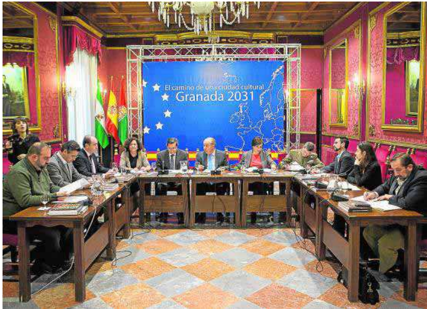
Los miembros de la comisión se reunieron por primera vez el pasado 2 de diciembre.