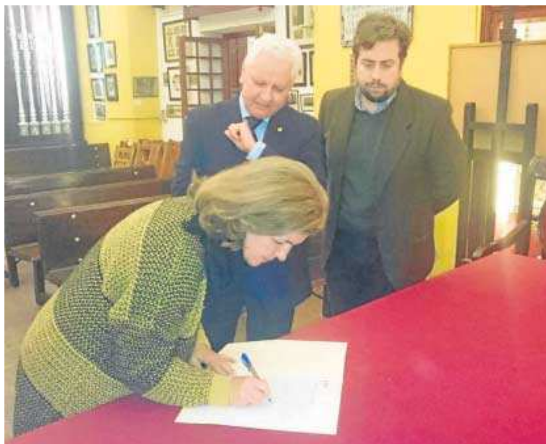
Momento de la firma del convenio realizada en la casa de hermandad de la cofradía universitaria.

Según informó la Asociación de Padres y Madres de Personas con Trastornos del Espectro del Autismo, en su búsqueda continua de la mejora de la calidad de vida de las personas con TEA