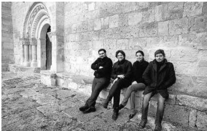
El cuarteto vocal Vandalia ofrecerá el día 19 un recorrido por el Renacimiento español.