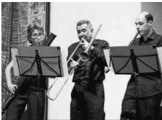
Ministriles Hispalensis, el grupo que abrirá la cita, durante un concierto reciente.

La primera velada, la de mañana en el Rectorado, estará protagonizada por el grupo sevillano Ministriles Hispalensis, que presentará un programa titulado Música para banquetes y batallas , basado en partituras de Arbeau, Holborne o Attaignant y con pinceladas francesas, italianas, inglesas, alemanas y españolas, a caballo todas ellas entre el Rena-