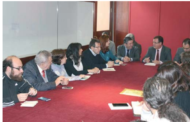
Un momento de la reunión de la mesa de la movilidad celebrada ayer, donde se abordó la zona azul.