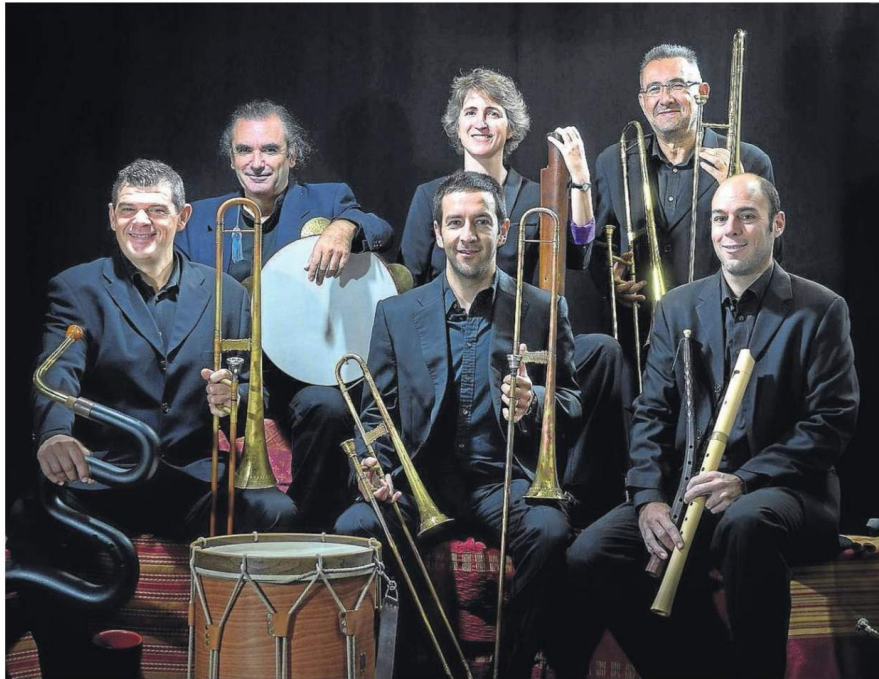
Los componentes de la formación musical sevillana Ministriles Hispalensis.

Serán, como se adelantó ya profusamente en estas páginas días atrás, tres visiones de programas basados en repertorios de música profana del renacimiento europeo a través de tres formaciones que van de la música instrumental a la vocal. La inauguración de la MAUS, a cargo de la referida formación sevillana Ministriles Hispalensis, arranca así con un grupo de reconocido prestigio que presentará su nuevo programa Banchetto musicale / Música para banquetes y batallas , un programa basado en música profana europea a caballo entre el renacimiento y el primer barroco.