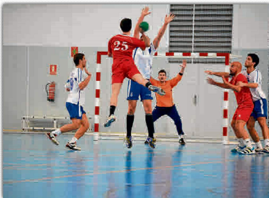
El día 9 de marzo se dará el pistoletazo de salida con el Fútbol Sala.