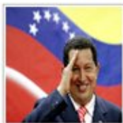
Hugo Chávez la dos caras de una misma moneda