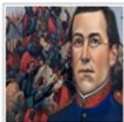
La celebración del 5 de mayo en México