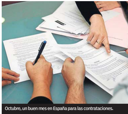
Octubre, un buen mes en España para las contrataciones.

veraniaga y las empresas aprovechan para hacer cambios en sus plantillas a fin de alcanzar los objetivos previstos para fin de año. Tanto es así que, previsiblemente, del total de con-