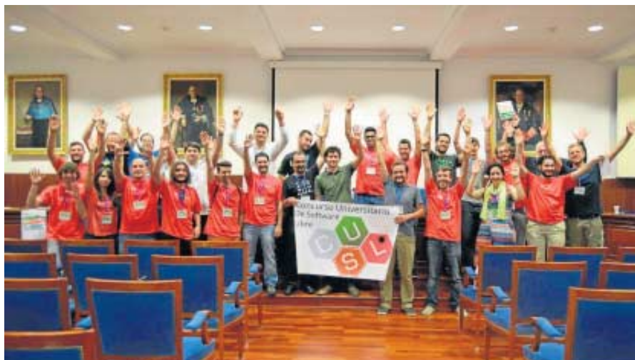
Participantes de la novena edición del concurso durante la final celebrada en Zaragoza.