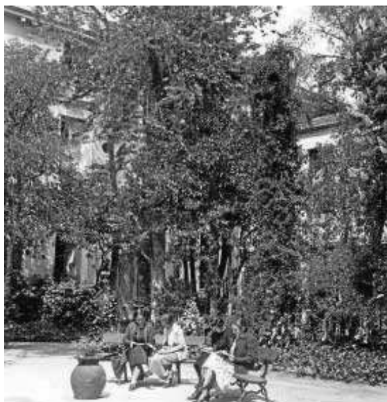
Unas jóvenes leen en el jardín de la Residencia de Señoritas.