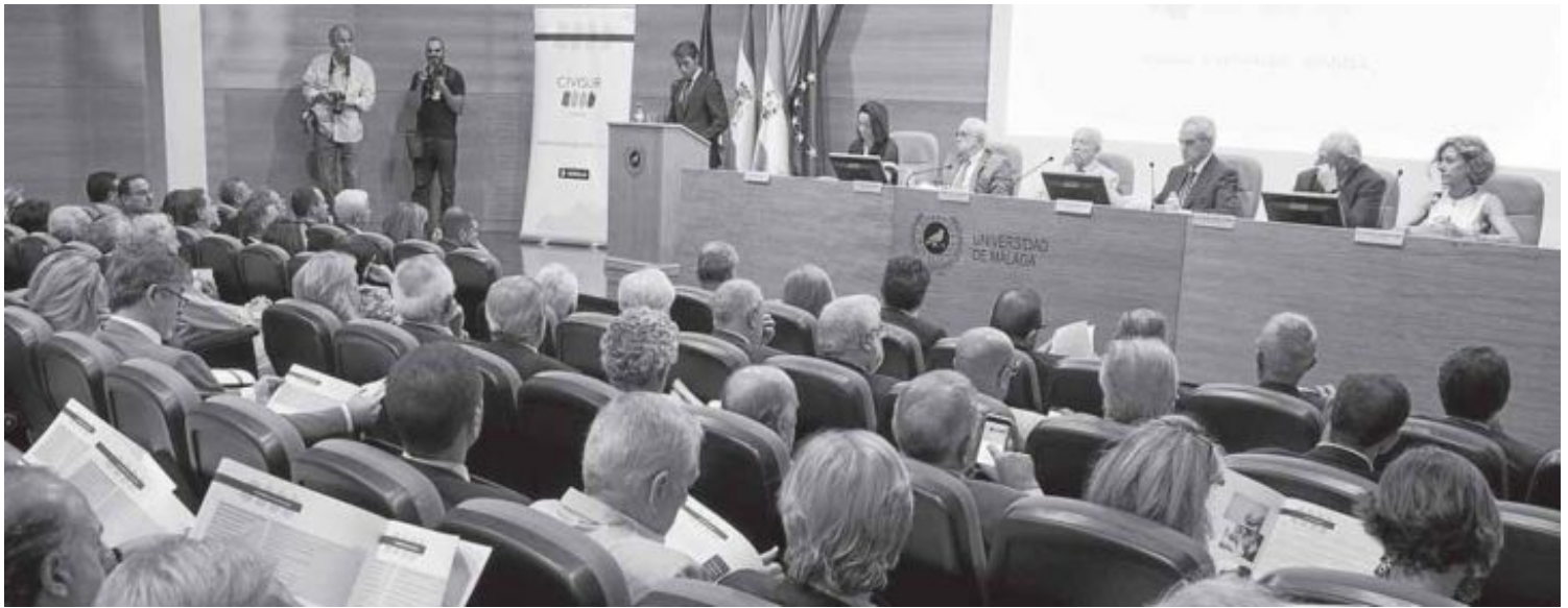
La puesta de largo de Civisur reunió en el Rectorado a una nutrida representación de la sociedad civil malagueña y sevillana.