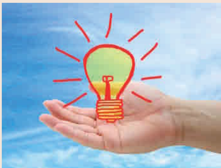
Es una iniciativa de Endesa y la Fundación Universidad-Empresa.

Tras el cierre del periodo de presentación de las ideas, un jurado seleccionará tres proyectos finalistas. Los estudiantes tendrán la oportunidad de compartir sus propuestas con expertos de Endesa en la materia, que colaborarán para enriquecer la iniciativa. Estos encuentros se desarrollarán en el interior de un vehículo eléctrico, denominado Endesa Van. Finalmente, en el mes de noviembre el jurado emitirá su fallo. La entrega de premios se realizará en las oficinas de Endesa en Barcelona.