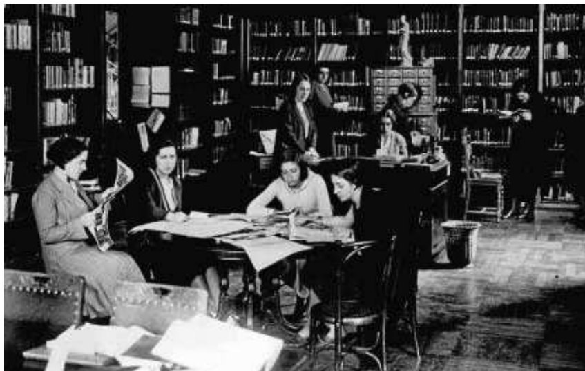
Estudiantes en la biblioteca de la institución.

Zenobia Camprubí, a la que el Centro de Estudios Andaluces reivindica estos días con una exposición en el Museo de la Autonomía, es la protagonista de otra