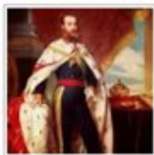
Hispanoamérica, no Latinoamérica (I)