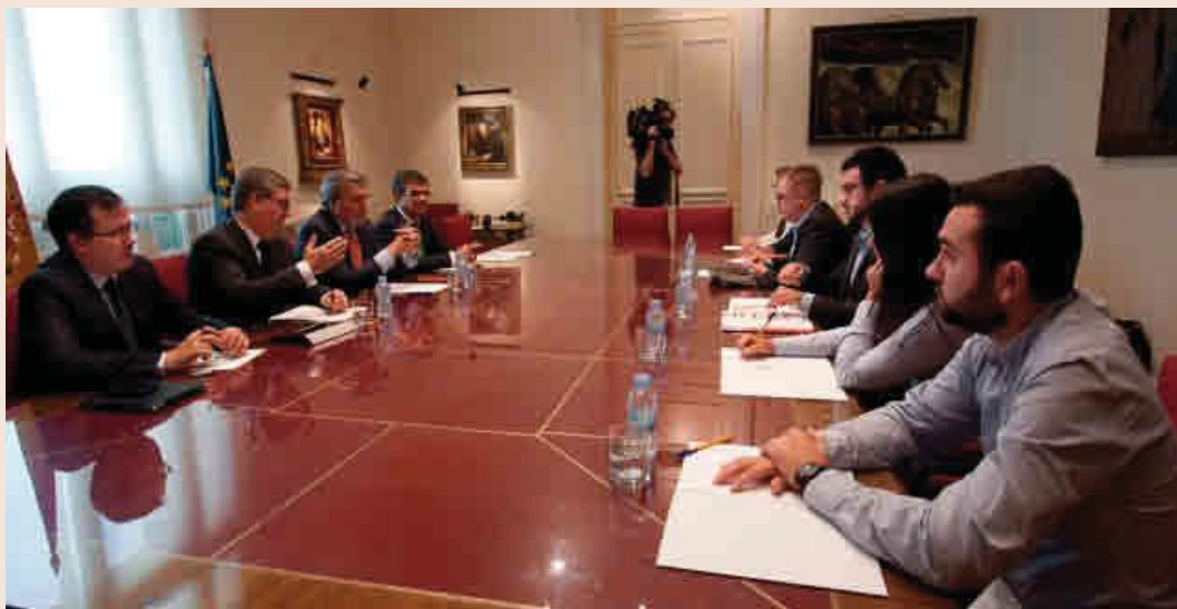
A mediados de septiembre, el ministro Íñigo Méndez de Vigo se reunió con representantes de estudiantes, rectores y ONG's para analizar las medidas que pondrá en marcha nuestro país en el proceso de acogida.

Como ellos, se prevé que miles de jóvenes del país árabe acudan estos meses a las principales universidades de nuestro país para al menos evitar que se rompan sus sueños de convertirse en médicos, periodistas, ingenieros, etc. y ejercer como tal a la vuelta a sus regiones de origen. También lo harán aquellos docentes que quieran continuar con su labor de profesor mientras estén instalados en nuestro país.