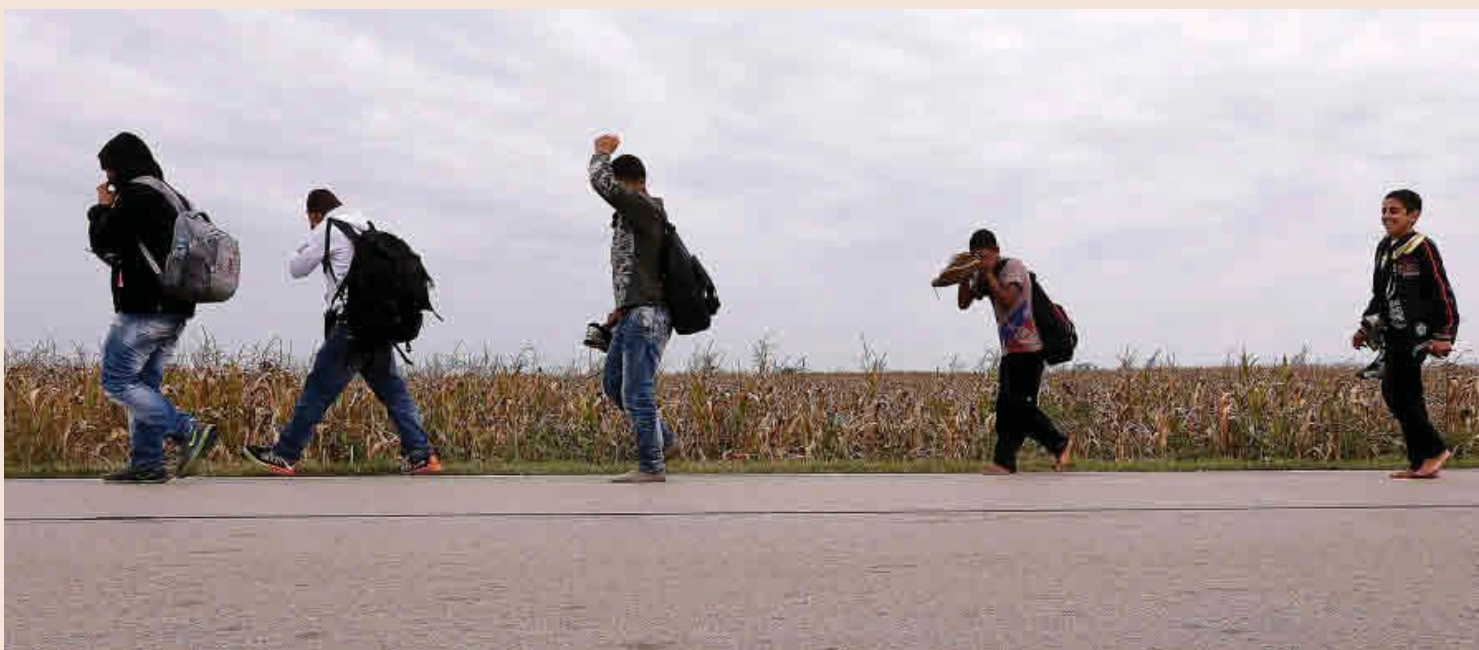
Varios miles de refugiados siguen entrando hoy desde Serbia a Croacia de forma ilegal e incontrolada.