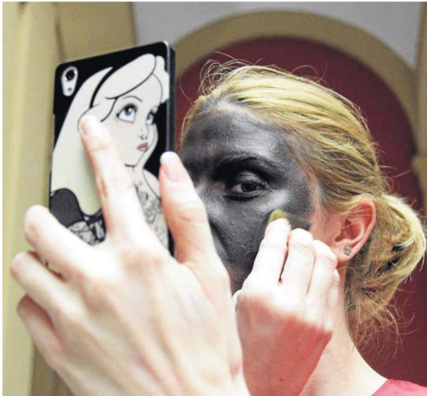
Hay quien no necesita ayuda para transformarse en emisario de los Reyes.