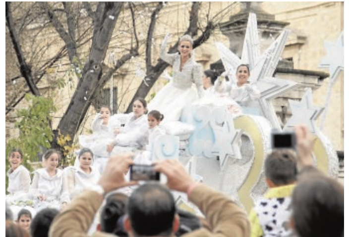
La Estrella de la Ilusión lanza caramelos al público