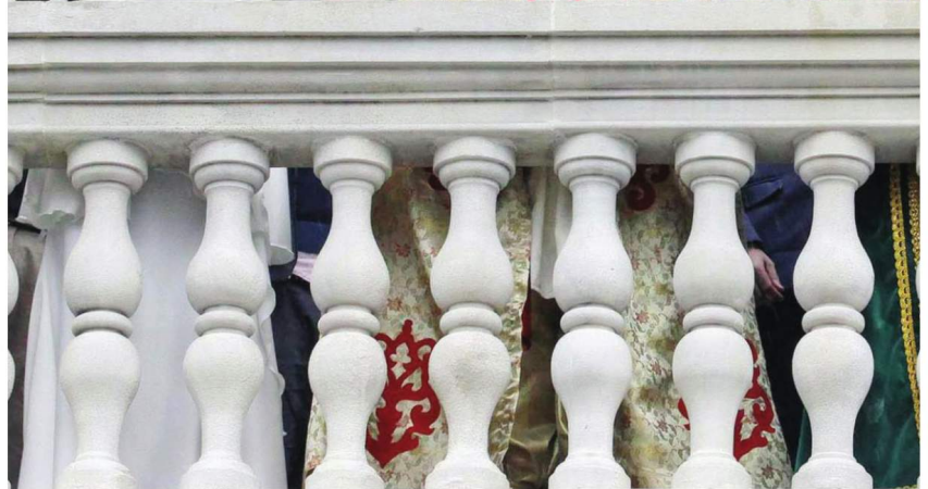
Las horas previas al saludo de los Reyes Magos desde el balcón de la Universidad son cruciales