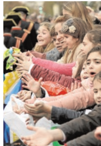
Un caramelo, un tesoro