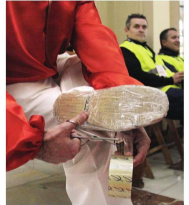
Cinta adhesiva para proteger los zapatos.