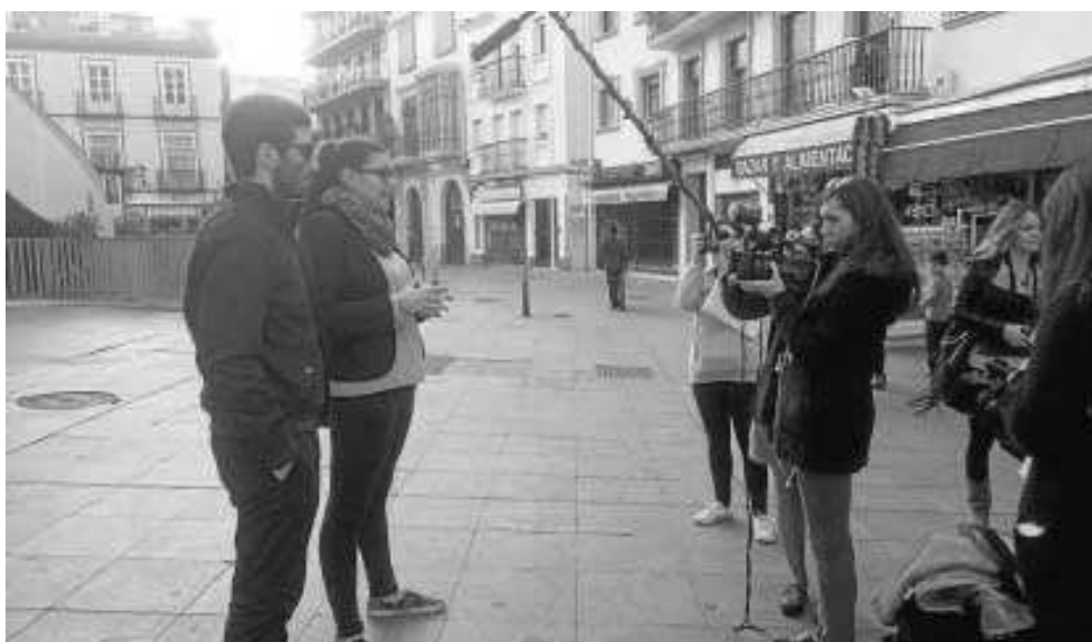
Imagen del rodaje del cortometraje.