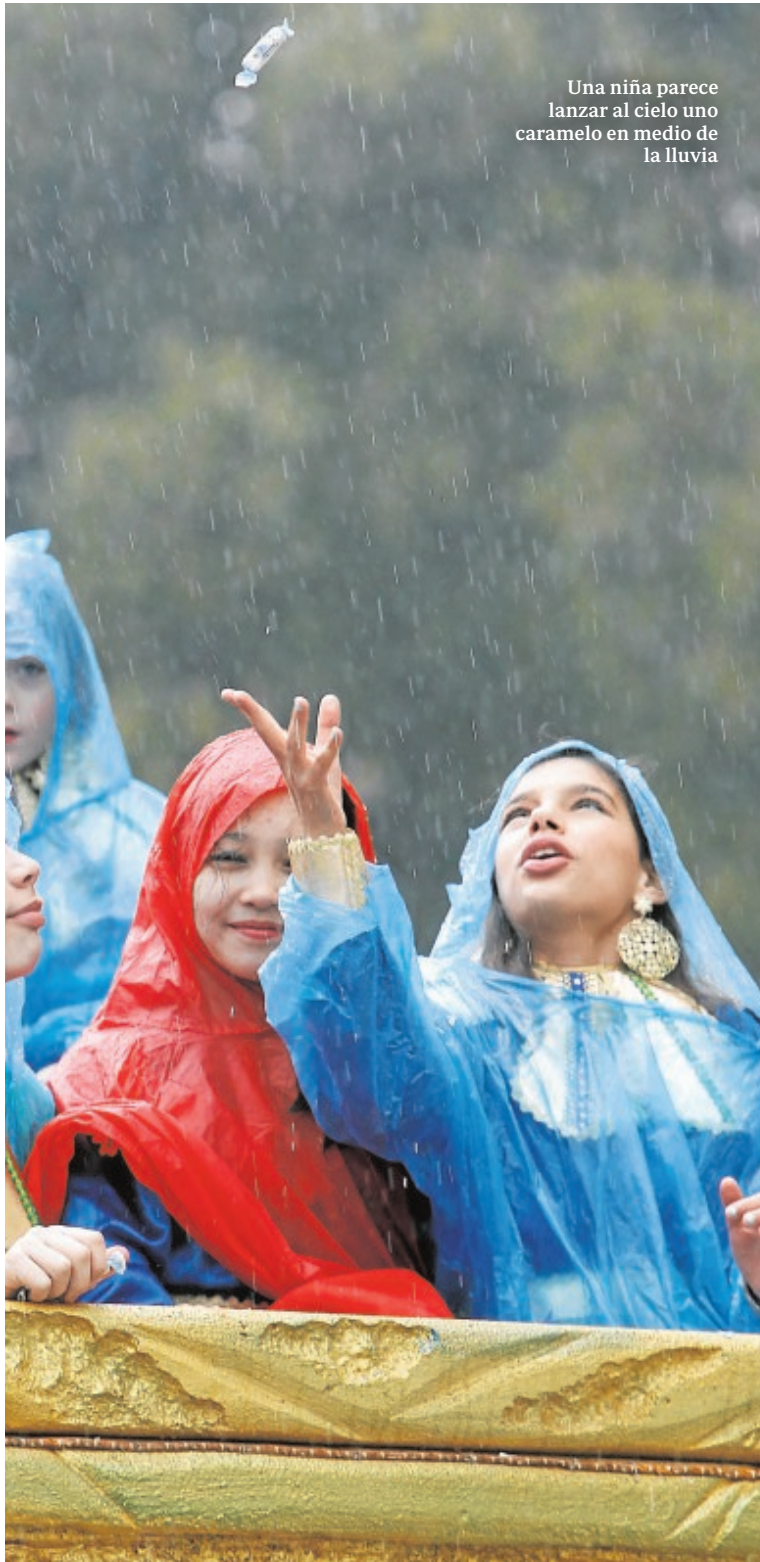
Una niña parece lanzar al cielo uno caramelo en medio de la lluvia

Espectacular lo de Lipsam. Los trabajadores de la empresa de limpieza avanzaban tras la cabalgata de los Reyes Magos retirando a gran velocidad los restos de caramelos