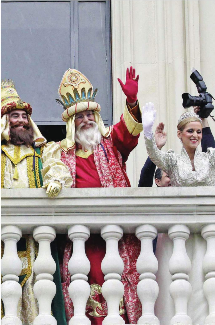
para la preparación de la comitiva.