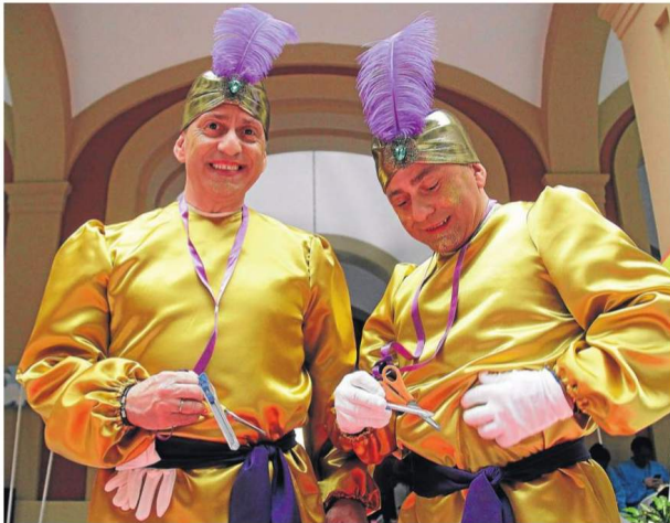
Tijeras y cúters como complementos para los pajes reales.