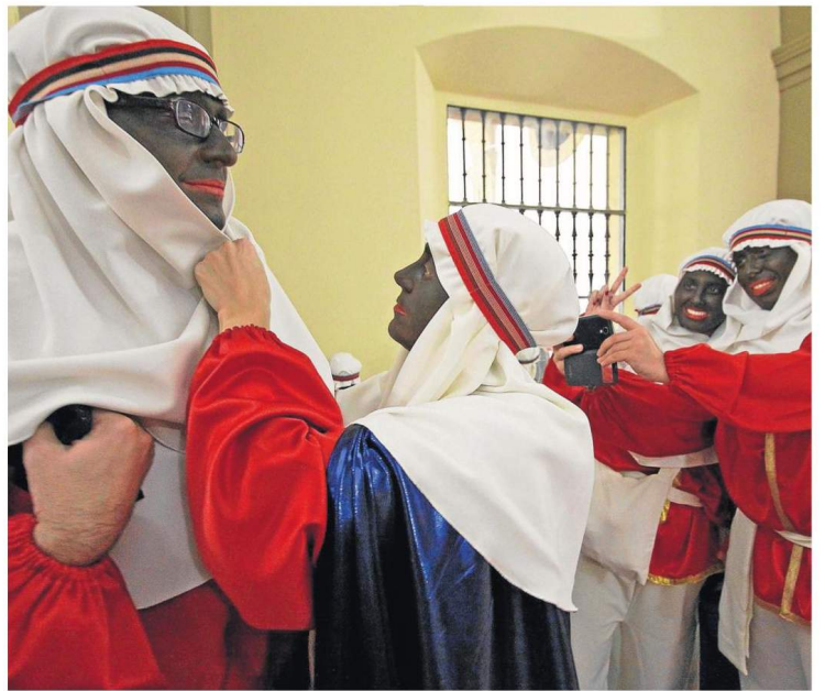
Últimos retoques de los beduinos y primeras fotos para recordar el momento.