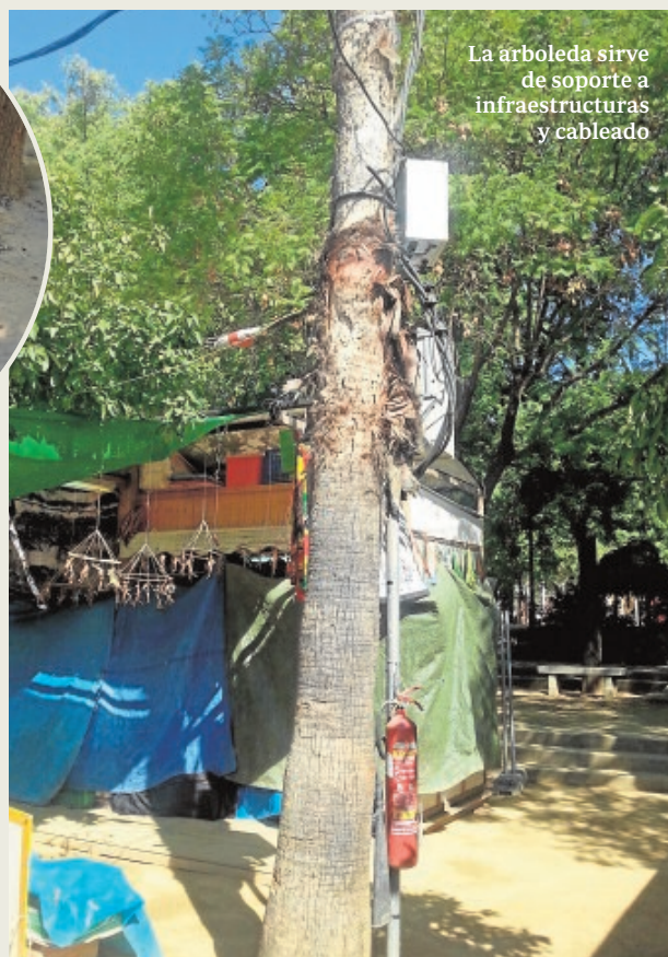
La arboleda sirve de soporte a infraestructuras y cableado