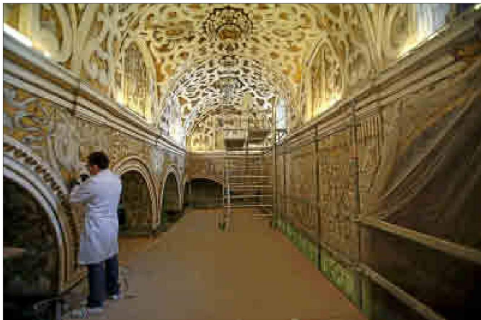
Un restaurador ultima detalles de las pinturas del templo. ESTHER LOBATO