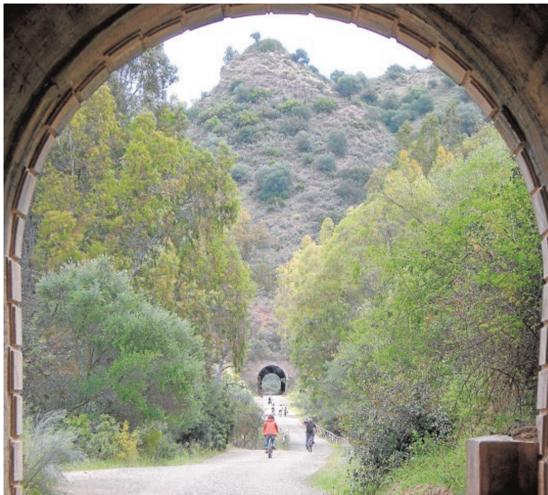
Un grupo de ciclistas atravesando los túneles de la Vía Verde de la Sierra de Cádiz

Dentro del mismo también está prevista próximamente la publicación de una aplicación gratuita para dispositi-