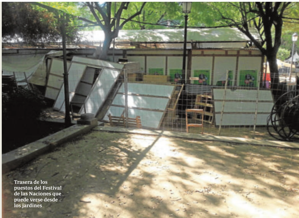
Trasera de los puestos del Festival de las Naciones que puede verse desde los jardines