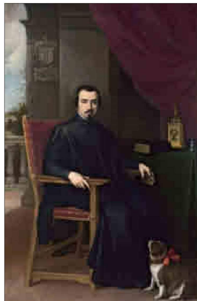
Retrato de Justino de Neve por Murillo. NATIONAL GALLERY

Uno de los descubrimientos curiosos a raíz de la restauración ha sido el hallazgo de una caja de documentos con antiguos padrones. Gracias a estos papeles se sabe que en 1649 —año en el que la población de Sevilla quedó diez-