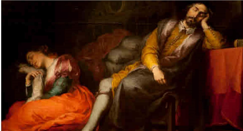
El lienzo 'El sueño del patricio Juan', de Murillo, que se encontraba en la Iglesia de Santa María la Blanca.