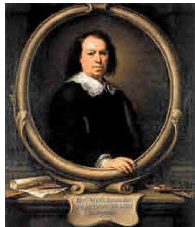
El célebre autorretrato de Murillo. NATIONAL GALLERY