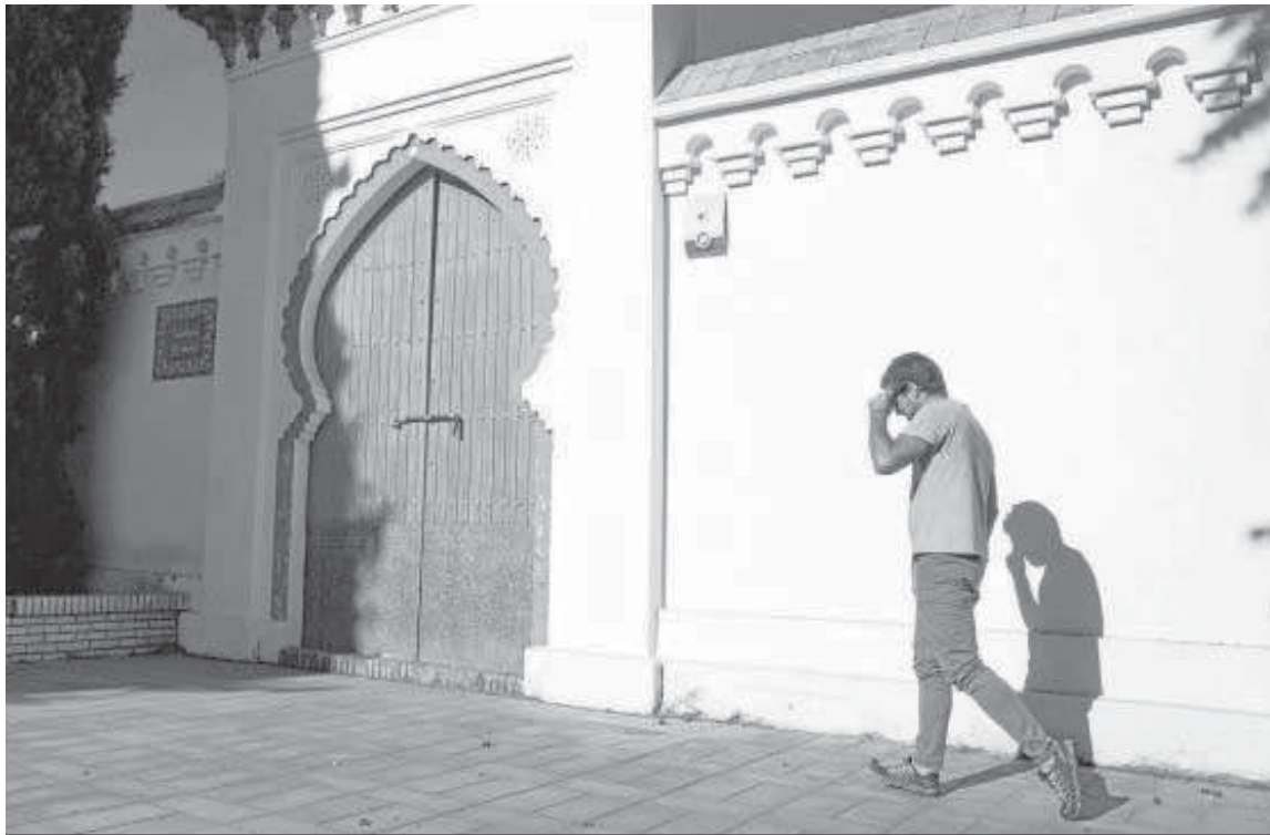
Puerta de acceso al cementerio musulmán anexo al camposanto municipal de San Fernando.