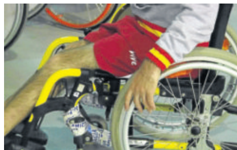
Silla de ruedas de un jugador de la selección.

Sevilla recibe durante esta primera semana de agosto el Open Mundial de Boccia 2017, una cita ineludible para los deportistas paraolímpicos