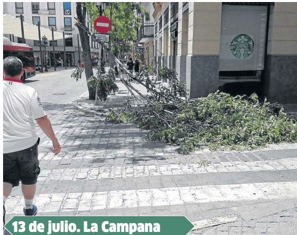
13 de julio. La Campana