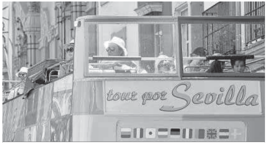
Uno de los autobuses turísticos que recorren la ciudad.