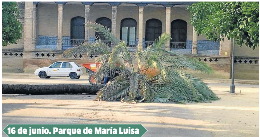
16 de junio. Parque de María Luisa