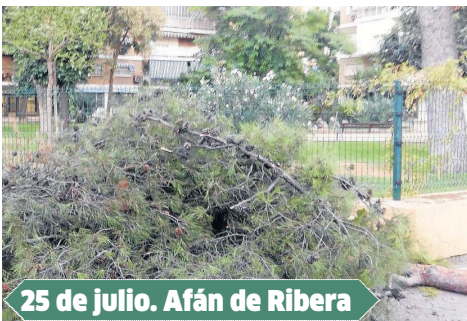
25 de julio. Afán de Ribera