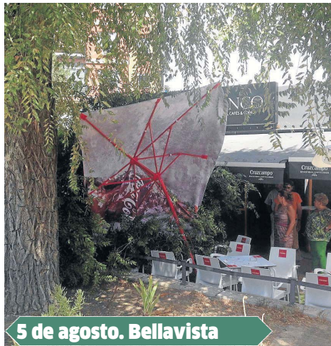
5 de agosto. Bellavista