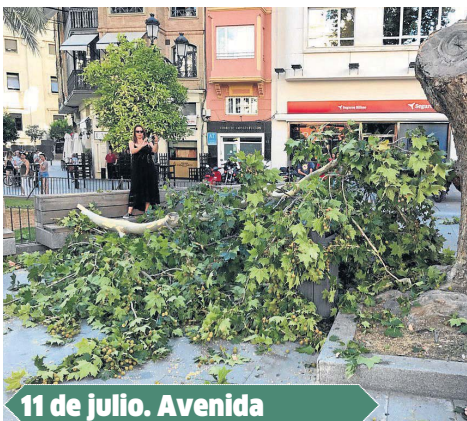
11 de julio. Avenida

barrio del Tiro de Línea y un plan para la barriada de la Oliva, donde ayer se desprendió un árbol de gran porte que incluso llegó a interrumpir el tráfico de vehículos.