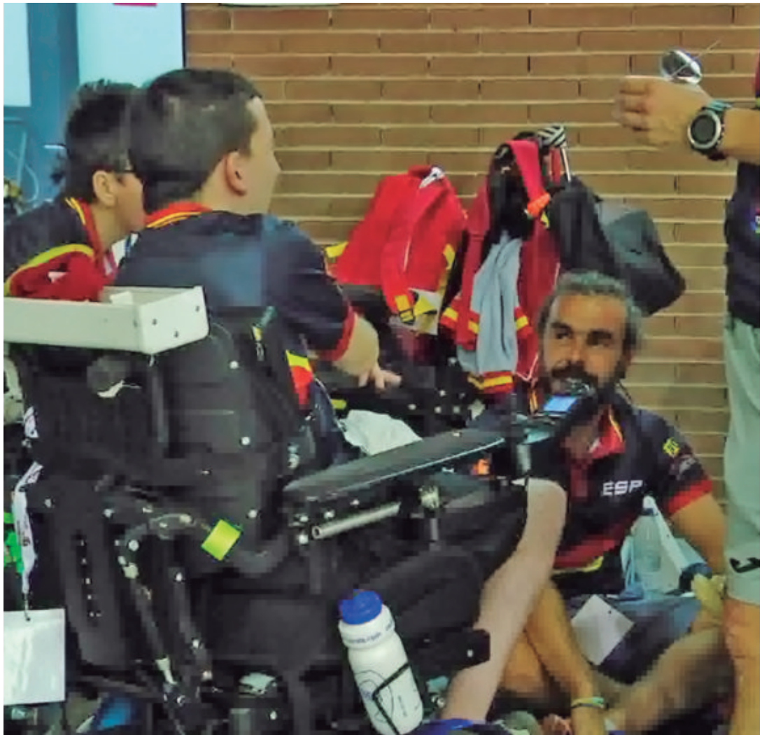
Jugadores y técnicos de la selección española de boccia se preparan antes de disputar un partido.