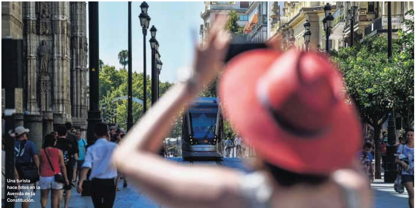
Una turista hace fotos en la Avenida de la Constitución.

● El número de este tipo de alojamientos se ha disparado un 50% en el último año