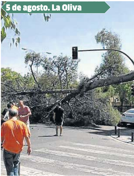
5 de agosto. La Oliva