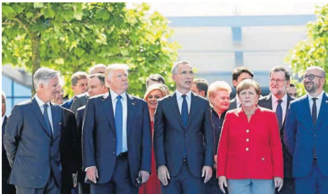
STEPHANIE LECOQ / EFE