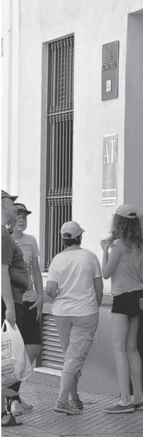
Una familia accede a un apartamento de la calle San Vicente.

Estos números no paran de crecer. En 2016, la Gerencia de Urbanismo gestionó 721 cambios de licencias de inmuebles residenciales para uso turístico. En lo que va de año (del 1 de enero al 3 de agosto), se han recibido 454 solicitudes de cambio de licencia y 42 para obras de nueva edificación o de reforma de un inmueble para la apertura de un hotel, apartamentos turísticos o hostel, según el Ayuntamiento de Sevilla. De he-