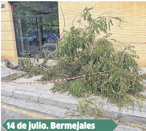
14 de julio. Bermejales