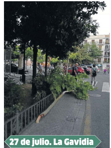
27 de julio. La Gavidia