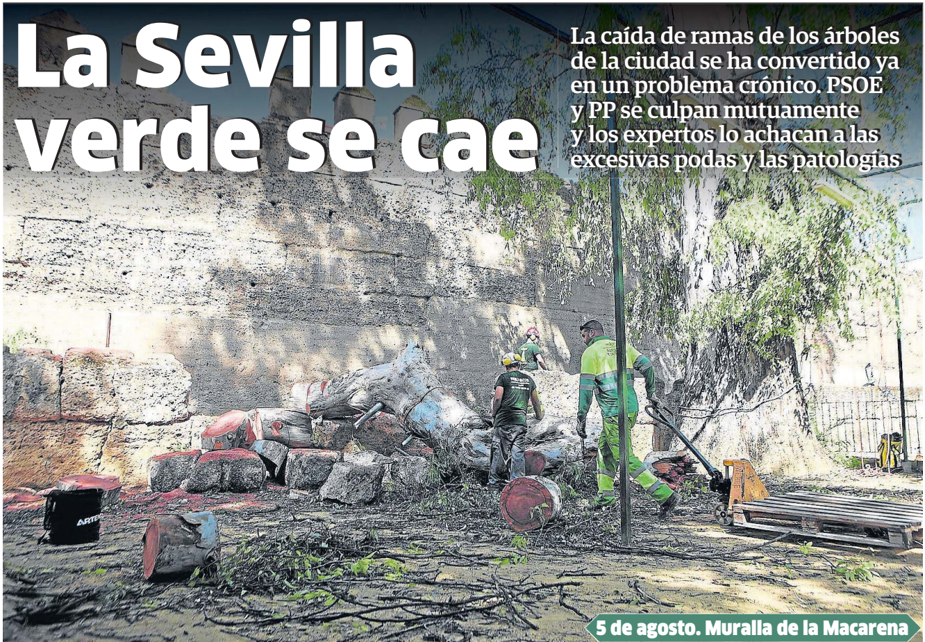
5 de agosto. Muralla de la Macarena

La caída de ramas de los árboles de la ciudad se ha convertido ya en un problema crónico. PSOE y PP se culpan mutuamente y los expertos lo achacan a las excesivas podas y las patologías