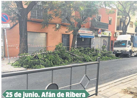
25 de junio. Afán de Ribera

dan sufrir, recuerda la importancia de tratar de manera adecuada al árbol en todas sus fases, desde su plantación hasta su regado, pasando por la poda y las diferentes tareas de mantenimiento. En este sentido, el catedrático destaca la relevancia de que los alcornoques tengan un tamaño adecuado para las raíces de cada especie, ya que a su juicio la falta de tierra en estos espacios es una de las grandes tareas pendientes en materia de arbolado en la ciudad. Esto