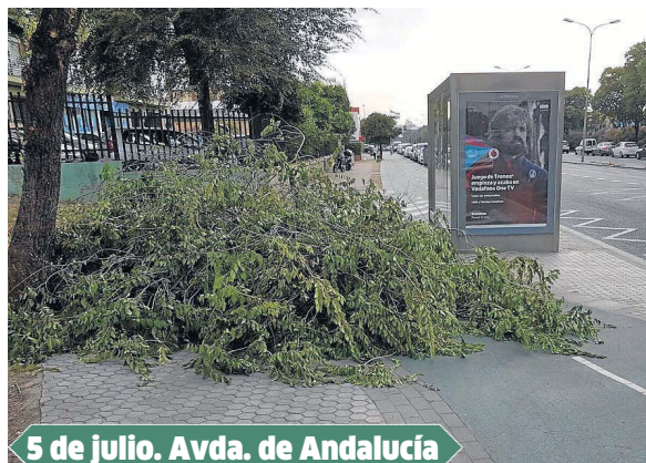
5 de julio. Avda. de Andalucía

provoca que las raíces levanten el acerado y que además condicione el normal crecimiento de los árboles afectados. «En Sevilla se han cometido muchos errores con los alcornoques, que no tienen suelo. Todavía tenemos que avanzar bastante».