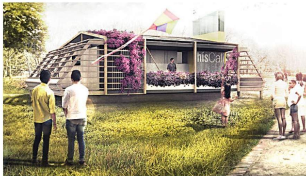
Últimos preparativos del equipo sevillano y recreación del proyecto.

de Sevilla, que cuenta con la colaboración de la Escuela de Ingeniería de la Universidad de Santiago Cali, propone una secuencia de viviendas construidas a partir de elementos prefabricados energéticamente autosuficientes y materiales reciclados que se puedan reutilizar tras el desmontaje.