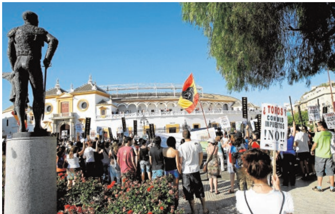
Manifestación antitaurina a las puertas de la plaza de Sevilla