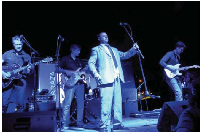
Avanti con la Guaracha inaugura el puente musical este jueves con su concierto en La Caja Negra.

TRIBUTOS Y JAZZ Se homenajeará a Joaquín Sabina y Celtas cortos, y habrá varias jam session