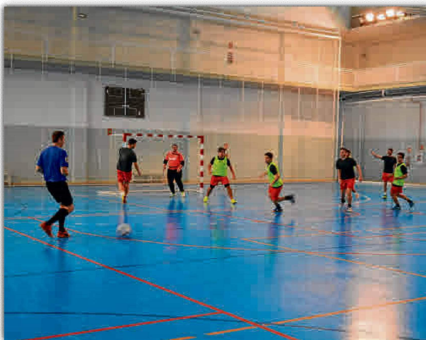
La liga de fútbol sala del SADUS ya se ha iniciado con los primeros cambios en la tabla.