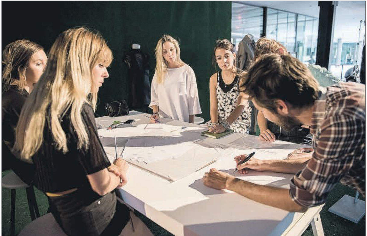
Estudiantes Erasmus trabajando en equipo en una de las universidades españolas.

Tres ciudades españolas se encuentran entre los diez destinos preferidos por los estudiantes: Madrid, Sevilla y Barcelona.