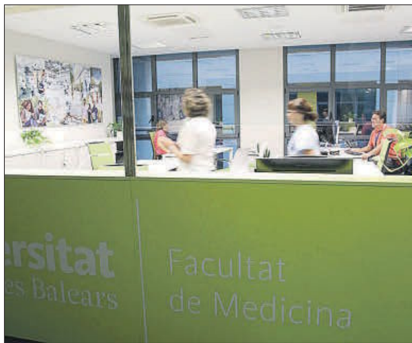
Facultad de Medicina de la Universidad de Baleares. EE

(CEEM) y el propio Ministerio de Sanidad. La facultad se ubicará en el campus de la Universidad Vic, que contará con una unidad docente en el campus de la UManresa.