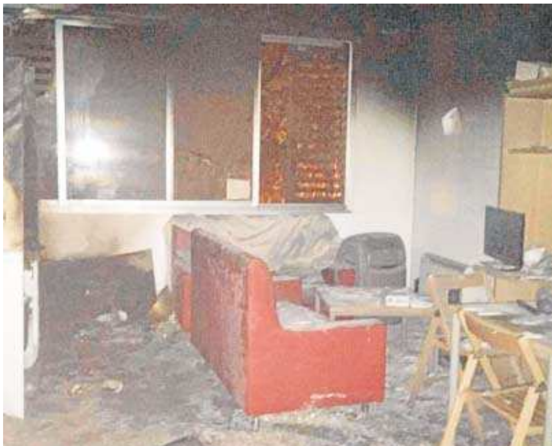
Imagen del salón-cocina en el que se originó el fuego.

La investigación la ha llevado a cabo el Grupo de Fraude Fiscal de la Brigada Provincial de Policía Judicial de Sevilla, y ha culminado con la puesta a disposición judicial de la detenida.