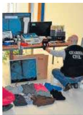
Parte del material incautado.

Según informó la Benemérita en una nota de prensa, componentes del área de investigación de la Guardia Civil de La Rinconada iniciaron la llamada operación Curtillo para esclarecer el aumento de delitos en el municipio, de manera que, en una de las urbanizaciones del término municipal procedieron a vigilar una serie de domicilios, ocupados ilegalmente, donde se sospechaba que se pudiera estar vendiendo droga. Los agentes comprobaron que los ocupantes de estas viviendas, en estrecha colaboración unos con otros, vigilaban permanentemente para eludir las posibles acciones policiales, mientras que también observaron