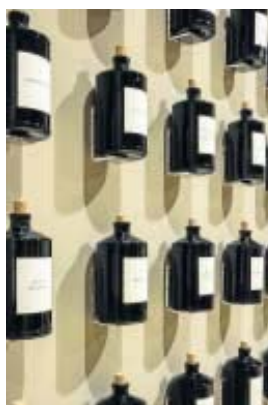
Sobre la tradición cultural. Obras como 'Correspondencia XVI', 'Autorretrato' o 'Historia de la literatura' forman parte de la muestra.

constructivista) y aun Mondrian y Moholy Nagy. No se trata evidentemente de réplicas sino de modos de emplear los diversos lenguajes: fragmentos de su léxico o rasgos de su sintaxis, resultado de una larga familiaridad con sus obras.