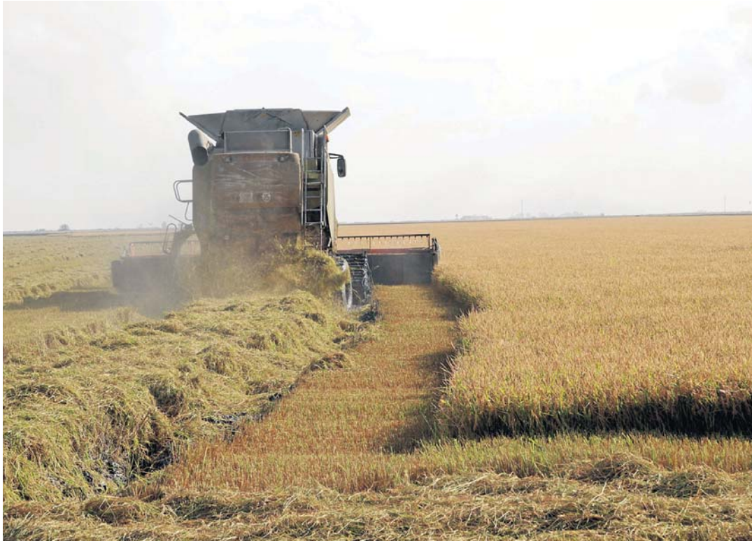
Campos de arroz en el municipio sevillano de Isla Mayor en una imagen de archivo.

El viceconsejero de Agricultura avanza que atenderá la petición del sector y le presentará a Bruselas una modificación que no se podrá aplicar hasta 2018