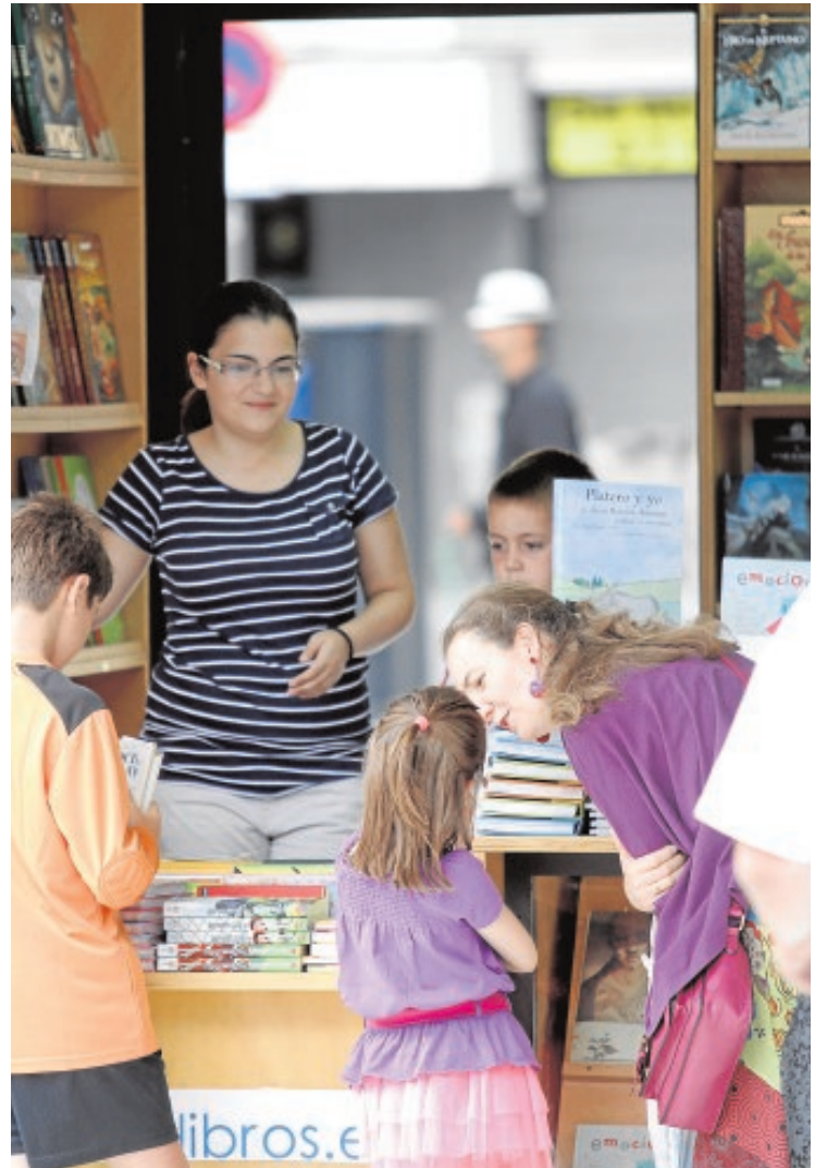
Niños en uno de los stands de la Feria