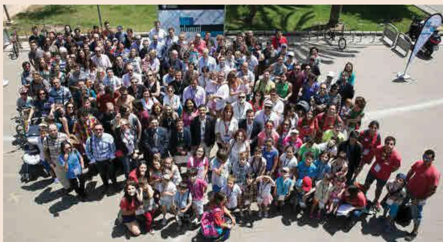
En muchas universidades, los egresados asesoran a los estudiantes universitarios en su futuro profesional.

una de las actividades estrella de muchas asociaciones.