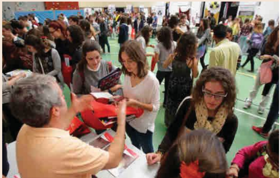
Los antiguos universitarios son los mejores embajadores de la marca de su centro por todo el mundo.

Por su parte, la Universidad de Navarra ha establecido una red con 37 agrupaciones territoriales nacionales y 3 internacionales, formadas por más de 250 delegados alumni y 25 representantes internacionales que voluntariamente colaboran, desde sus ciudades o países, en la internacionalización, empleabilidad y promoción de la Unav.