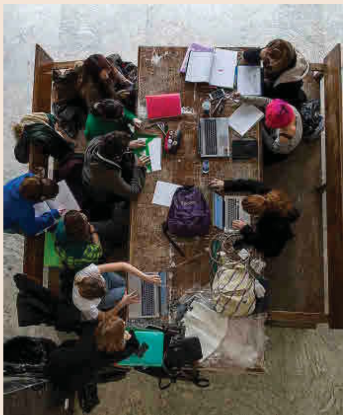
Vista de un espacio de la Facultad de Bellas Artes.

Para llevar a cabo este proyecto el pasado mes de junio Google empleó el trekker para registrar los exteriores, (una mochila equipada con un sistema de cámaras en la parte superior) y el trolley (carrito operado manualmente que toma imágenes en 360°) con el que se pueden tomar con todo detalle imágenes de los interiores. Como sucede en todas las secuencias de la aplicación "Street view" de Google en las imágenes no aparecen personas para salvaguardar su derecho a la propia imagen.