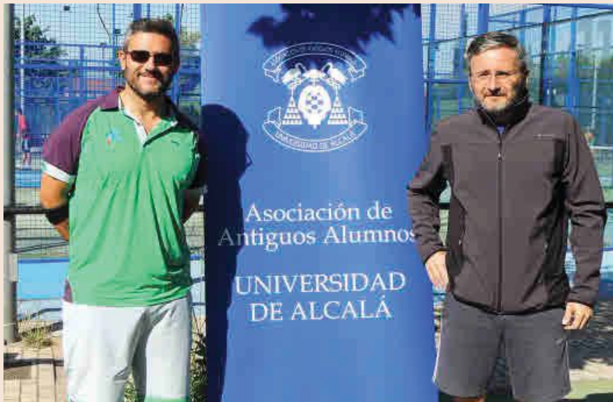
La UAH organiza un torneo de pádel entre sus antiguos alumnos.

De este modo, difunden la imagen de su centro por todo el mundo y captan a jóvenes extranjeros interesados en realizar una estancia en nuestro país.