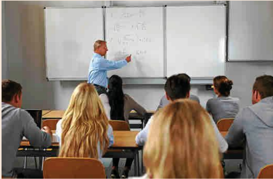
Un egresado asociado se beneficia de grandes descuentos en actividades de formación continua.

Muchos centros de nuestro país han convertido a sus antiguos alumnos repartidos por los cinco continentes en embajadores de su universidad.