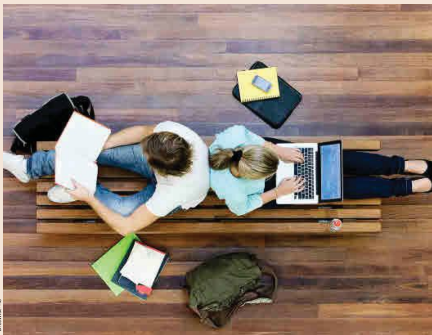
SlideWiki va a facilitar a los estudiantes reforzar los apuntes de algunas asignaturas y elaborar trabajos.

La plataforma será similar a la popular enciclopedia Wikipedia, pero los contenidos se organizarán por materias, niveles e idiomas, e incluirá no ya definiciones, sino explicaciones detalladas que puedan usarse tanto en docencia como para autoaprendizaje.