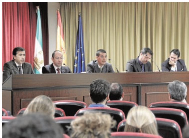
El acto se celebró en la Escuela de Ingenieros