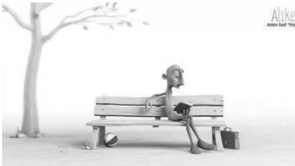
Fotograma del cortometraje de animación 'Alike', en torno al que se desarrollará una jornada.