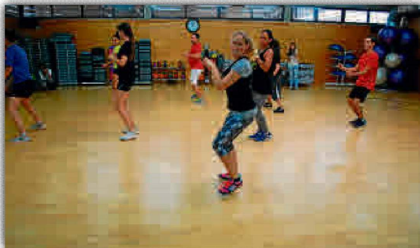
Los alumnos se lo pasan en grande en estas clases.

por lo que los que se animen podrán continuar con esta actividad. Por otro lado, en el CDU Ramón y Cajal, el SADUS también apuesta por el baile y propone para los martes y jueves, a las 19:30 horas, una sesión de Bailes latinos. Con estas actividades, el SADUS pretende también animar a sus usuarios para el próximo 15 de diciembre, día en el que tendrá lugar el Fitness Dance 2015 en las instalaciones de Los Bermejales. Desde el Servicio animan a sus usuarios a participar en estas actividades, haciendo ejercicio de una forma divertida y asequible para todos los perfiles. Además, el baile se presenta para adquirir rutina de ejercicio físico.