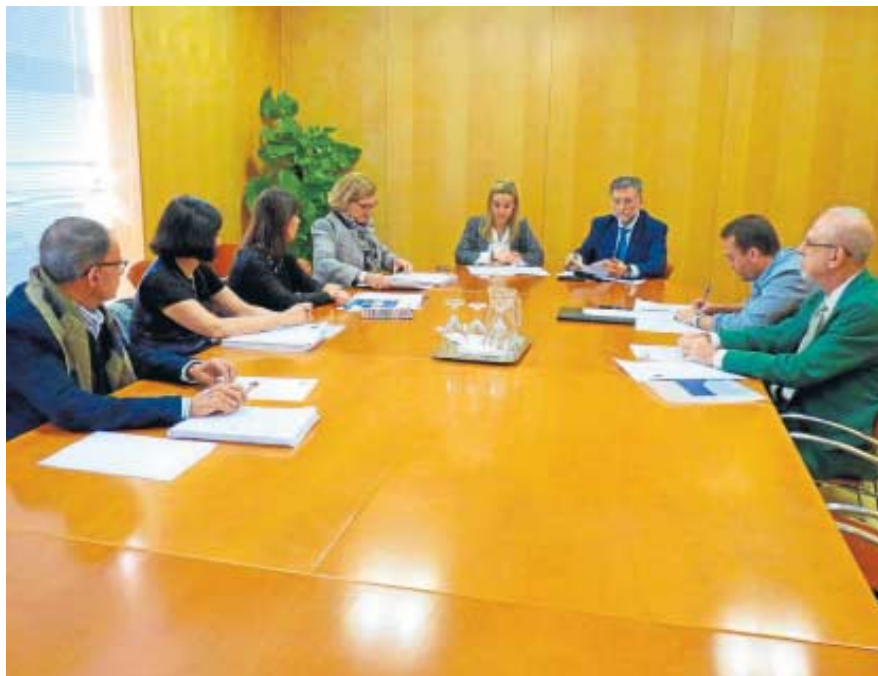
El jurado del concurso 'Nuestra América' durante el proceso de valoración de los trabajos presentados.

Cultura. Siete son los trabajos que se han presentado en esta edición de los galardones