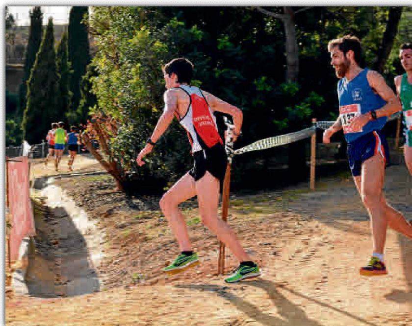
El parque de los Bermejales acogerá esta nueva edición del campeonato.