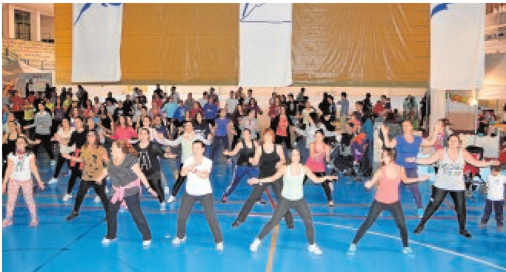
Un grupo de personas realiza el Fitness Dance